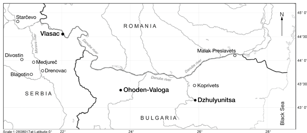
Fig. 1. Research area showing the location of the sites mentioned in the text. ● Sites studied by the authors.

Most of the territory under consideration south of the Sava and the Danube belongs to the Moesian phytogeographical province of the Balkan floristic sub-region, and is dominated by thermophilous mixed deciduous broad leaved forests consisting of oak and beech communities (HORVAT et al. 1974; KOJIĆ et al. 2001; REDŽIĆ et al. 2011). The European Vegetation Map (BOHN et al. 2003) considers the dominant types of oak forests in the area as “Pannonian-Danubian-Balkan lowland to submontane Balkan oak-bitter oak forests” and “Danubian-eastern Balkan lowland-colline mixed downy oak-bitter oak-grey oak forests”. These forests, present around the Danube and the Morava rivers and their tributaries, are dominated by various oak species like Quercus cerris , locally admixed Quercus frainetto , Quercus pubescens etc., as well as ash (e. g. Fraxinus ornus ), hornbeam ( Carpinus orientalis , C. betulus ),