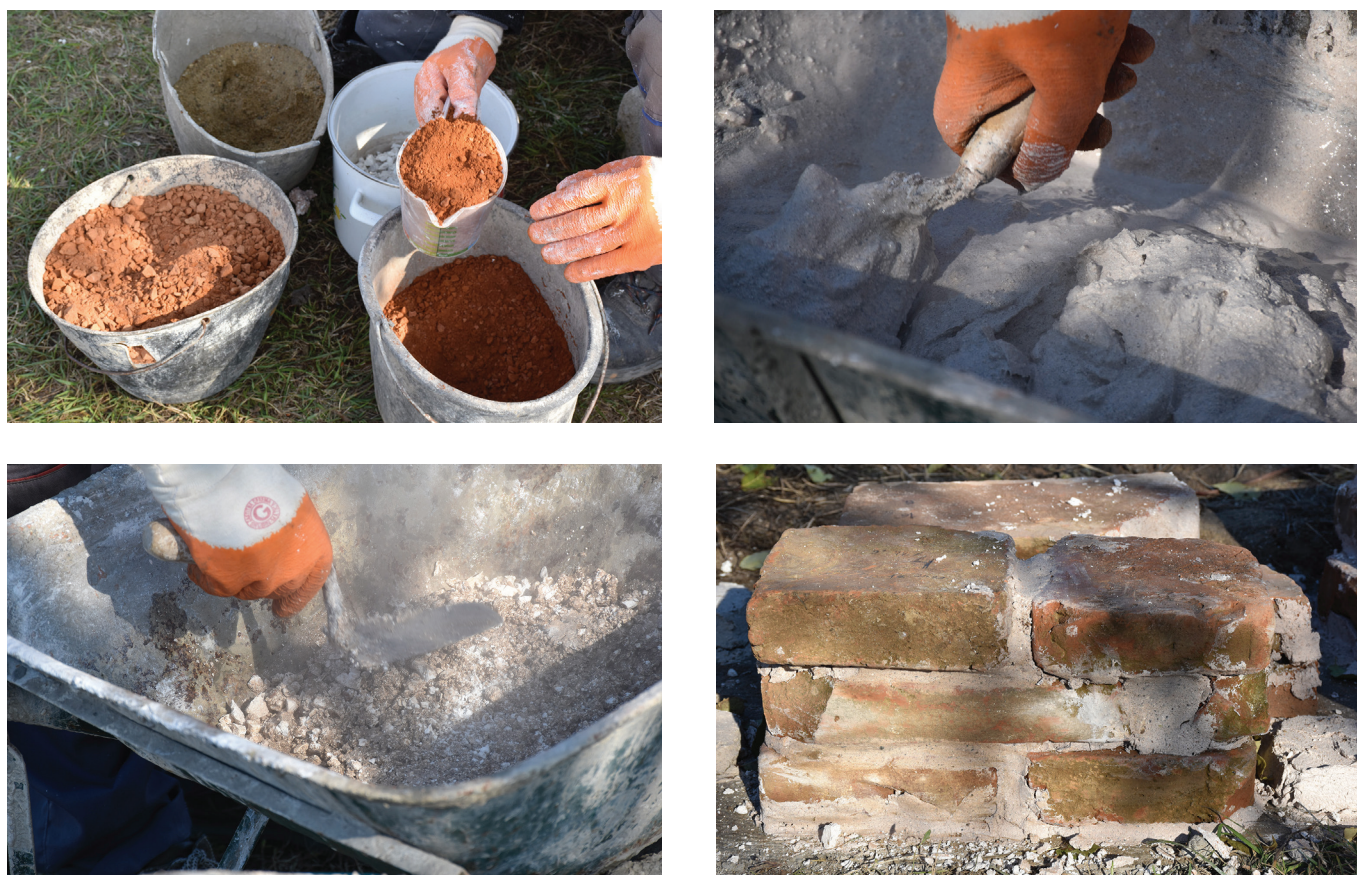
Сл. 6 Припрема и примена конзерваторских малтера током зидања експерименталних структура

нас, са апеловањем на опрезност, бригу о специфичностима примене нових материјала на „ сџарим констџрукцијама и ориџиналним маџтеријалима “, као и прецизно чување тачних података о свим примењеним материјалима и праћење њиховог каснијег понашања. 9 Високе вредности чврстоће и нефлексибилност које малтер уз употребу цемента постиже, али и паронепропусност и проценат алкалија у његовом хемијском саставу, довели су до уништавања историјске опеке, камена слабијих својстава и самих историјских малтера, а последично некада и рушења читавих елемената грађевина. Нажалост, тек са појављивањем оштећења на грађевинама након употребе цемента, започео је и интензиван позив међународних стручних тела за престанак његове употребе у архитектонској конзервацији, што је нарочито важно код његовог непосредног контакта са историјским материјалима и код структура изложених атмосферским утицајима.