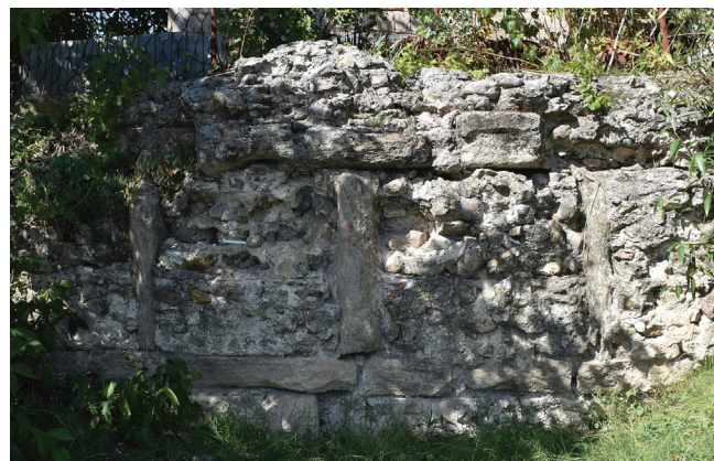
Сл. 2 Предела и грађевине током теренског истраживања, а) остаци виле Виминацијума, б) поглед на реку Дунав са простора Ледерате, в) остаци Трајановог моста и г) бедема града Акве