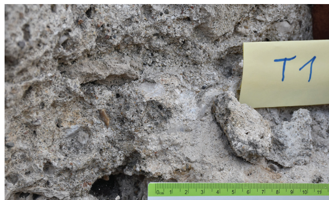
Сл. 3 Узорковање малтера током теренског истраживања