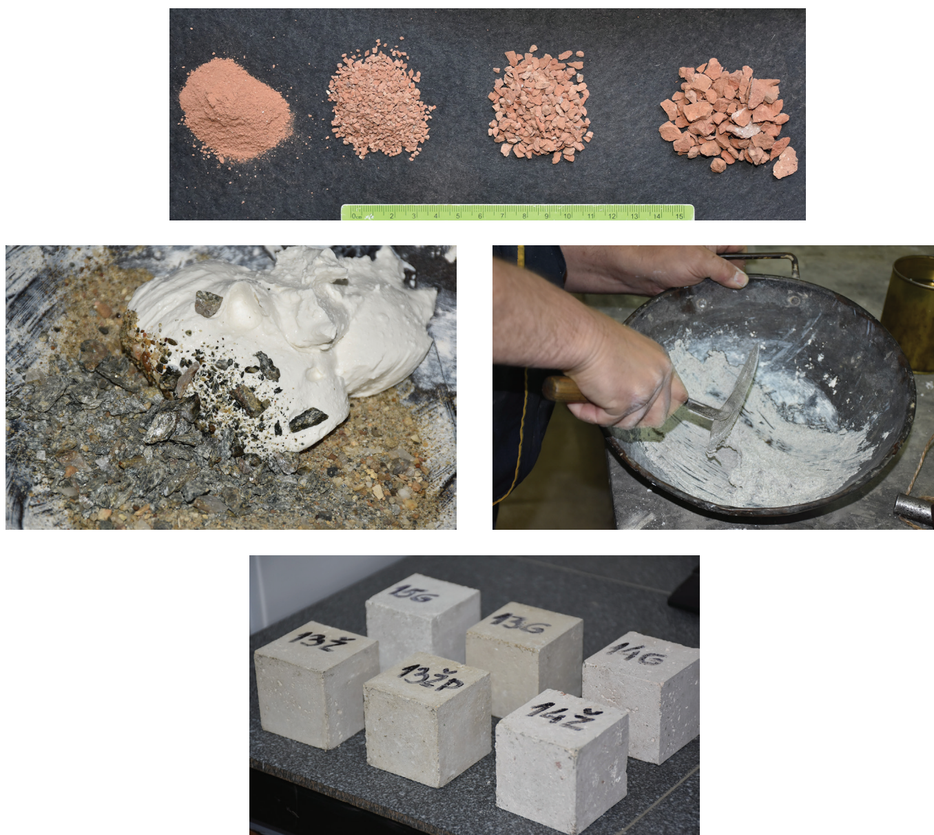
Сл. 5 Сировине и израда модела конзерваторских малтера у лабораторијама пројекта

гија израде историјских малтера, поштујући принципе компатибилности.