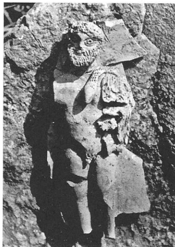
Fig. 6 Fragment of a ceramic vessel, Ravna.