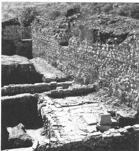
Сл. 5. Равна, светилиште („грађевина II“).

Fig. 5 Ravna, sanctuary – “Structure II”.