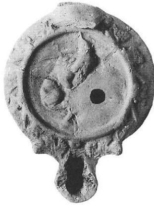
Сл. 1. Лампа из Равне.

насељем Camps (Кондић 1971, 57), на десној обали Дунава, у слоју обрушене земље регистрована је лампа од светлоцрвено печене глине, делимично оштећена (Сл. 1, 2). 2 Реч је о лампи кружног реципијента и широког равног диска са малим отвором ван средишта. На рамену у рељефу налазе се вегетабилни мотиви - листови хрста, међусобно одвојени косим линијама. Диск је прстенасто наглашен, са рељефном фигуралном сценом, на којој су приказани у међусобној борби мушкарац и лав. Мушкарац је наг, у стојећем ставу на лево, леђима окренут посматрачу, са левом искораченом ногом према животињи коју је обухватио левом руком у пределу врата. Лав је представљен полузгрчен, са главом у висини груди мушкарца, док су му полусавијене задње ноге на коленима особе са којом се бори. Дугачак, благо подвинути реп додирује тло.