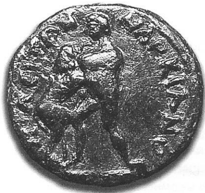
Сл. 4. Новац С. Севера, кован у Маркијанополису.