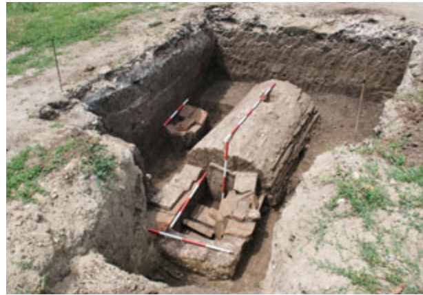
Fig. 58. Jagodin Mala, necropolis – barrel-vaulted tomb in the Vojvode Mišića Boulevard, research campaign 2010