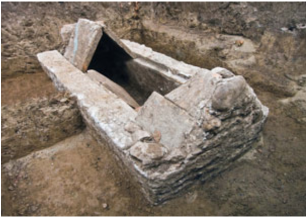
Fig. 57. Jagodin Mala, necropolis – masonry grave in the Vojvode Mišića Boulevard