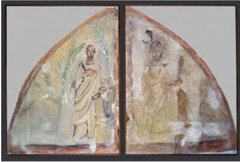
Fig. 62. Jagodin Mala, necropolis – tomb with portrayals of St. Peter and St. Paul, eastern wall