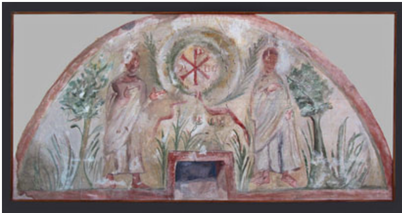
Fig. 63. Jagodin Mala, necropolis – tomb with portrayals of St. Peter and St. Paul, western wall