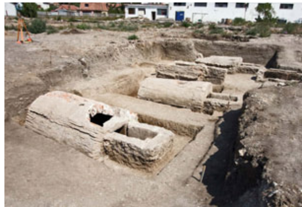
Fig. 59. Jagodin Mala, necropolis – location “Benetton”, barrel-vaulted tombs, research campaign 2012

an illustration of Christ’s monogram in a wreath (fig. 77). 21 Thanks to the construction works in Vojvode Mišića Boulevard (in the section near Pan-telejska Street), more extensive protective-systematic exploration of the southeastern part of this necropolis took place in 2009–2010. 22 The researched units included two barrel-vaulted tombs, numerous masonry graves, graves with bricks or tegulae , and many graves of deceased persons, interred with or without coffins, directly in the ground (fig. 57–58). The most recent archaeological activities, in 2012, in the same part of the necropolis, on the site of the newly designed hall in the Benetton complex, resulted in the research or identification of 75 burial units, including 16 tombs and 21 masonry graves (fig. 59).