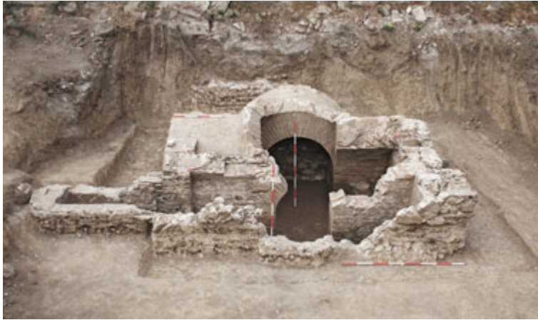
Fig. 65. Jagodin Mala, necropolis – location “Beneton”, tomb with calotte G–70, research campaign 2012