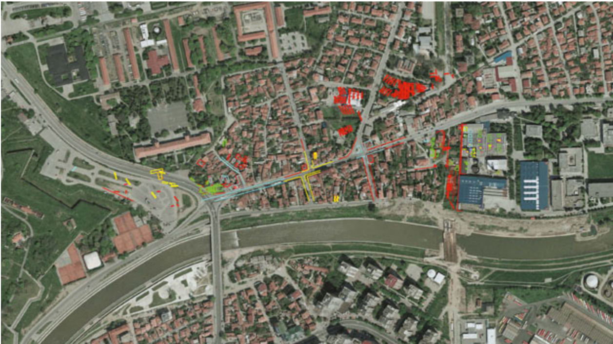
Fig. 56. Jagodin Mala, necropolis – situational plan

important Christian centre. From the sources we know the names of six bishops from AD 343–414 and 516–553, and they also record that, Athanasius of Alexandria visited the city during Easter in AD 344, which suggests the existence of a significant Christian community. 6