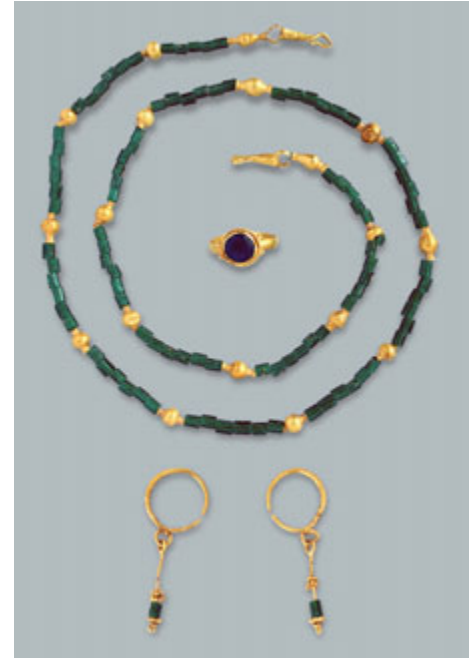
Fig. 66. Jagodin Mala, necropolis – location “Beneton”, jewellery from the tomb G–34, research campaign 2012

tioned tombs. So far, research and random discoveries have made it possible to record six tombs, the lids of which were shaped like single or double domes. They are mostly grouped in the eastern part of the necropolis, near the English Hall and the Niteks factory. One tomb with a single dome and one with a double dome were found in the Hall courtyard. 56 The deceased in these tombs were buried in vaulted arcosolia, separated by partition walls from the central chamber. The entrance to the double-dome tomb was on the western side, with a brick stairway. The base of this tomb consisted of two square spaces, with a total of five arcosolia, coated with marble panelling. After the funerals, the alcoves were walled up. The domes are different in structure – the western one was made of concentric layers of bricks with pendentives in the corner sections, while the eastern calotte has four diagonal slice-shaped parts that converge at a single point, without resting on pendentives. A similar tomb was discovered in 1972 in Niška Banja, near today’s Radon Hotel. 57