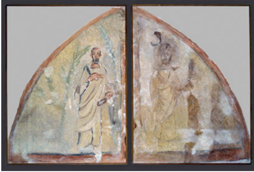
сл. 62. Јагодин Мала, некропола – гробница са представама Св. Петра и Павла, источни зид