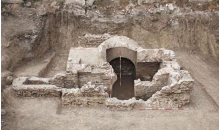
сл. 65. Јагодин Мала, некропола – локација „Бенетон“, гробница са калотом Г-70, истраживања 2012. године