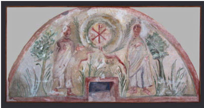
сл. 63. Јагодин Мала, некропола – гробница са представама Св. Петра и Павла, западни зид