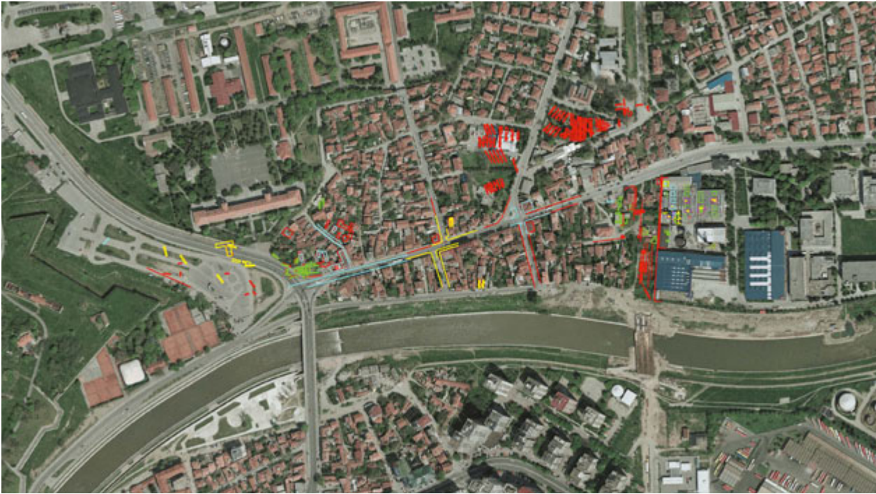
сл. 56. Јагодин Мала, некропола – ситуациони план

рице епископа из 343–414. и 516–553. године. Забележено је да је у граду током Ускрса 344. боравио Атанасије Александријски, што указује на постојање значајне заједнице хришћана. 6