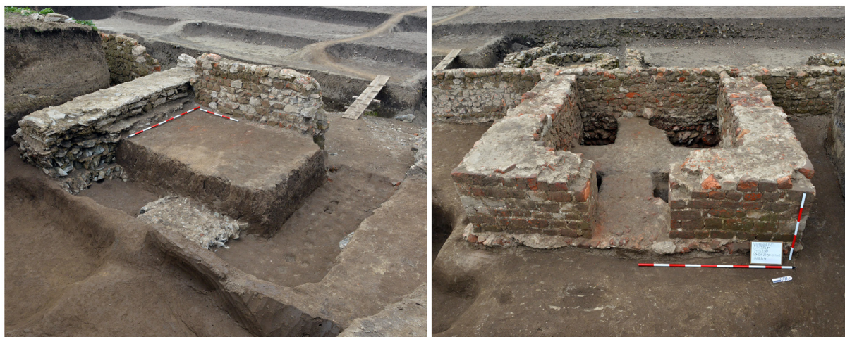
Slika 8 – Kule na zapadnom bedemu, snimci sa istoka