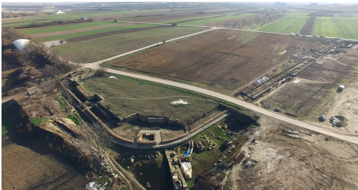
Slika 1 – Severozapadni deo logora, snimak iz vazduha