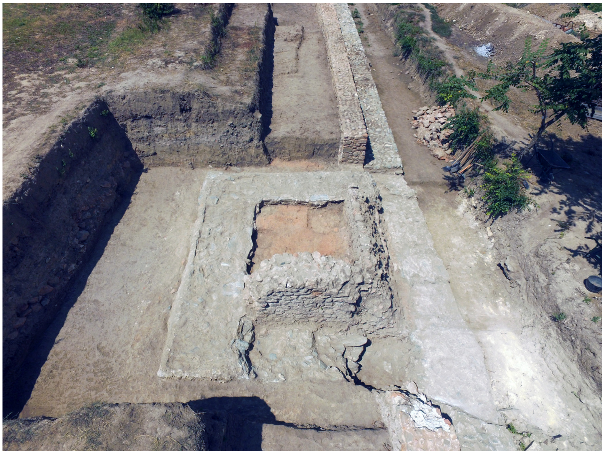
Slika 2 – Kule na severnom bedemu, snimak sa istoka

Na istraženom delu severnog bedema, na 32 m istočno od severozapadne ugaone kule, otkriveni su ostaci dve četvorougaoe kule iz različitih faza (sl. 2). Starija kula, zidana od crvenke, delom je devastirana izgradnjom mlađe, te njen gabarit nije moguće odrediti. Sačuvani su samo severni i istočni zidovi kule, u dužini od 3,45 m, odnosno 3,30 m; njihova širina je 0,75 do 0,80 m, a sačuvana visina u nadzemnom delu iznosi 1,20 do 1,40 m. Unutar kule je podnica od usitnjene