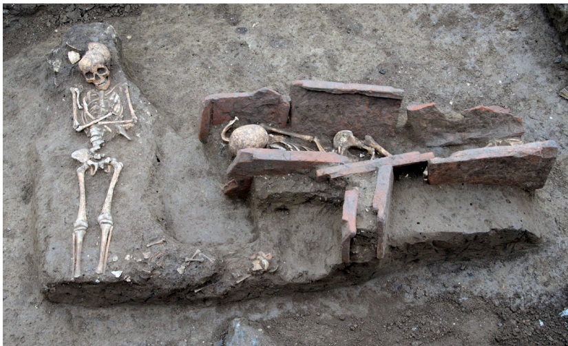
Slika 10 – Grobovi uz zapadni bedem

Najstariji kulturni horizont je datovan u doba Flavijevaca, a zastupljen je oko bedema i kula starije faze utvrđenja, kao i oko kanala uz severni bedem. U ovim slojevima nailazi se na novac i ulomke keramičkih