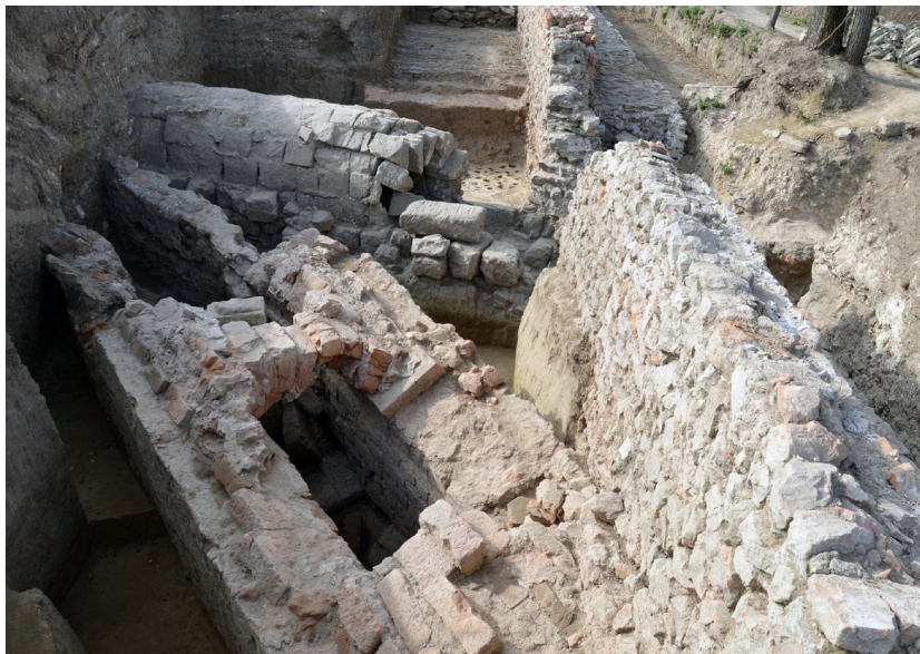
Slika 3 – Kanali, snimak sa istoka

Na oko 50 m istočno od ugaone kule otkrivena su dva kanala, u padu od jugozapada prema severoistoku (sl. 3). Kanali pripadaju različitim fazama izgradnje logora. Stariji kanal, zidan od crvenke, orijentisan je jugozapad-severoistok i istražen je u dužini od oko 11 m. Od južnog profila iskopa (kanal zalazi u profil) pruža se ka severoistoku i na dužini od oko 7 m zalazi pod bedem od crvenke, nakon čega je, dalje ka severu, negiran izgradnjom mlađeg bedema. Severno od mlađeg bedema