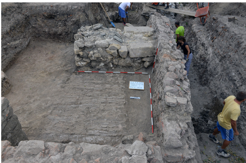
Slika 5 – Zid od krečnjaka i škriljca, snimak sa istoka