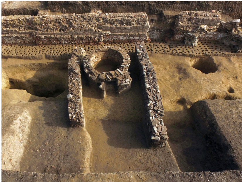
Slika 9 – Kružna peć, snimak sa zapada

Peć je kružnog oblika, prečnika 2,80 m. Zid peći, širine 0,40–0,45 m, očuvane visine do 0,45 m, građen je od ulomaka opeka. Pod je popločan celim opekama, koje su postavljene na supstrukciju od usitnjenog krečnog maltera, debljine 0,15 m. Peć je sa severne i južne strane omeđena zidovima, građeni tehnikom suhozida od horizontalno ređanih ulomaka opeka i kamena. Njihova približna orijentacija je zapad-istok i pružaju se do mlađeg bedema. Očuvana dužina zidova iznosi 5,60 m, odnosno 6,85 m, širina između 0,60 i 0,70 m, a visina do 0,70 m.