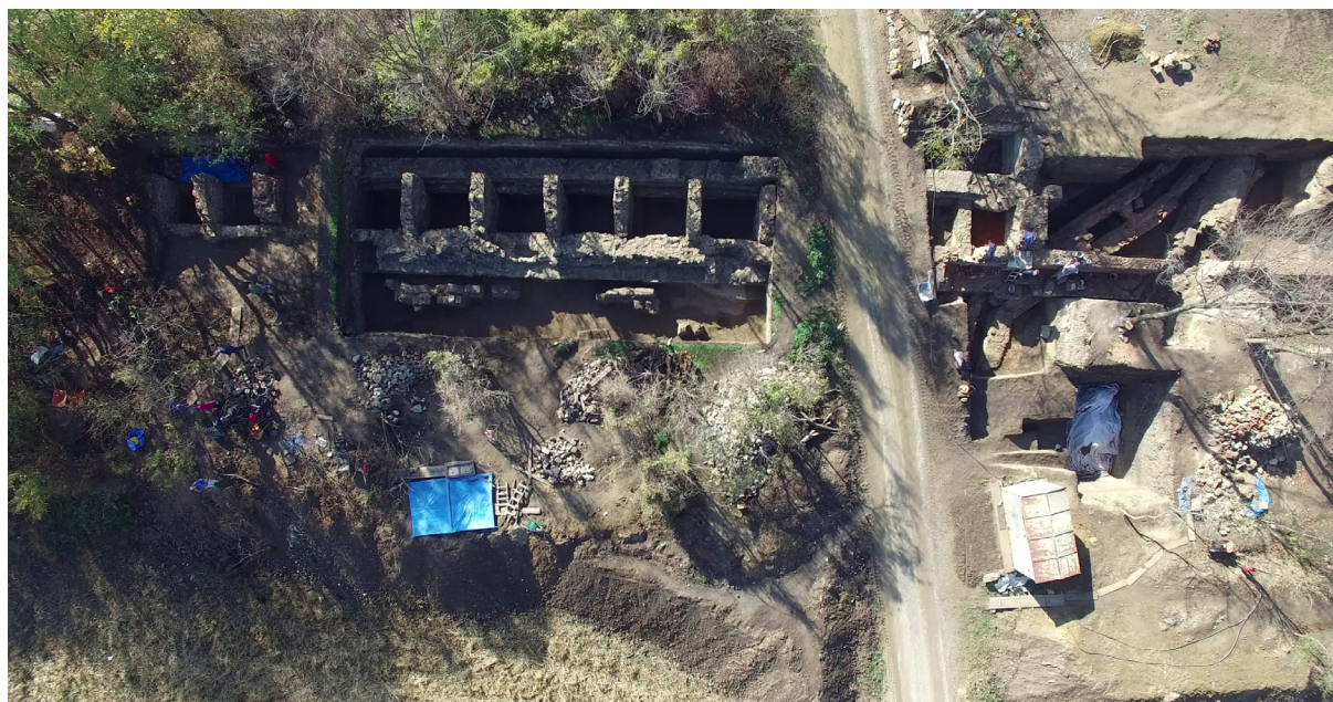
Slika 6 – Objekat i zidovi uz severni bedem, snimak iz vazduha

Istočno od kanala od crvenke, sa unutrašnje strane starijeg bedema otkriveno je 12 zidova koji se prostiru upravno na bedem (sl. 6). Zidovi su paralelni a nalaze se na međusobnoj udaljenosti od 1,90 do 2,70 m. Njihova dužina iznosi od 2,30 do 3,15 m, a na osnovu građevinskog materijala i tehnika građenja razlikuju se zidovi podignuti od komada crvenke i oni od kamena i crvenke, pri čemu je u oba slučaja kao vezivo korišćen krečni malter. Uočava se da su zidovi od crvenke masivniji i njihova širina iznosi 1,10 do 1,20 m, dok širina zidova koji su uglavom rađeni od kamena dostiže 0,60–0,65 m. Na osnovu navedenih arhitektonskih karakteristika izdvajaju se