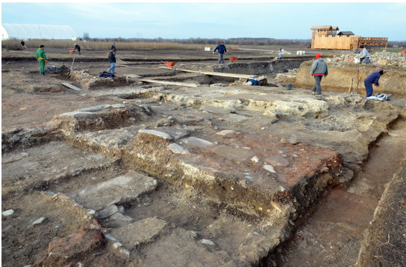
Slika 7 – Zapadna kapija logora, snimak sa jugoistoka

Južno od zapadne kapije, istražene su dve unutrašnje kule, koje pripadaju različitim graditeljskim fazama. Za razliku od kula na severnom bedemu, gde je mlađa delom podignuta na mestu starije, u ovom slučaju mlađa kula (sl. 8) je podignuta na 3,20 m južno od starije. Starija kula, građena od crvenke vezane malterom, nalazi se 43,50 m od zapadne kapije logora. Njene