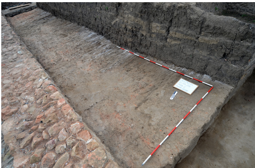
Slika 4 – Ostaci nasipa uz bedem, snimak sa severozapada

Na prostoru između četvorougone kule i kanala od crvenke, nizovi dasaka su na dva mesta bili presečeni četvorouganim „zidovima“ postavljenim upravno na bedem, na međusobnom rastojanju od 13 m (sl. 5). „Zidovi“ su građeni od blokova i krupno lomljenog krečnjaka, kao i lomljenog škriljca, a njihove dimenzije iznose 2,05–2,20 m x 1,40–1,50 m. Na sadašnjem stepenu istraženosti, nije jasno da li se radi o zidovima ili ojačanjima bedema.