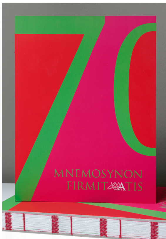
Slika 1 – Mnemosynon firmitatis: sedamdeset godina Arheološkog instituta (1947-2017)

Taj trud nas je osnažio u uverenju da je značajno da sabiramo i prezentujemo rezultate koje ostvarimo u toku svake godine. Stoga je ova, sedma po redu sveska zbornika Arheologija u Srbiji , koja se uz poslovično zakašnjenje odnosi upravo na 2017. godinu, uz uobičajene izveštaje sa iskopavanja i rekognosciranja i prikaz stručnog i naučnog rada na određenim problemima opremljena i opširnim uvodnim izveštajima o radu na četiri matična projekta Arheološkog instituta. Uz ostalo, ti izveštaji, sačinjeni po ugledu na godišnjake velikih evropskih instituta, sadrže i kompletnu bibliografiju učesnika na projektima i ažurne podatke o kongresima, konferencijama i radionicama na kojima su izlagali.