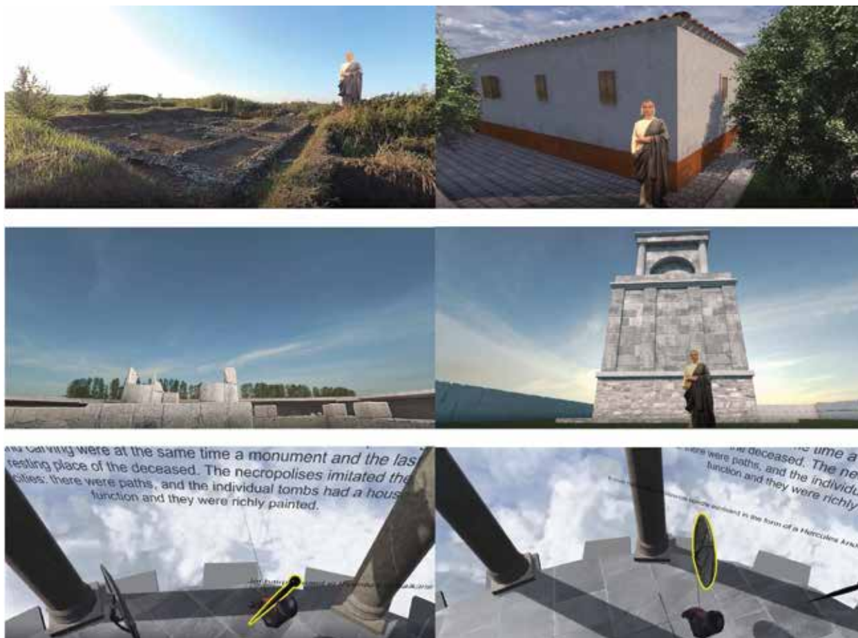
Slika 2. Snimci iz aplikacije projekta vezani za Viminacijum: vila na lokalitetu Rit (gore); Mauzolej na lokalitetu Pirivoj (sredina); artefakti (dole).

između ostalog obogatila tehničku dokumentaciju Viminacijuma budući da su izrađeni 3D modeli artefakata. Međutim, treba napomenuti da značajan rezultat projekta predstavlja uspostavljanje međusobne saradnje institucija četiri države zapadnog Balkana, što je dovelo i do izrade prijave za novi poziv Western Balkans Fund-a krajem 2019. godine, a zatim i finansiranja nastavka projekta. Tokom 2020. godine, nova četiri rimska lokaliteta u četiri države biće snimljena i postaće učesnici novih digitalnih priča.