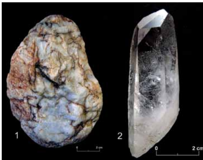
Slika 2 – 1, kvarcit (belutak); 2, kvarc (gorski kristal)

Problem nastaje u trenutku kada autori, pišući o artefaktima izrađenim od kvarcita, upotrebe termin kvarc. Pogrešna upotreba termina, odnosno ustaljeno opredeljenje kvarcita kao kvarca, onemogućava poređenje industrija okresanih artefakata sa različitim lokaliteta. Iako je ova greška veoma česta u arheološkoj literaturi, ona može lako da se prevaziđe jer je reč o stenama koje se i makroskopski lako razlikuju, što ne isključuje potrebu za konsultacijama sa geolozima/petrolozima (sl. 2; Šarić 2015: 373).