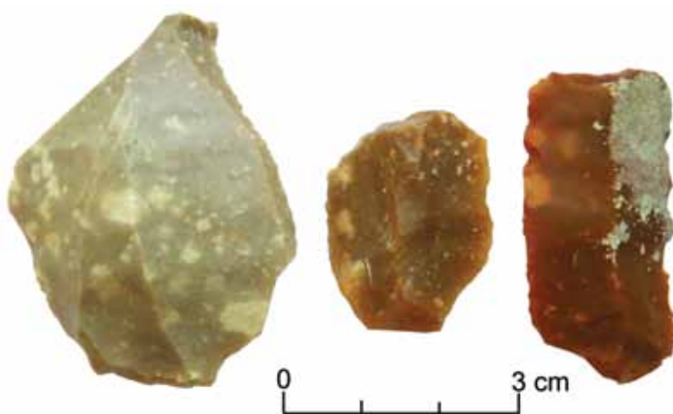
Slika 1 – „Balkanski kremen“

Drugi problem u vezi sa stenama korišćenim za izradu okresanih artefakata odnosi se na pogrešnu upotrebu određenih termina, a u slučaju koji navodimo reč je o upotrebi termina kvarc i kvarcit (Шарић 2015: 372-373). I pored upadljive leksičke i zvučne sličnosti reč je o stenama različitih fizičkih osobina koje neposredno utiču na njihovu upotrebljivost u izradi artefakata tehnikom okresivanja. Stepem zastupljenosti kvarcita i kvarca u industrijama okresanog kamena praistorijskih kultura nije isti. Analizom zbirke okresanih artefakata sa 20 nalazišta sa teritorije Srbije, koja pripadaju periodu starijeg i srednjeg neolita, uočeno je da se na pet lokaliteta javljaju