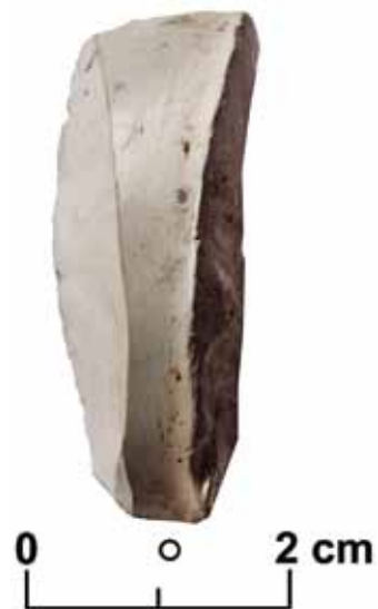
Slika 3 – Laka/meka bela stena