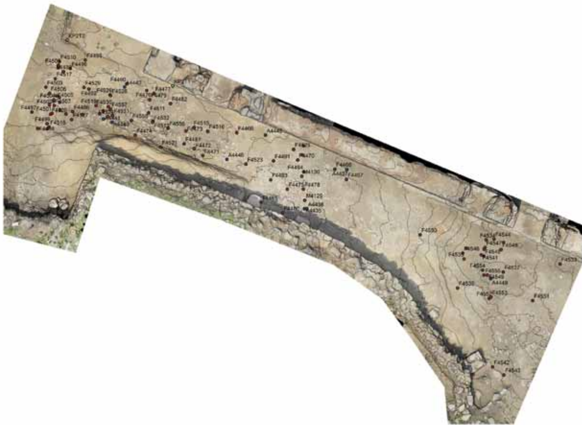
Slika 5 – Koridor 4, fotogrametrijski plan u ortogonalnoj projekciji sa interpoliranim izohipsama i distribucijom nalaza

terena, bio nešto dublji (sl. 4). U ovom sloju je bilo pokretnih nalaza i dosta životinjskih kostiju (sl. 5). Tokom iskopavanja nije uočeno da je bio naročito tvrd, pa se verovatno ne bi moglo govoriti o naboju podnice, već o sukcesivno formiranom kulturnom sloju nad kaldrmom. Nad ovim slojem nasuta je nivelacija šuta, pre svega srednjeg i krupnog kamena, u kojoj je takođe bilo dosta životinjskih kostiju. Nivelacija je konstatovana u zapadnom delu istražene površine, uz zidove vestibila horeuma i severni zid objekta 22. Posebno je bila intenzivna u predelu južnog ulaza u vestibil horeuma, u nivou osnove sloja treće faze korišćenja te zgrade. S druge strane, u istočnom delu istraženog koridora uočen je sloj rastresite sive zemlje s nesrazmerno malo nalaza keramike u odnosu na životinjske kosti. Ovaj sloj, koji je dosta tanak, predstavljao bi najmlađu fazu korišćenja ulice. Nad tim osnovama nalazio se žutomrki sloj sa manjim i većim fragmentima crepa, uz poneki fragment opeke i kamena manjih dimenzija. Taj sloj je deo rušenja krova, tj. iste situacije kao i sloj crepa od kojeg je i započelo ovogodišnje istraživanje. Ovi slojevi, dakle, ne predstavljaju faze korišćenja ulice, već donje kote rušenja objekata koji je okružuju. Gornje kote tih rušenja skinute su tokom prethodnih kampanja.