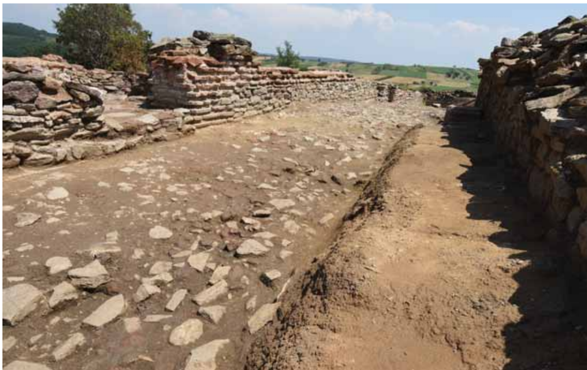
Slika 4 – Istočni deo koridora 4 u zoni južnog ulaza u vestibil, snimak sa zapada

Osnovu koridora 4 čini kaldrma od sitnih ulomaka kamena i crepa, koja je postavljena direktno na zaravljenoj steni ili glinovitoj zdravici. Iznad kaldrme je konstatovan tanak kulturni sloj, debljine svega nekoliko centimetara osim u zoni južnog ulaza u horem gde je, zbog nivoa