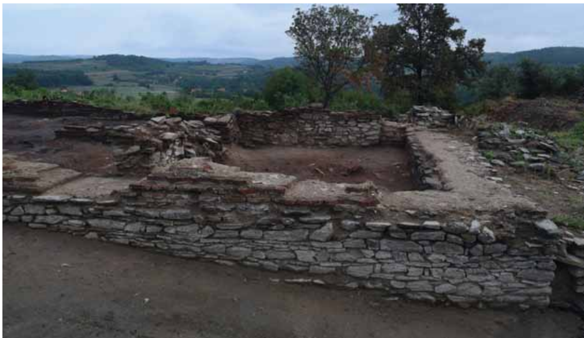
Slika 3 – Pozni objekat u jugoistočnom uglu građevine 20 – horeuma, snimak sa juga

Prilikom skidanja slojeva rušenja otkriveni su tragovi dve konstrukcije – jedne od lakih materijala u severozapadnom uglu horeuma i druge u vidu tankih zidova od kamena i opeke u njegovom jugoistočnom uglu. Važno je istaći da su obe konstrukcije bile podignute na sloju rušenja horeuma, što predstavlja važan podatak o kasnijem korišćenju ovog prostora u sasvim drugačije, privatne svrhe. Konstrukcija u severozapadnom uglu objekta 20 definisana je zapadnim i severnim zidom horeuma i novopodignutim suhozidom sa južne strane. Sa istočne strane objekat je verovatno bio zatvoren drvenom pregradom. Na postojanje drvene konstrukcije mogli