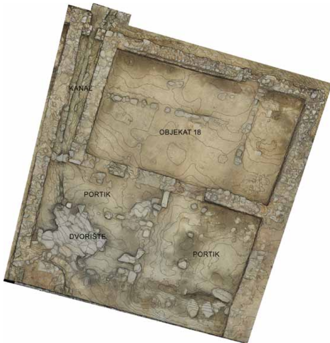
Slika 2 – Objekat 18 nakon istraživanja, fotogrametrijski plan u ortogonalnoj projekciji sa interpoliranim izohipsama

Tokom 2016. godine nastavljeno je istraživanje objekta 20 - horeuma, dimenzija 28,8 m x 12,5 m, koji se sastoji iz dva dela, vestibula na zapadnoj strani i dvobrodne centralne prostorije podeljene nizom od četiri zidana stupca. Prethodnih godina skinut je humus nad ostacima gra-