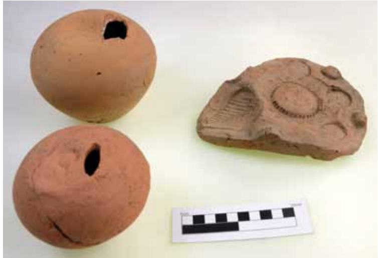
Slika 7 – Keramičke kasice i kalup za žižak

no (severozapad-jugoistok). Nizovi se nalaze na međusobnoj udaljenosti od 3,50 m, odnosno 2,40 m. Stupci su pravougaone osnove, dimenzija 1,40 x 0,80 m. Donji deo temeljne zone čine komadi opeka i škrljca, između kojih je pesak, dok je gornji deo od ulomaka opeka i škrljca vezanih malterom. Nadzemni deo stubaca je bio građen od redova horizontalno postavljenih opeka vezanih malterom, očuvanih u visini do 0,60 m. Između stubaca se nailazilo na površine kružnog ili četvorougaoanog oblika, oivičene opekama, unutar kojih su uočeni tragovi gorenja – garež, pepeo i crvena zapečena zemlja, za koje možemo pretpostaviti da su ostaci vatrišta. Objekat je najverovatnije bio izgrađen u prvoj polovini 3. veka. U okviru istočnog niza, prostor između stubaca je u kasnijoj fazi bio ispunjen zemljom i ulomcima opeka. Ispuna je sa gornje strane zalivena krečnim malterom, da bi preko ove nivelacije i stubaca bio podignut zid od opeka i maltera. Zapadna strana objekta zalazi u profil, pa se ne može definisati njegov konačan izgled. Samim tim ne mogu se naći odgovarajuće paralele, niti odrediti namena ovog objekta.