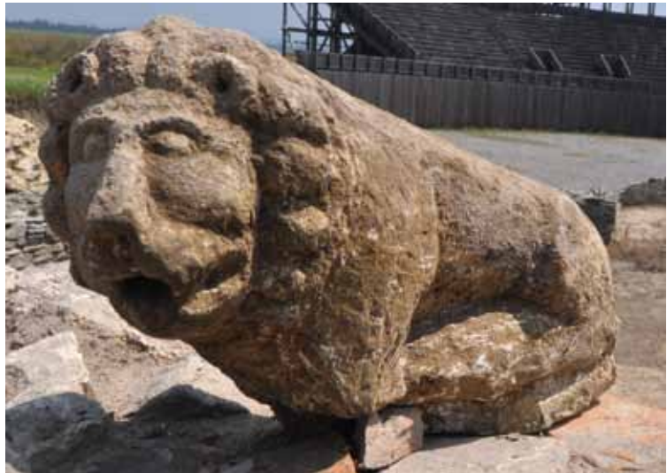
Slika 8 – Statua lava

Ispod temeljne zone objekta sa stupcima istražen je deo objekta građenog od lomljene crvenke vezane glinom (sl. 6). Njegov istočni zid se pruža ispod zapadne ivice središnjeg niza stubaca, pravcem jugozapad-severoistok, južnom stranom zalazi u profil, dok na severnom kraju pod pravim uglom skreće ka zapadnom profilu. Sačuvana je samo temeljna zona zida, ispraćena u dužini od 8,10 m, širine oko 0,60 m. Objekat je ukopan u sloj zdravice i pripada najstarijem kulturnom horizontu, datovanom u treću četvrtinu 1. veka.