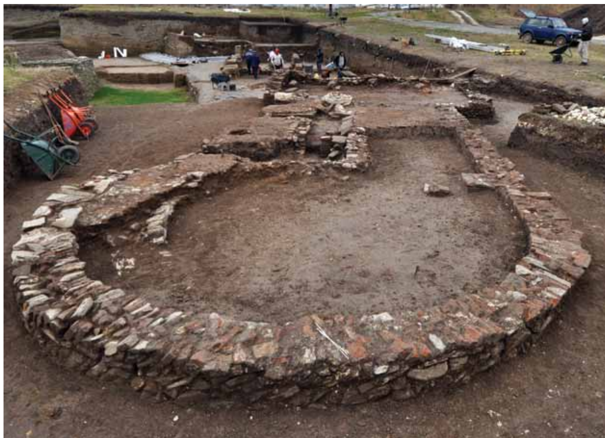
Slika 5 – Objekat sa apsidom, pogled sa severa

Severozapadno od amfiteatra, u kvadratima A–B/3-4, na prostoru gde je geofizičkim snimanjima detektovano postojanje arhitekture, otkriven je objekat od kamena i opeke, orijentisan pravcem severoistok-jugozapad (sl. 5). Njegova dužina iznosi 16 m, a širina do 7,35 m. Objekat