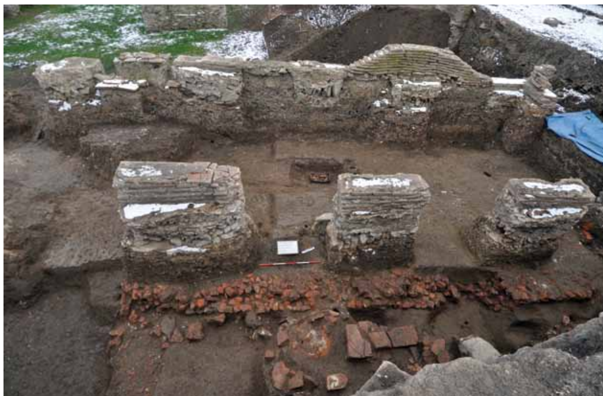
Slika 6 – Objekat sa stupcima i objekat sa crvenkom

Zapadno od amfiteatra i južno od objekta sa apsidom, na prostoru kvadrata A/5-7, otkriveni su ostaci još jednog objekta, formiranog od 17 stubaca (sl. 6). Dimenzije istraženog dela objekta su 15 m x 9,60 m, a njegova pretpostavljena orijentacija je jugozapad – severoistok. Stupci su raspoređeni u tri paralelna niza, uz ogradne na severnoj i južnoj strani, koji su postavljeni uprav-