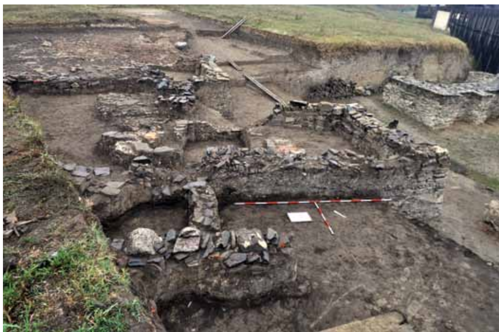
Slika 3 – Objekat od suhozida, zapadno od ulaza

Objekti građeni u tehnici suhozida otkriveni su zapadno i jugozapadno od amfiteatra, neposredno ispod površinskih slojeva. Njihovi zidovi su bili građeni od ramskog škrljca, opeka i krečnjaka i nisu bili vezani malterom. Kao građevinski materijal sekundarno su korišćeni i de-