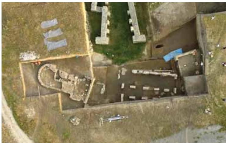
Slika 2 – Istraženi prostor, snimak iz vazduha

se očekivao prilaz ulazu u objekat. Istraživan je i prostor severozapadno od ulaza u amfiteatar, gde je geofizičkim snimanjima detektovano više različitih objekata, među kojima i jedan sa apsidom. Iskop zapadno od amfiteatra je obuhvatio prostor od približno 700 m 2 . U potpunosti ili delimično je istraženo deset kvadrata (kvadrati A–B/3-7) (sl. 1). Otkriveno je nekoliko objekata (sl. 2) koji pripadaju različitim periodima i izdvojeno je više kulturnih horizonata.