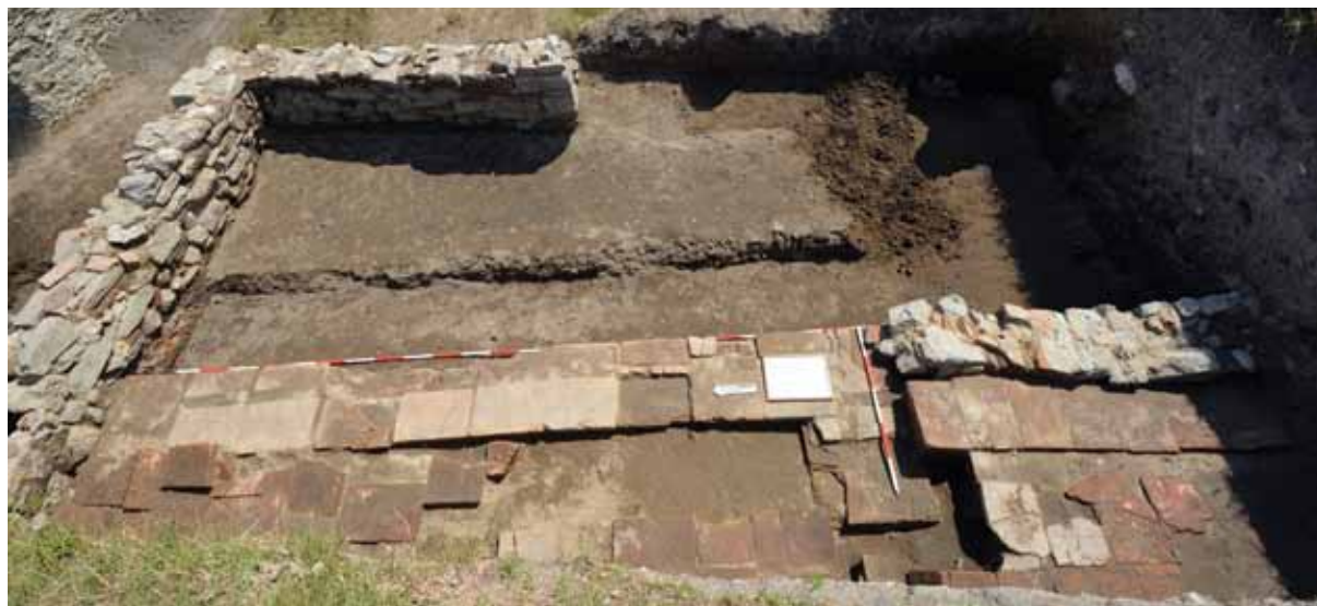
Slika 4 – Objekat od suhozida, jugozapadno od amfiteatra

Zapadno od ulaza u amfiteatar, u kvadratima A/4-6, otkriveno je nekoliko suhozida različitih dimenzija, koji najverovatnije čine deo iste celine (sl. 3). Zidovi u jugozapadnom delu te površine povezani su u oblik ćiriličnog slova П i obuhvataju prostor približnih dimenzija 2,50 x 4,70 m. Očuvani su u visini do 0,90 m, a širine su do 0,50 m. Severno od pomenutih su manji zidovi koji formiraju prav ugao. Njihova očuvana dužina iznosi 3,10 m i 1,20 m, širina do 0,65 m, a visina do 0,90 m. Između zidova, u nivou njihove temeljne zone, javljaju se površine od celih ili krupnijih ulomaka horizontalno položenih opeka, koje većim delom leže na malternim površinama; najverovatnije se radi o nivou poda. Istraženi suhozidi predstavljaju delove istog objekta, čiji zapadni delovi zalaze u profile kvadrata, zbog čega gabarit i izgled objekta ne mogu biti precizno određeni. Na osnovu stratigrafije i malobrojnih pokretnih nalaza, uglavnom numizmatičkih, objekat je datovan u kraj 4. i početak 5. veka. On ujedno predstavlja i najmlađu celinu na do sada istraženom prostoru amfiteatra.