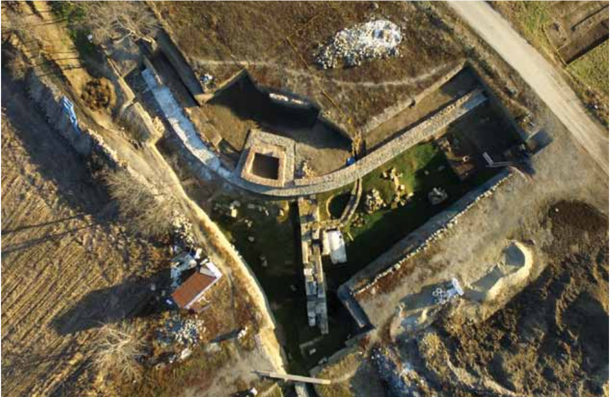
Slika 1 – Istražen prostor na lokalitetu Čair, snimak iz vazduha