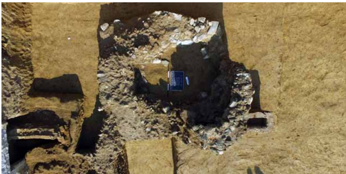
Slika 2 – Objekat 1, snimak odozgo

ma upućuje na zaključak da se radi o sahrani istaknutog člana zajednice (Golubović et al. 2009: 55). Veći deo nekropole na Pirivoju datovan je u period 2. i 3. veka, dok se sahranjivanje u zapadnom delu groblja vršilo u kasnoantičkom periodu (Redžić 2007: 79). Nekropola je formirana uz put koji je od istočne kapije kastruma vodio ka Pinkumu (Veliko Gradište), i koji je na lokalitetu Pirivoj arheološki potvrđen na tri mesta (Danković 2015). Pored celina sepulkralnog karaktera na lokalitetu je otkrivena i jedna opekarska peć. 2 Celovitije su publikovani samo rezultati istraživanja vođenih u jugozapadnom delu lokaliteta (Raičković, Milovanović 2010; Vuković 2010), dok se brojni radovi bave pojedinim grobnim celinama ili delovima njihovih grobnih inventara.