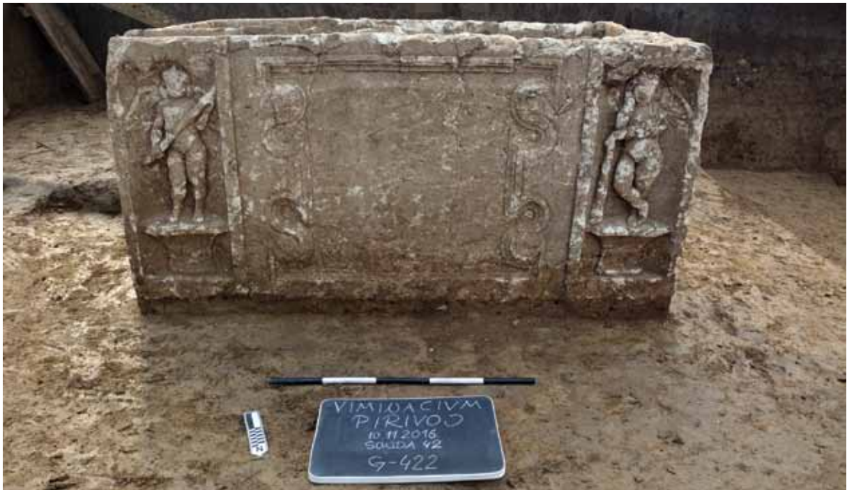
Slika 7 – Sarkofag , snimak sa severa