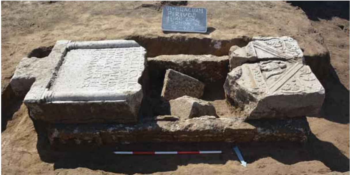
Slika 6 – Stela od kamena u funkciji poklopca sarkofaga