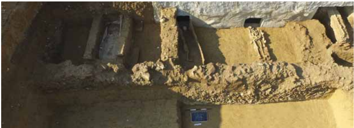
Slika 3 – Objekat 2, snimak sa istoka

Osnovu objekta 2 takođe nije moguće u potpunosti rekonstruisati budući da zalazi u zapadni i južni profil sonde. Orijeantisan je u pravcu zapad-istok, sa odstupanjem od 13^\circ ka severu. Istraženi deo objekta ima dimenzije od 10 m x 2,40 m, i sastoji se od dve prostorije (sl. 3). Prostorija I je južno od dva pomenuta odeljenja. Četvorougaone je osnove, ali njene definitivne dimenzije nisu utvrđene jer zalazi u zapadni profil. Istražena dužina iznosi 2,40 m, a širina 3,65