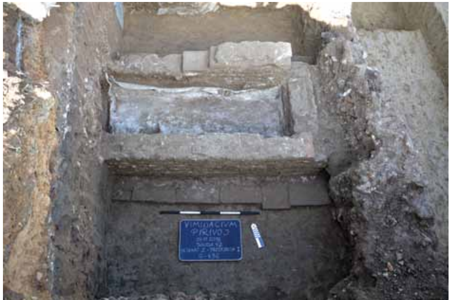
Slika 4 – Ostaci zasvedenog groba i sarkofaga od olova

U dva slučaja je donji etaž bio oziđan opekama vezanim krečnim malterom, dok su u jednom grobu opeke bile nasatično postavljene. Ostaci pokrivača, delom uništenih tokom pljačke, otkriveni su u dva slučaja, dok je nad donjim etažom jednog od grobova otkrivena konstrukcija od tegula i imbreksa u vidu krova na dve vode, koja je takođe imala funkciju pokrivača. U tri slučaja su dna grobova