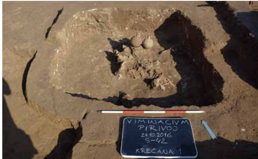
Slika 8 – Krečana, snimak sa juga

Krečana je kvadratne osnove, dimenzija 2 m x 2 m x 0,45 m. Na stranicama se uočava krečni premaz u nanosu debljine do 2 cm. Ispunu je činila tamnomrka zemlje sa komadima ramskog škrljca, krečnjaka, krečnog maltera i opeka. Krečana se verovatno može vezati za izgradnju nekog od objekata otkrivenih u neposrednoj blizini, a pri čijoj gradnji je upotrebljavan krečni malter. U centralnom delu krečane otkrivena je