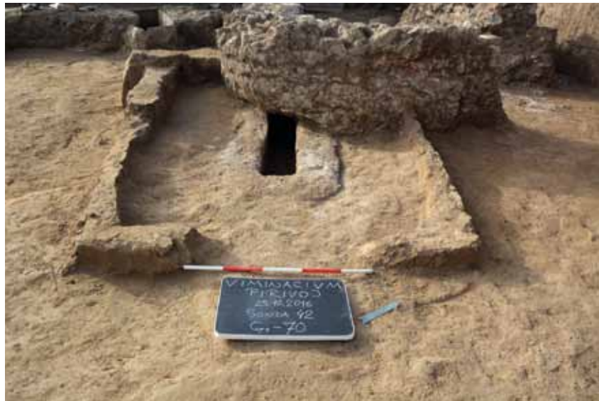
Slika 5 – Grob kremiranog pokojnika negiran objektom 1

Nad tri rake slobodno ukopanih pokojnika bilo je moguće konstatovati postojanje pokrivača od opeka. Među grobnim konstrukcijama posebno se izdvaja pomenuta zasvedena grobnica unutar koje je otkriven sarkofag od olova (sl. 4), kao i jedna konstrukcija trapezastog preseka. Otkrivena su još i tri groba zidana od opeka i krečnog maltera, devet grobova od nasatično postavljenih tegula, dva groba ozidana ulomcima opeka i komadima kamena (gde su u jednom slučaju upotrebljeni obrađeni komadi krečnjaka i peščara među kojima se nalazi i ulomak nadgrobne ploče sa natpisom) i jedan grob novorođenčeta sa konstrukcijom od imbreksa. Pet grobova sa stranicama od nasatično