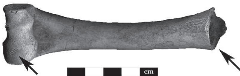
Сл. 2 Десна рамена кост овце, са траговима касапљења: проксимални зглоб је одсечен, а на дисталном зглобу је више кратких уреза

На основу облика и положаја трагова касапљења на скелетима домаћих животиња, закључено је да су за припремање хране служиле две врсте месарских алатки. Кратки и дугачки урези на дугим костима настали су од металних ножева, док одсечени делови зглобова дугих костију, пршљенова, карлица и лопатица указују на нешто масивније алатке, као што су сатаре или секире (сл. 2). Око 18% прикупљених костију је горело, од чега највећи број потиче из куле, и то највероватније у пожару који је захватио кулу приликом деструкције утврђења.