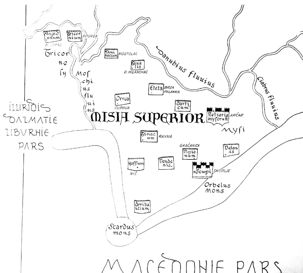
Слика 1 – Птолемејева карта Горње Мезије (према: А. Цермановић – Кузмановић, Југословенске земље на Птолемејевој карти, у: Monumenta cartographica Jugoslaviae I , ур: Реља Новаковић, Историјски институт, Посебна издања, књика 17, Београд 1975, 11-31.)