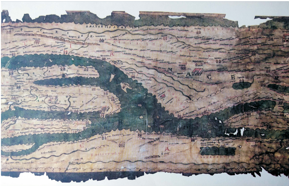
Слика 2 – Tabulla Peutingeriana (према: Г. Шкриванић, Југословенске земље на Појтингеровој табли, у: Monumenta cartographica Jugoslaviae I , ур: Реља Новаковић, Историјски институт, Посебна издања, књика 17, Београд 1975, 32-58.