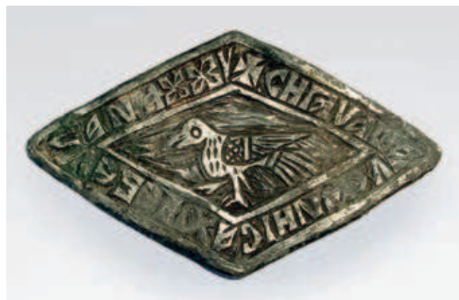
Fig. 95. Plaque from bowl of čelnik Hrebeljan

Like luxurious apparel and jewellery, a form of stressing the power and wealth of the Serbian aristocracy in medieval society was also the use of expensive dishes. Cups from the late Middle Ages which belonged to the nobility or rulers were mostly made of gilded silver and displayed outstanding craftsmanship. Certainly objects that had been specially made to order, they may have been a ruler's gift to a nobleman as a token of gratitude for loyal service. The precious ones were placed in storage and served as a pledge for survival in times of hardship. 50 An appliqué from such a cup was discovered in the narthex of the church in Velika Kruševica, in a grave that most likely belonged to the čelnik Hrebeljan. The owner of the discovered glass was engraved in the Serbo-Slavonic language: ѿ | ѿша ѿ ѿника хрѣбелана , which combined with stylised floral motifs framed the central field decorated with the motif of a bird (fig. 95). 51