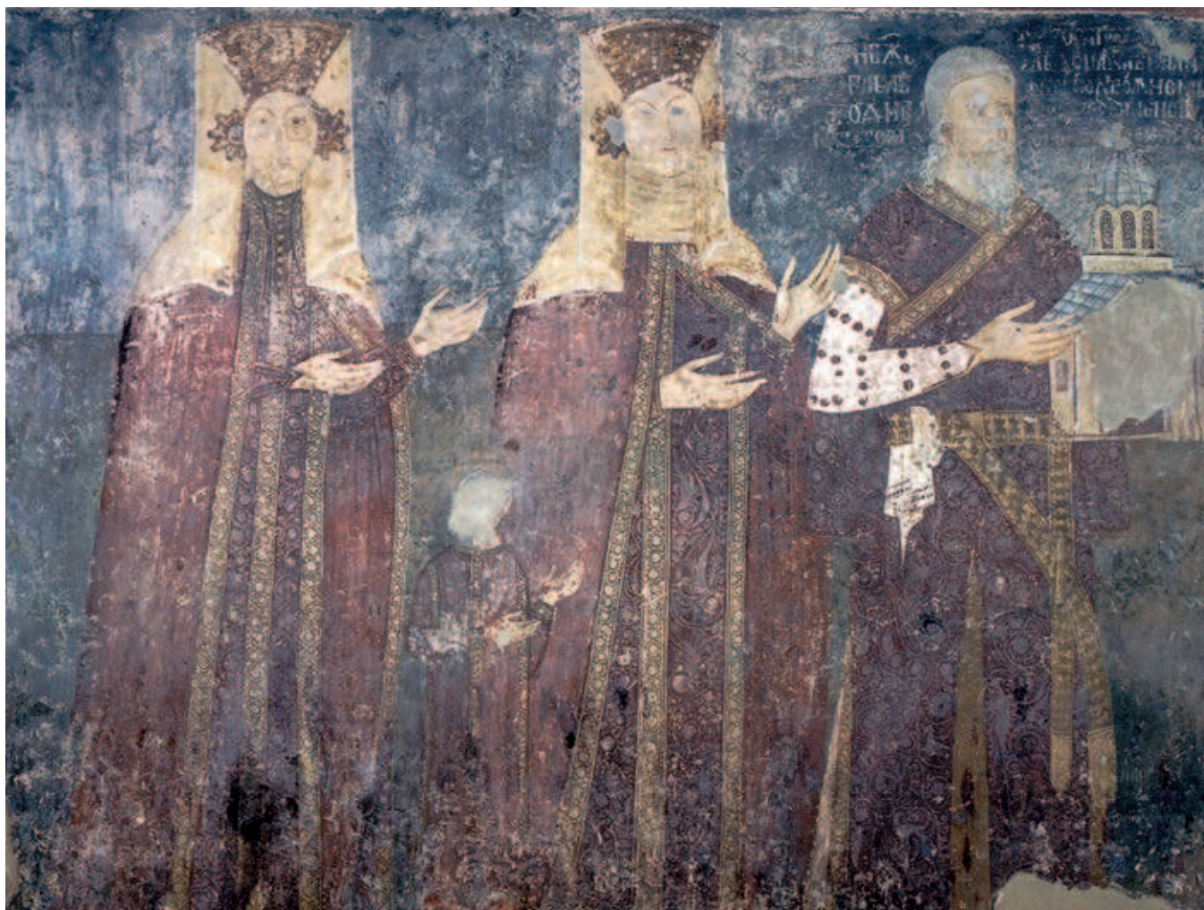
Fig. 92. Ktetorial composition from the White Church of Karan, 14 th century

rendering the remains of a luxurious dress of Italian fabric with vines embroidered on it in gold thread, discovered in St. Peter's Church near Novi Pazar in the 1960s (fig.93), 31 that much more significant. The special value of the fabric is demonstrated in the fact that it was reused for making a new dress, probably after the final collapse of the Serbian Despotate. 32 Similarly composed were the motifs on fabrics originating from Venice, which are today kept in Berlin, i.e. in St.