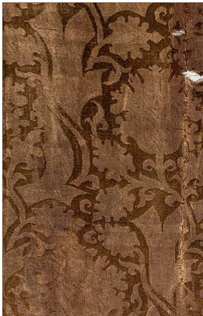
Fig. 93. Dress, detail, first half of the 15 th century, St. Peter's Church near Novi Pazar