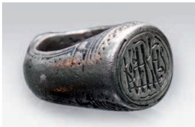
Fig. 94. Ring of nobleman Nikola Kosjer