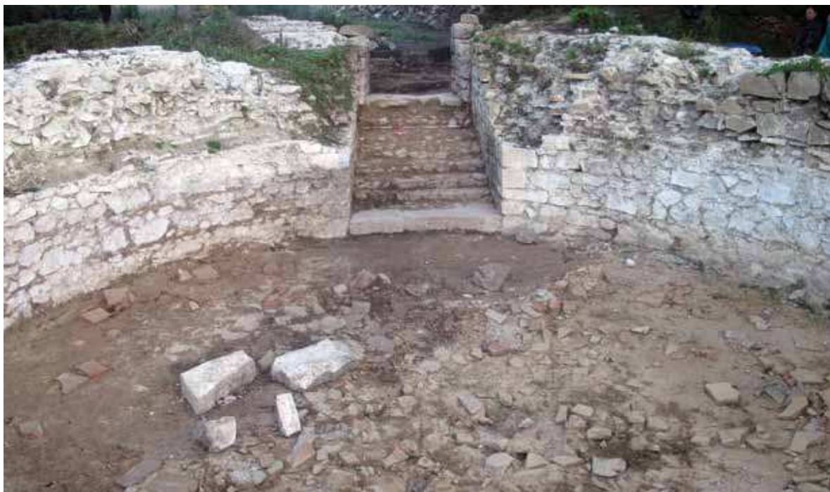
Slika 1 - Koridor ulaza u kulu 8 sa stepeništem, iz unutrašnjosti kule, sa jugoistoka

Vrelo–Šarkamen, arheološka istraživanja, prezentacija i promocija je zajednički projekat Arheološkog instituta, Muzeja Krajine Negotin i Zavoda za zaštitu spomenika kulture u Nišu, koji je započeo 2013. godine arheološkim iskopavanjima u unutrašnjosti jugoistočne kule utvrđenja palate, kule 8 (Petković, Janjić, Radinović 2014; Петковић, Јањић 2016). Kula 8 je izabrana za početak obnovljenih istraživanja jer dominira nad dolinom Vrelske reke, duž koje se pruža pristupni put ka lokalitetu, od sela Šarkamena na istoku do sela Plavne na zapadu. Takođe, ova kula se nalazi na ulazu u nalazište, gde je u etno-objektu, adaptiranom starom toru, smeštena čuvarska i vodička služba. Zato je bilo logično da se pristupi iskopavanju, konzervatorsko-resta-