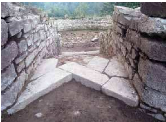
Slika 3 - Ulaz u kulu 8 iz unutrašnjosti utvrđenja, sa severozapada (S. Petković)

U kampanji arheoloških istraživanja u potpunosti je istražena unutrašnjost kružne kule 8 do prvobitnog nivoa poda ovog objekta, nivoa b (sl. 2), i ulaz u kulu iz unutrašnjosti utvrđenja (sl. 1). U tom cilju otvorena je sonda 1/14 severozapadno od ulaza u kulu, pravca sever-jug i dimenzija 10 m x 6 m, koja je tokom radova produžena za 2 m ka severu. Iskopavanjima je utvrđeno da je ulaz u kulu bio monumentalno koncipiran. Sastoji se od koridora, širokog 1,8-2,1 m i dugog 5,75 m, zasvođenog u dužini od 3,9 m, u kome se nalazilo monumentalno stepenište koje je vodilo iz unutrašnjosti utvrđenja u kulu (sl. 2). Ono se sastoji od osam stepenika od rimskog betona, napravljenog od krečnog maltera izmešanog sa sitnijim i krupnijim rečnim šljunkom i lomljenim kamenom, popločanog kvaderima belog krečnjaka poređanim u motivu „riblje kosti“, koji su očuvani na prvom i poslednjem stepeniku (sl. 3). Ukupna visina stepeništa je 1,2 m, a visina stepenika varira od 8 do 27 cm. Od belog krečnjaka su bili i dovratnici kapije na ulazu u kulu, odnosno na početku stepeništa (sl. 4). Ovako konstruisan ulaz u kulu predstavlja jedinstveno rešenje u rimskoj fortifikacionoj arhitekturi, za koje nam nisu poznate analogije.