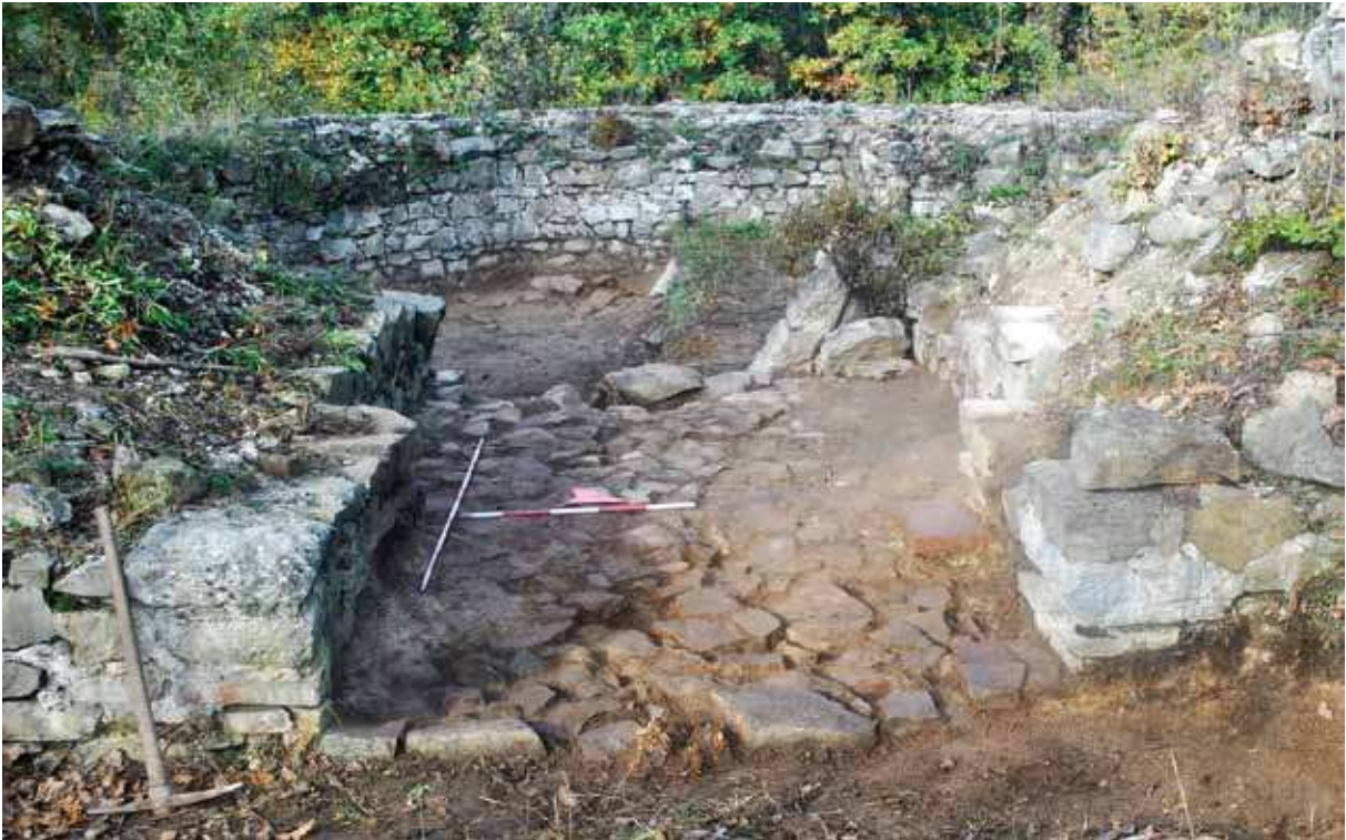
Slika 7 - Ulaz u kulu 1 i njena istražena južna polovina, sa istoka (B. Aleksić)

U površinskom sloju i sloju A, u sondi 1/14 nađeno je nekoliko atipičnih fragmenata keramike (lonci), kao i jedan ulomak amfore, koji se mogu datovati u 4-5. vek, dok je u sloju C, koji je sloj nivelacije objekata starijeg utvrđenja, vile, nije bilo pokretnih nalaza.