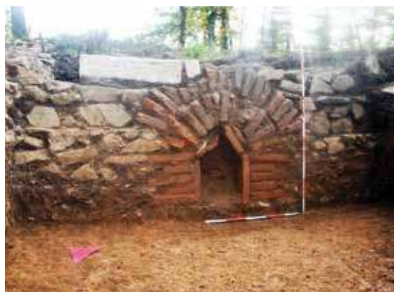
Slika 6 - Kanal od opeka sa svodom, probijen kroz južni zid starije fortifikacije, sa severa (B. Aleksić)

zana je starija kvadratna kula, zidana u tehnici opus mixtum , od kamena i tegula (sl. 5). Ona je pripadala starijem utvrđenom objektu, najverovatnije vili ( villa rustica ), koja je prethodila izgradnji utvrđene carske palate. Ta kvadratna kula, dimenzija 4,5 m x 4,5 m, uklopljena je u ulaz u mlađu jugoistočnu kulu utvrđenja palate (kulu 8). Od severozapadnog ugla kvadratne kule polaze dva zida pod pravim uglom, u pravcu zapada i severa, koji su ostaci starije istočne i južne fasade vile. Ovi zidovi su paralelni sa južnim i istočnim bedemom palate i široki su 1m u nadzemnom delu, očuvanom u 1-2 reda kamena, i 1,2 m u temeljnoj zoni. Odbrambeni zidovi vile zidani su od lomljenog kamena vezanog krečnim malterom (sl. 5). Rastojanje između istočnog zida starije vile i mlađeg istočnog bedema palate iznosi oko 4,5 m, a isti odnos je i između starijeg južnog zida i mlađeg južnog bedema.