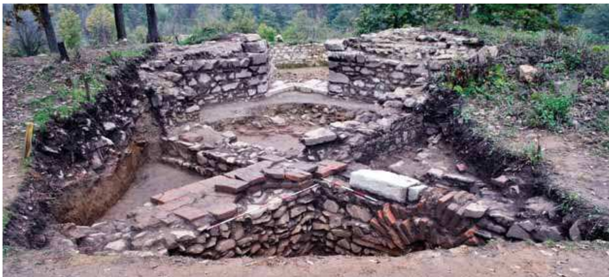
Slika 5 - Ulaz u kulu 8 i jugoistočna kvadratna kula starije fortifikacije – vile i njen jugoistočni ugao, sa severozapada (S. Petković)

zana je starija kvadratna kula, zidana u tehnici opus mixtum , od kamena i tegula (sl. 5). Ona je pripadala starijem utvrđenom objektu, najverovatnije vili ( villa rustica ), koja je prethodila izgradnji utvrđene carske palate. Ta kvadratna kula, dimenzija 4,5 m x 4,5 m, uklopljena je u ulaz u mlađu jugoistočnu kulu utvrđenja palate (kulu 8). Od severozapadnog ugla kvadratne kule polaze dva zida pod pravim uglom, u pravcu zapada i severa, koji su ostaci starije istočne i južne fasade vile. Ovi zidovi su paralelni sa južnim i istočnim bedemom palate i široki su 1m u nadzemnom delu, očuvanom u 1-2 reda kamena, i 1,2 m u temeljnoj zoni. Odbrambeni zidovi vile zidani su od lomljenog kamena vezanog krečnim malterom (sl. 5). Rastojanje između istočnog zida starije vile i mlađeg istočnog bedema palate iznosi oko 4,5 m, a isti odnos je i između starijeg južnog zida i mlađeg južnog bedema.