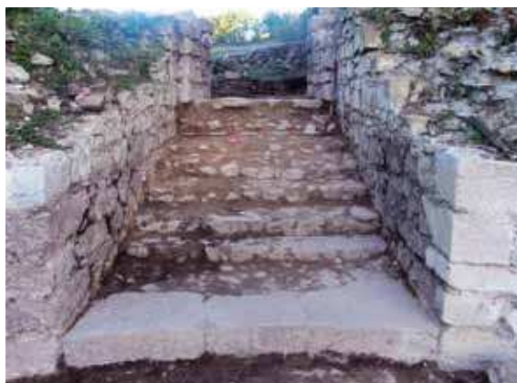
Slika 4 - Stepenište u ulazu u kulu, sa jugoistoka (S. Petković)

Delovi istočnog i južnog bedema utvrđene palate zidani su u tehnici opus mixtum , širine zidova oko 3 m, i spojeni su pod uglom od 120° sa koridorom ulaza u jugoistočnu kulu. Sa ovim delovima južnog i istočnog bedema, u unutrašnjem jugoistočnom uglu utvrđenja pove-