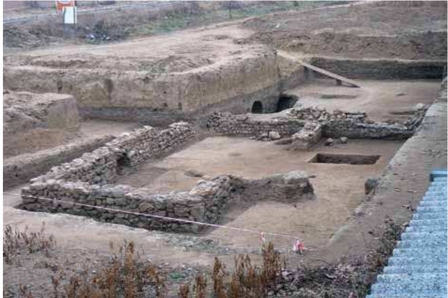
Sl. 4. Kasnoantička građevina (IV – prva polovina V veka) severoistočno od nekropole spaljenih pokojnika.

U podnožju jugozapadne strane brda na kome se nalazila kasnoantička nekropola istraženi su ostaci rimskog naselja iz II – III veka. Otkrivena su tri objekta iz tri faze gradnje. Na granici zone ekspropriacije otkrivene su dve prostorije rimskih termi