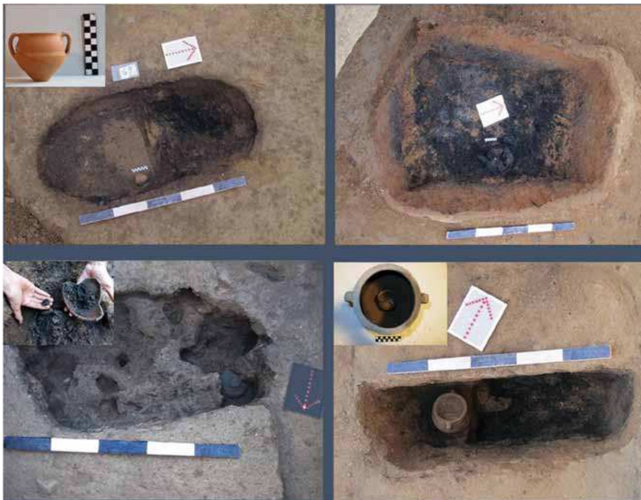
Sl. 3. Rimska nekropola spaljenih pokojnika tipa Mala Kopašnica – Sase I.

U zoni ekspropriacije, na prostoru između jugozapadnog kraja sela Davidovac (Novo naselje) i puta Vranje – Bujanovac, u četiri paralelne sonde, na površini od 500 m 2 istražen je deo rimske nekropole spaljenih pokojnika tipa Mala Kopašnica – Sase I. Iskopano je 39 grobova, datovanih u II - III vek. Ovi grobovi su uvek sadržali keramičke posude – dvouhe pehare i zdele sa hranom i pićem namenjenim pokojniku, bronzani novac, kao i lične predmete spaljene osobe – nakit, strigil, oružje, a ređe lampe od bronce ili pečene zemlje i staklene posude (sl. 3).