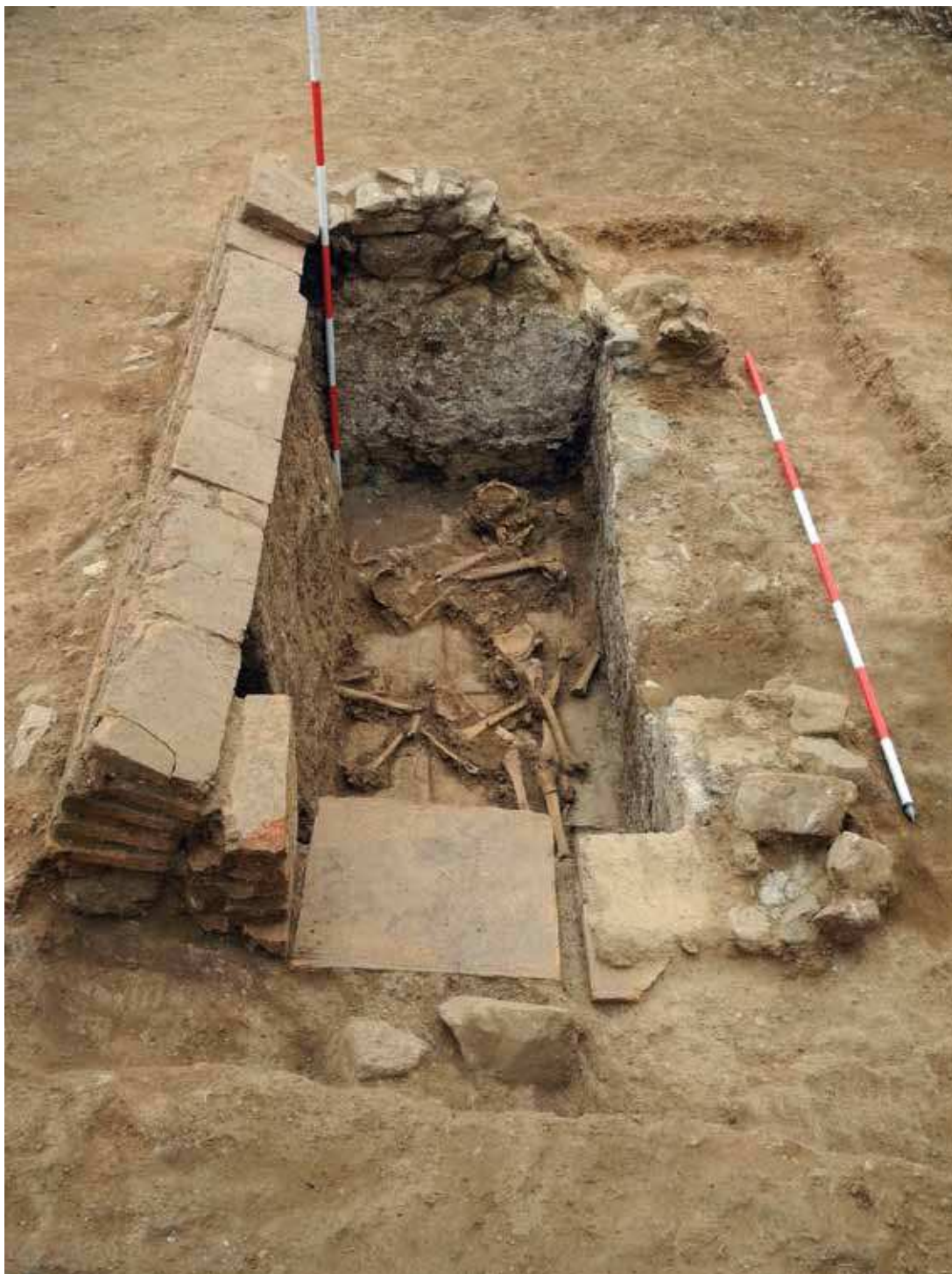
Sl. 1. Davidovac-Crkvište, Severni sektor, Grobnica I. Pogled sa severoistoka.