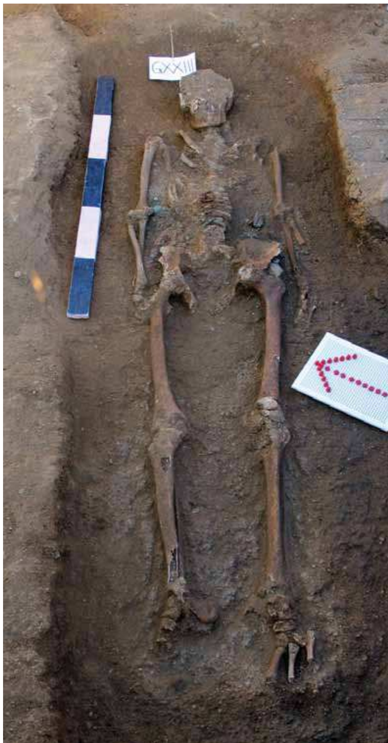
Sl. 7. Usamljeni grob ratnika iz prve polovine VII veka.