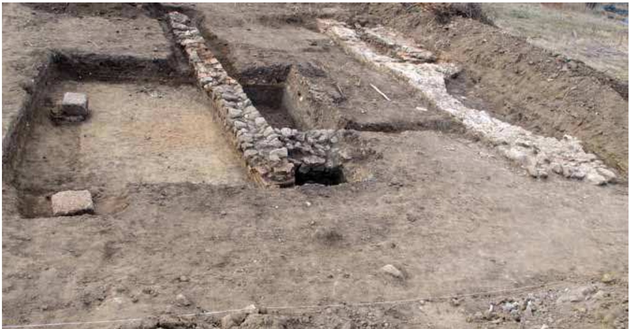
Sl. 5. Građevina iz najstarije faze rimskog naselja (II vek) na lokalitetu Davidovac – Gradište.