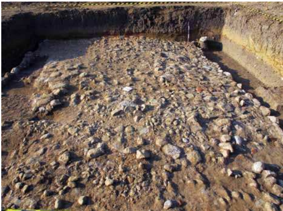
Sl. 6. Via militaris.

– frigidarijum i tepidarijum. Terme su orijentisane dužom stranom u pravcu severozapad – jugoistok, a kraćom u pravcu severoistok – jugozapad. Zidovi su očuvani u temeljnoj zoni i u nadzemnom delu do visine od oko 1m, a zidani su u tehnici opus mixtum , široki 0,65 m. Tepidarijum ima formu upisane apside, dok je frigidarijum pravougaonog oblika i od njega se u pravcu juga pruža kanal za odvod korišćene vode. Terme su verovatno nastale u drugoj polovini II ili prvoj polovini III veka. Uz jugoistočnu fasadu termi prizidana je građevina sa