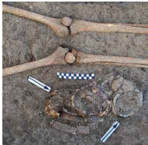
Slika 6 - Grob 178, detalj – drvena vedrica i keramički lonac (S. Petković)