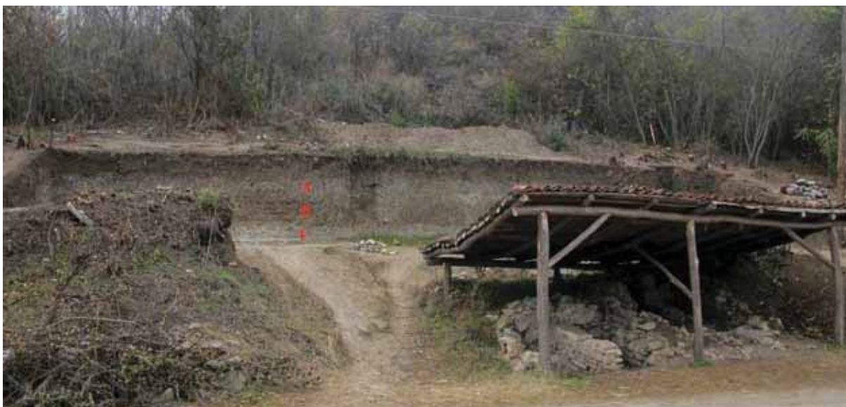
Slika 1 - Zapadni profil sondi 2/14 i 3/114 (S. Petković)

Stratigrafija nekropole konstatovana 2013. godine (Petković, Ilijić, Radinović 2014), potvrđena je i ovogodišnjim istraživanjima (sl. 1). Istočna padina brda Slog korišćena je za sahranjivanje u dva perioda, u kasnoj antici, od sredine 4. do sredine 5. veka, i u ranom srednjem veku, s tim, što je pored ranije konstatovanog horizonta nekropole iz vremena od kraja 9. do početka 11. veka istražena i starija faza sahranjivanja 7-9. veka. Ovo je izuzetno značajno otkriće svedoči o kontinuitetu života u današnjoj Ravni tokom ranosrednjovekovnog perioda, iako arheološki tragovi naselja iz tog vremena do sada nisu konstatovani.