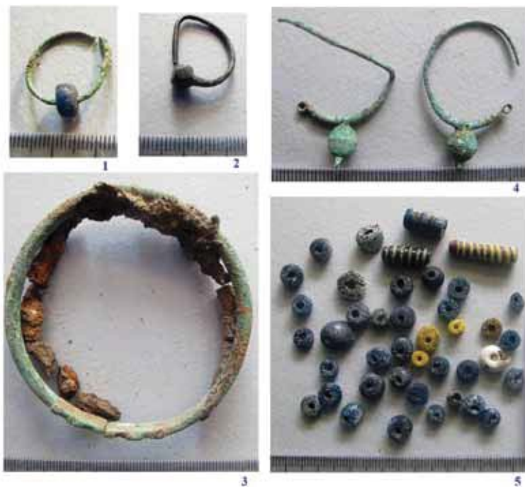
Slika 2 - 1. bronzana minđuša iz kasnoantičkog groba 175; 2. srebrna minđuša iz kasnoantičkog groba 160; 3. bronzana i gvozdena narukvica (spojene) iz kasnoantičkog groba 160; 4. bronzane, posrebrene naušnice iz srednjevekovnog groba 163; 5. staklene perle iz srednjevekovnog groba 159 (S. Petković)

U G. 159 (sl. 4) odrasla žena je sahranjena u jednostavnu, ovalnu raku, u ležećem položaju sa rukama ispruženim pored tela. Ceo skelet je slabo očuvan, a lobanja je fragmentovana. Čini se da je leva šaka bila postavljena ispod leve karlične kosti. Grob je orijentisan zapad-istok, sa odstupanjem od manje od 50° ka jugu. Kostii nadlaktice leve ruke su propale, a kostii desne ruke su dislocirane, osim šake. Isto tako, kostii leve strane grudnog koša nedostaju ili su dislocirane. Najinteresantniji detalj ove sahrane je otkriće skeleta lisice zapadno od glave pokojnice (Petković, Bizjak, Bulatović 2015), položene u savijenom ležećem položaju, tako da je glava životinje bila naslonjena na levu stranu glave žene. Ispod skeleta životinje otkriven je mali, maslinastozeleno gledosan keramički krčag sa jednom drškom i trolisnim otvorom – ojnohoe. Ovaj krčag se može datovati od poslednje trećine 4. do kraja 6. veka (Кузманов 1985: 35-36, К 59, К 60, К 69, Цвијетићанин 2006: 72-73, кат.