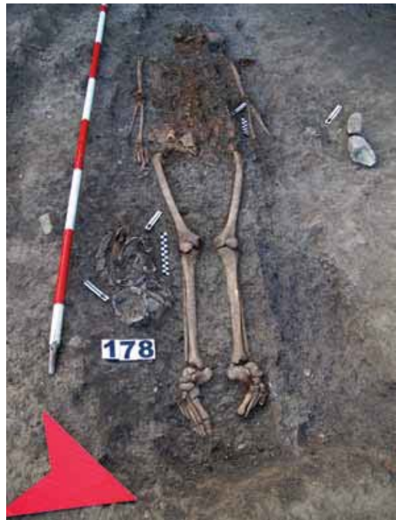
Slika 5 - Srednjevekovni grob 178 (S. Petković)