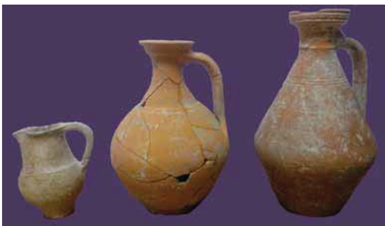
Slika 3 - Kasnoantičke keramičke posude (S. Petković)