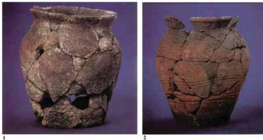
Slika 7 - 1. keramički lonac nađen desno od nogu pokojnika; 2. keramički lonac nađen kraj leve podlaktice pokojnika (S. Milutinović)

Oba lončića su veoma loše izrade, počevši od kvaliteta gline, neprečišćene, sa zrcima krečnjaka, preko lošeg, neujednačenog pečenja, do nemarno izvedenog ukrasa. Analogni primerici iz istočne Srbije datuju se od kraja 6. do kraja 8. veka, ali najčešće u 7. vek, dok se ovaj tip grnčarije u srednjoj i jugoistočnoj Evropi opredeljuje u srednjoavarski i