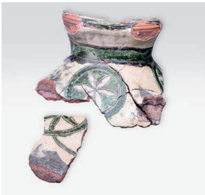
Сл. 97. Мотиви српске средњовековне керамике, XIV–XV век: а) Крушевац; б) Маглич

Византијски дух српске сграфито керамике најре- читије исказује њена естетика – избор и распоред мотива и колорит посуда. Распожива грађа, сразмерно бројна и разноврсна, пружа довољно елемената за успостављање оквирне хронолошко-декоративне схеме. Ипак, приликом тумачења појава је неопходна извесна доза опреза, због (и даље) недовољног узорка керамике, односно различитог степена истражености манастирских комплекса, насеља и утврђених градова средњовековне Србије. Како због околности у погледу стања истражености, тако и због карактера налазишта, у нашем материјалу се препознају две скупине, које одређеним детаљима,