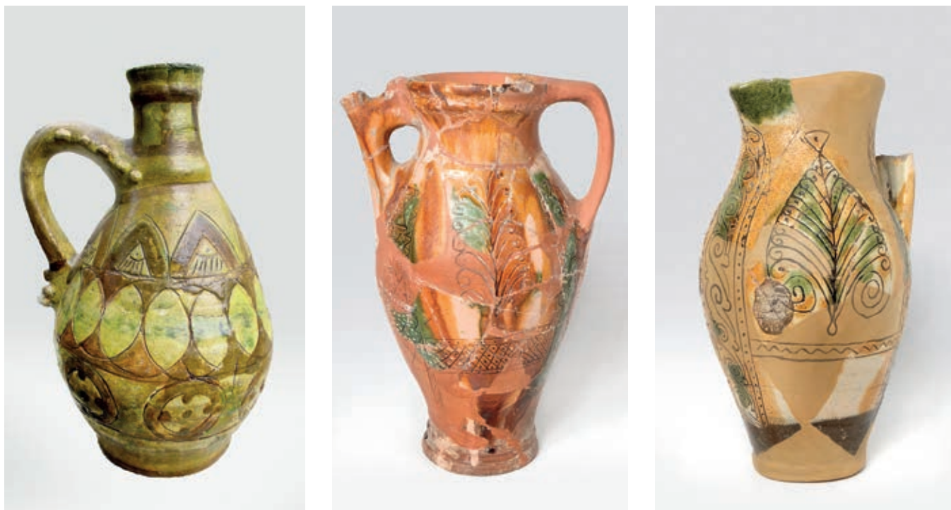
Сл. 99. Сграфито крчази, крај XIV–почетак XV века: а) Београд; б–в) радионица Крујевац–Сталаћ

производња керамике византијског стила у свим балканским регионима покренута у приближно време, пре свега за потребе властеле у утврђеним градовима.