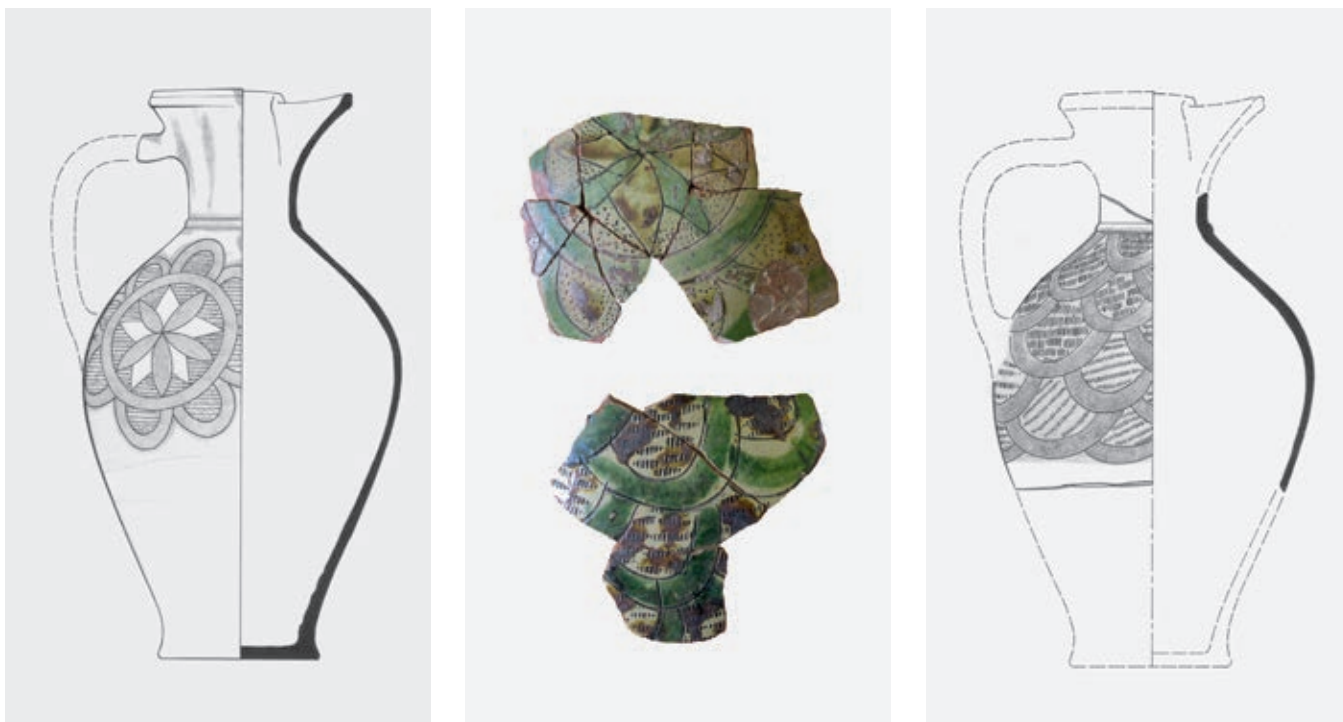
Сл. 100. Крчази из Смедеревске радионице, почетак XV века

Производња трпезне керамике је покренута, највероватније, пред крај XIII века, у раздобљу привредног раста подстакнутог радом рудника и успостављањем међународне трговине. Главно радионичко средиште се тада налазило у широј области Раса, а посуђе је дистрибуирано широм те области. Производња је највећи интензитет и обим имала током наредног столећа, практично све до турских освајања средином XV века. Поред рашке радионице, која по стилу својих производа остаје препознатљива за све време свог рада, подижу се и нова грнчарска средишта уз најзначајније утврђене градове. Међу њима се особеним занатским печатом одликују радионице у близини престоница Србије – Крушевца (1374/7–1425) и, касније, Смедерева (1425–1439).