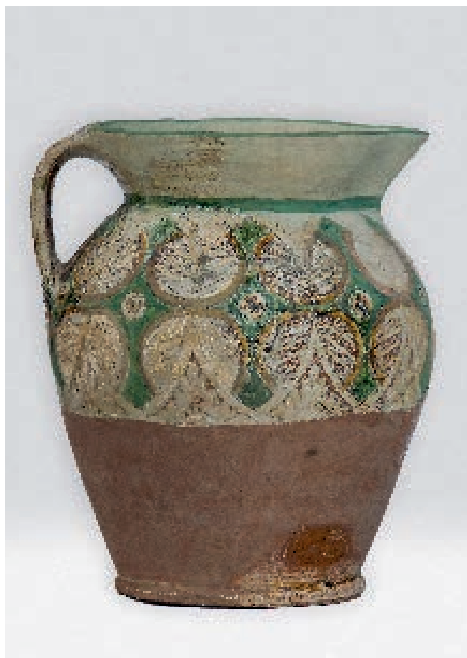
Сл. 98. Бокал из манастира Градац

Укупним особинама, а пре свега избором мотива и колорним спектрима, српска трпезна керамика одражава византијску естетику, византијски занатски и