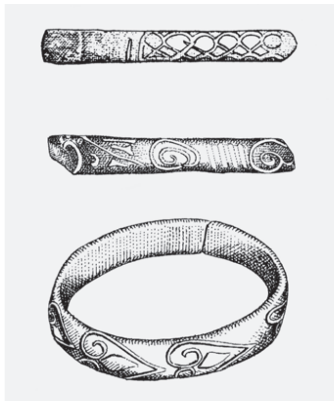
Fig. 69. Glass bracelets from the 11 th -12 th centuries: 1-2) Ras fortress; 3) Sremska Mitrovica

from silver (fig. 70). 28 Unlike in this city centre, one of the rare centres of that period in the central Balkan area to have been explored in some measure, jewellery was comparatively rare in fortresses and was made mostly out of bronze (fig. 35, 36, 38-40). However, cheaper materials did not exclude the good quality of make of certain pieces, which is particularly evident on specimens from the Ras fort and from the stations farther to the south. 29 As for jewellery, an important point to note is the significant quantity of glass bracelets, not just monochromatic, blue or green, but also painted pieces (fig. 5). 30