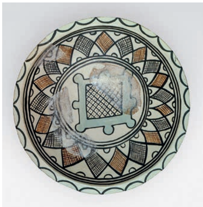
Fig. 67. Protomaiolica from the Ras fortress, beginning of the 13 th century

A brief review of the basic types of products and their distribution in the central Balkans provided certain indications in the sense of determining patterns of demand. However, only a complete analysis of archaeological contexts at the relevant locations can provide information about some general principles. In military fortresses, primarily those along the Danube border (especially in Belgrade and Kostol), the quantity of amphorae is visibly dominant compared with table dishes, although there are exceptions there, as well. For example, while the Belgrade table vessels mostly consist of jugs with the micaceous