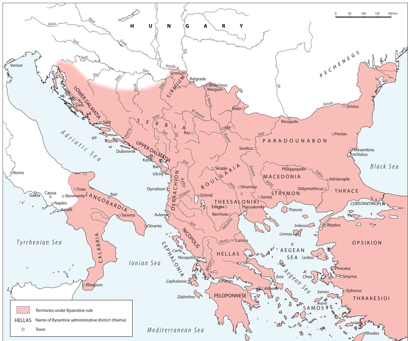
Fig. 64. The Balkan Peninsula under Byzantine rule, c. 1025

and millet for horses), the supplies also included meat (fresh and salted) and salted fish, oil, wine and spices, and other products – clothing, textiles and household equipment, largely ceramic and glass vessels, as well as jewellery. 7