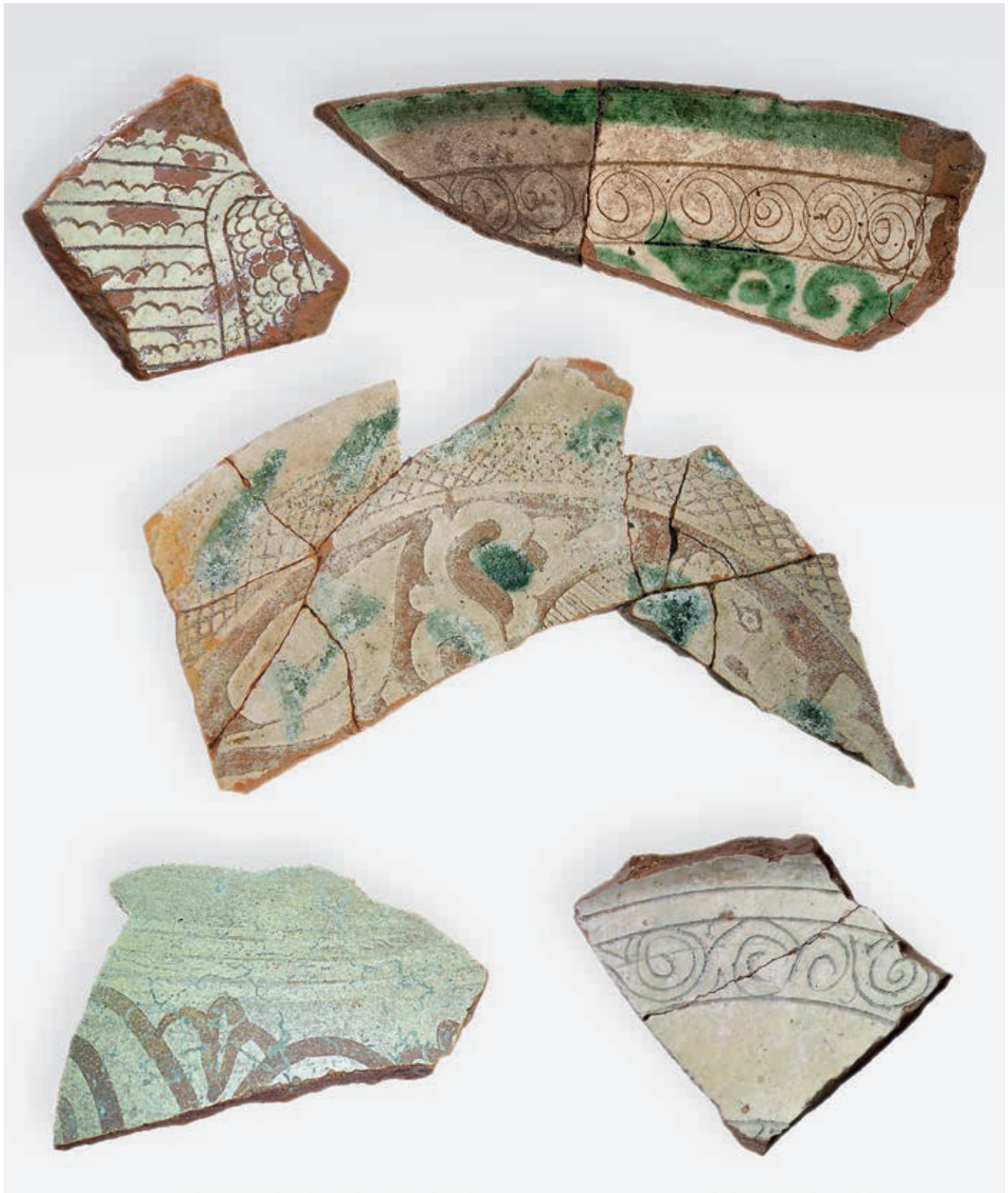
Fig. 66. Examples of table vessels from the 11 th and 12 th century: sgraffito ceramics and vessels with micaceous coating