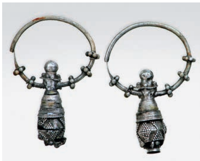
Fig. 70. Earrings from the necropolis around the Church of Saint Panteleimon in Niš, 11 th – 12 th century

city that also actively participated in the Byzantine war operations during the 11 th and 12 th century. 40