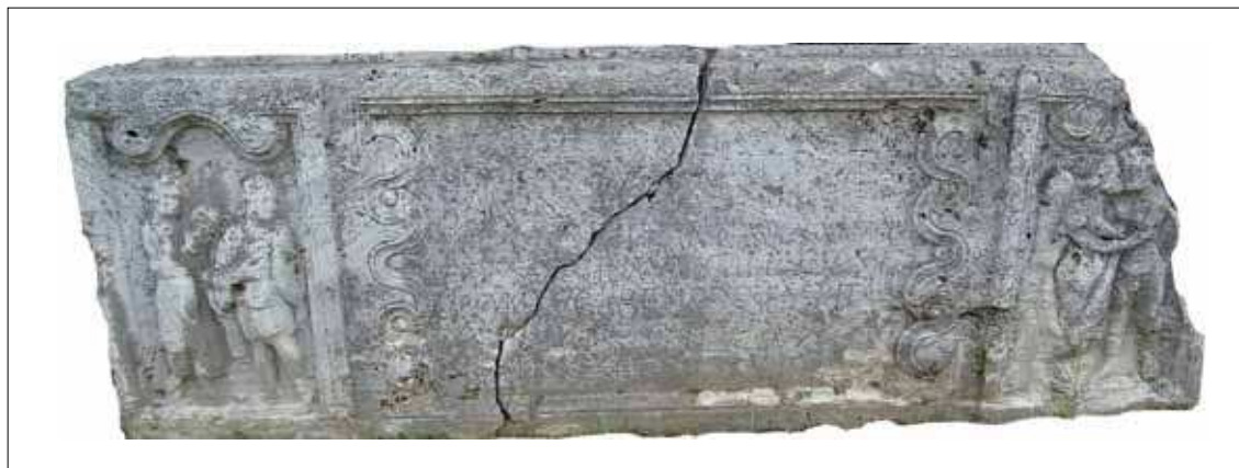
Fig. / Sl. 2: Sarcophagus of Aureliae Theodote from Viminacium / Sarkofag Aurelije Teodote iz Viminacija (National Museum of Požarevac, photo by B. Milovanović / Nacionalni muzej Požarevac, snimila B. Milovanović)

Translation: To the Manes, to Aureliae Theodote, a rare woman, who died at the age of 31 years, 4 months and 17 days. The monument was erected by Aurelius Gallicus to his wife.