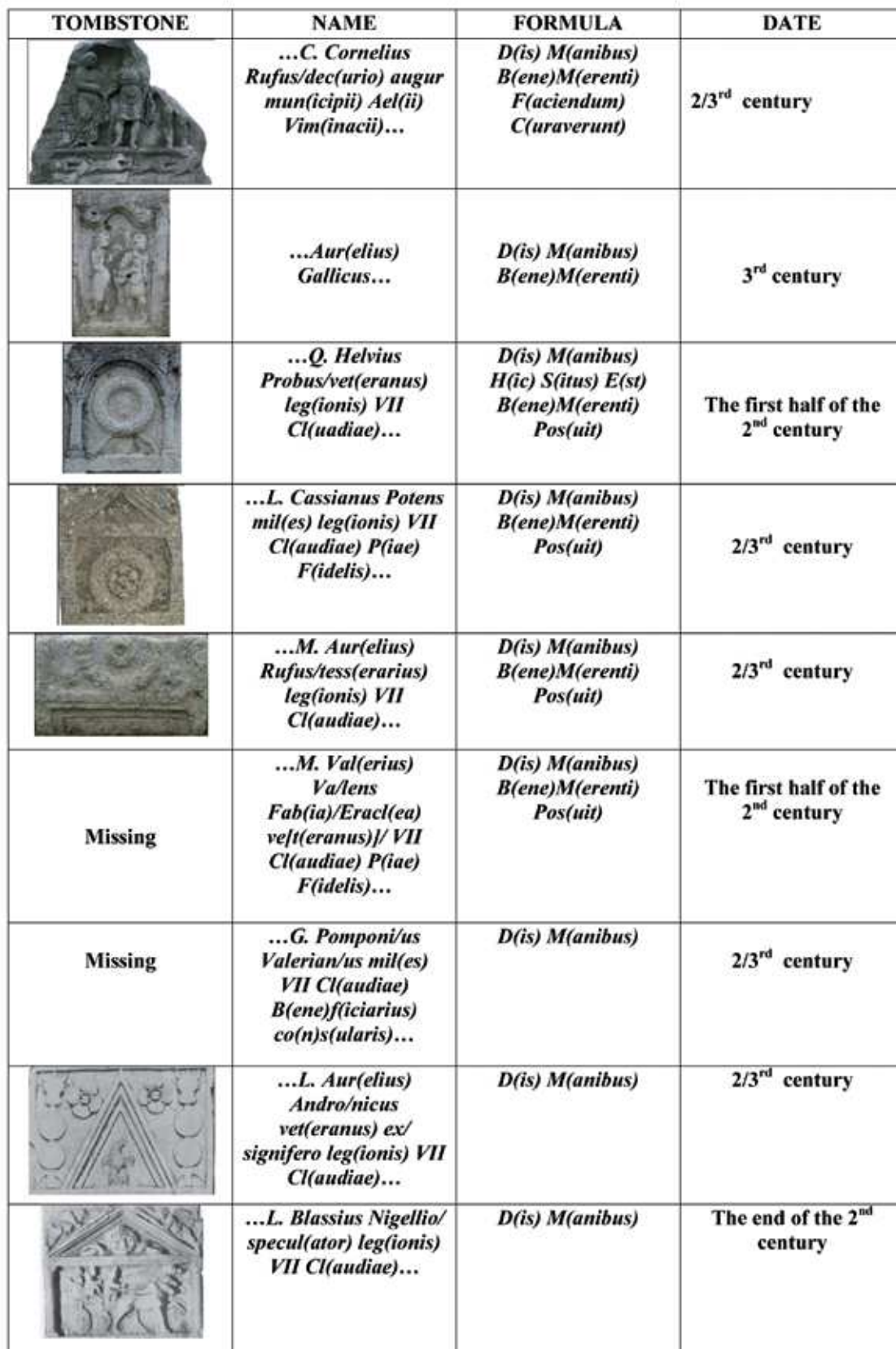
Tab. / T. 1: Soldiers, medals and military insignia on tombstones from Viminacium (names, formulas and dating) / Vojnici, odlikovanja i vojno znakovlje na nadgrobnim spomenicima iz Viminacija (imena, formule i datiranje).