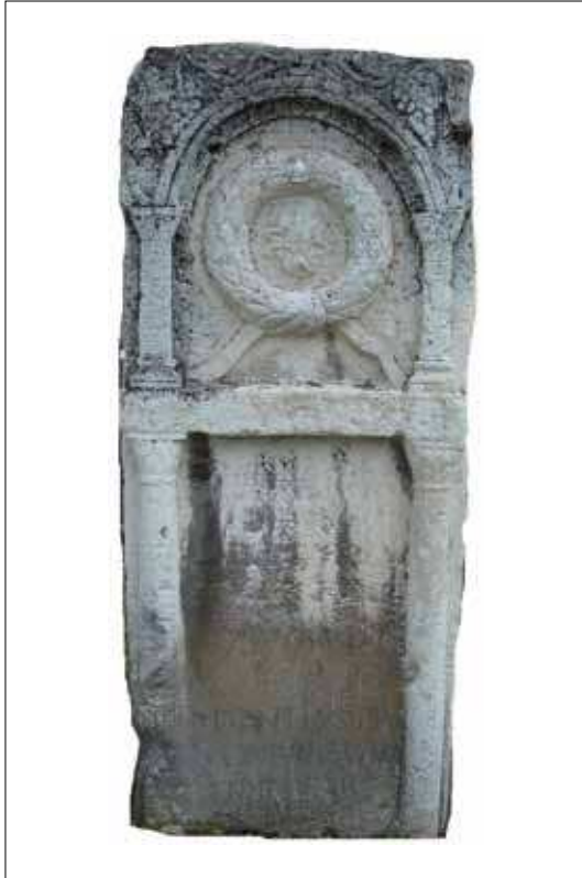
Fig. / Sl. 3: Monument of Q. Helvius Probus, veteranus VII Claudiae from Viminacium / Spomenik Kvinta Helvija Proba, veterana VII. legije Claudia iz Viminacija (National Museum of Požarevac, photo by B. Milovanović / Nacionalni muzej Požarevac, snimila B. Milovanović)