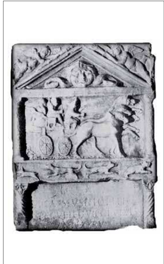
Fig. / Sl. 7: Monument of L. Blassius Nigellio speculator legionis VII Claudiae from Viminacium / Spomenik Lucija Blasija Nigelija, speculatora legije VII Claudia iz Viminacija (Belgrade / Beograd - Kalemegdan, Mirković 1986, 128-129, n. 106)

The earliest military monuments from Viminacium are dated to the first half of the 2 nd century AD, while most belong to the end of the 2 nd and the beginning of the 3 rd century AD. The most recent is a sarcophagus belonging to the 3 rd century AD. The dating