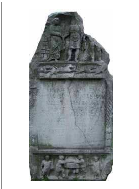
Fig. / Sl. 1: Monument of C. Cornelius Rufus, decurio augur municipii Viminacii / Spomenik Gaja Kornelija Rufa, dekuriona i augura municipija Viminacija (National Museum of Požarevac, photo by B. Milovanović / Nacionalni muzej Požarevac, snimila B. Milovanović)