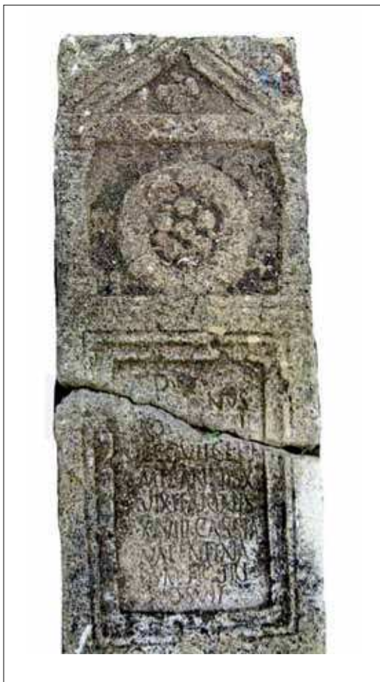
Fig. / Sl. 5: Monument of L. Cassianus Potens miles legionis VII Claudiae Piae Fidelis from Viminacium / Spomenik Lucija Kasijana Potensa vojnika VII. legije Claudia Pia Fidelis iz Viminacija (National Museum of Požarevac / Nacionalni muzej Požarevac)