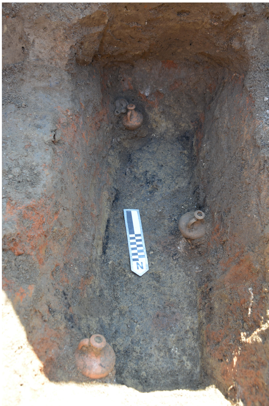
Slika 9. Tri keramička krčaga i žižak nađeni u donjem etažu groba kremiranog pokojnika (G1-1854), II vek.