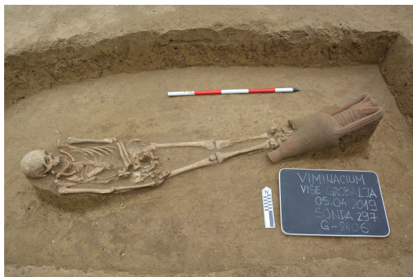
Slika 2. Slobodno ukopani grob inhumiranog pokojnika (G-2408) sa prilogom pored nogu u vidu amfore, III vek.