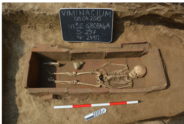
Slika 3. Pokojnik sahranjen unutar konstrukcije od opeka (G-2410), III vek.

na boku sa ukrštenim nogama. Sahranjivanje na nekropoli je relativno gusto, s tim da preklapanje grobova nije često i zabeleženo je u četiri slučaja (npr. G-2428 i G-2444). Grupno sahranjivanje nije konstatovano. Većina grobova pripada grobovima odraslih osoba (58 grobova), dok je manji broj dečjih (12 grobova).