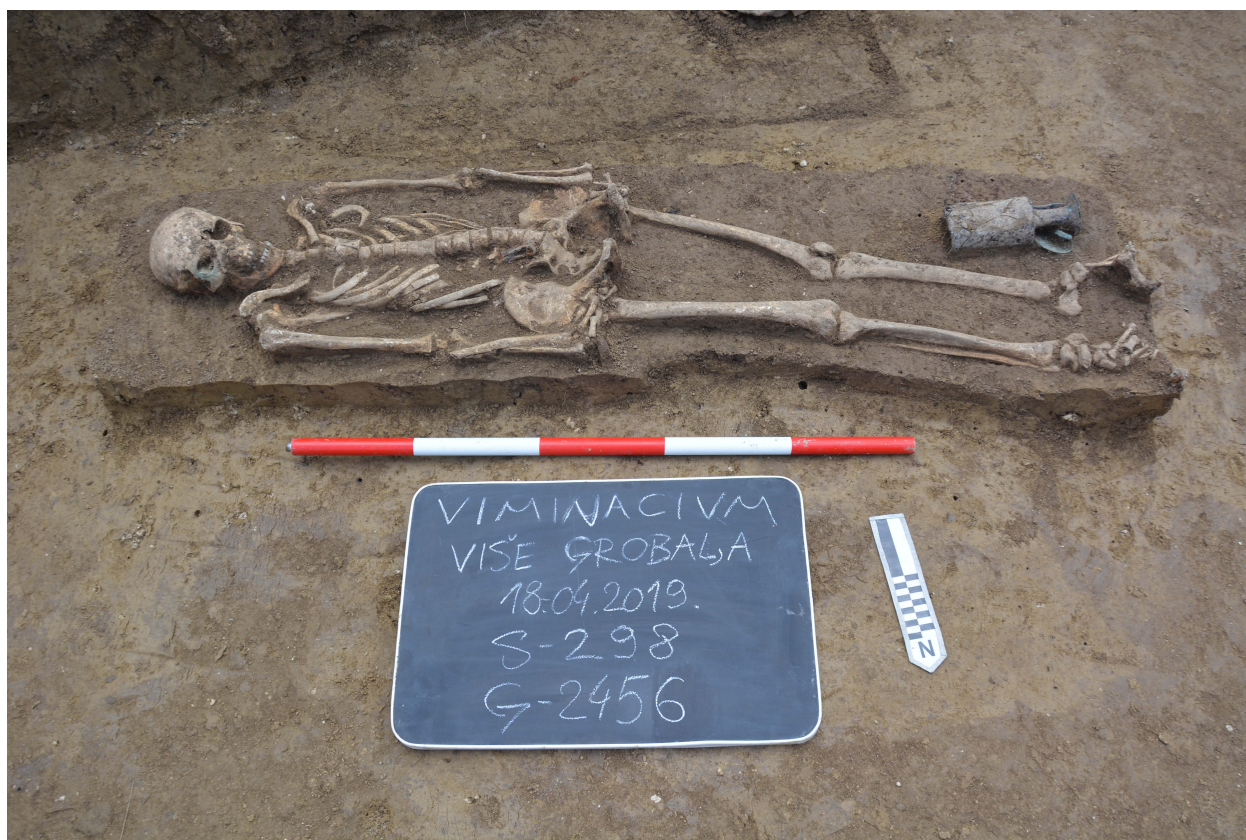
Slika 6. Staklena boca pronađena pored leve noge pokojnika (G-2456), IV vek.