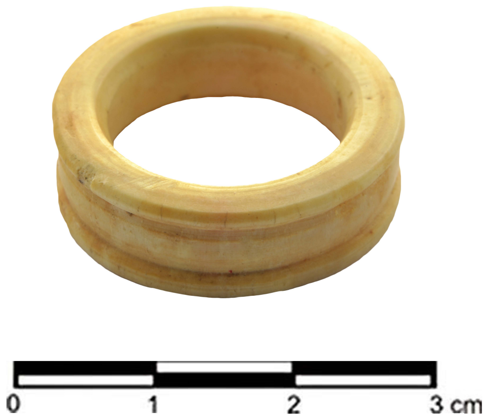
Slika 8. Prsten od slonovače iz groba inhumiranog pokojnika (G-2407), prva polovina III veka.