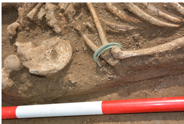
Slika 7. Dve bronzane narukvice (tordirana i trakasta) nađene na levoj podlaktici pokojnika (G-2421), IV vek.

mogućnost da se ta komunikacija nastavlja dalje ka jugu, ka segmentu nekropole sa gustim sahranjivanjem istraženom tokom 80-ih godina 20. veka (Зотовић, Јордовић 1990, Prilog 1; Korać, Golubović 2009, 16). Pomenuti segment udaljen je 200 m od lokacije istražene 2019. godine. Kako je upravo prostor između ove dve lokacije planiran za istraživanje u 2020. godini, izneta pretpostavka o komunikaciji biće proverena u narednoj kampanji.