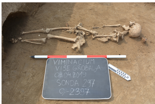
Slika 4. Pokojnik (G-2397) je najverovatnije bio sahranjen unutar drvenog sanduka na šta ukazuju ostaci gvozdениh klinova nađeni oko skeleta, III vek.

Kod grobova kremiranih pokojnika sa četiri slučaja dominira tip Mala Kopašnica – Sase II, odnosno etažna grobna raka sa crveno zapečenim ivicama, dok jedan grob pripada tipu Mala Kopašnica – Sase I, odnosno jednostavnoj grobnoj raci zapečenih stranica. Jedan primerak groba Mala Kopašnica – Sase II razlikuje se od ostalih, pošto je njegov donji etaž bio zidan od opeka. Svi istraženi grobovi kremiranih pokojnika su grupisani i u dva slučaja zabeleženo je preklapanje (sl. 5) (grob G1-1854 je oštećen prilikom ukopavanja groba G1-1855, koji je od njega mlađi, a grob G1-1853 je naknadno ukopan po središnjem delu starije kremacije G1-1854, koja se nalazi ispod njega). Svi grobovi se javljaju u istom nivou, na relativnoj dubini od 0,30–0,40 m.