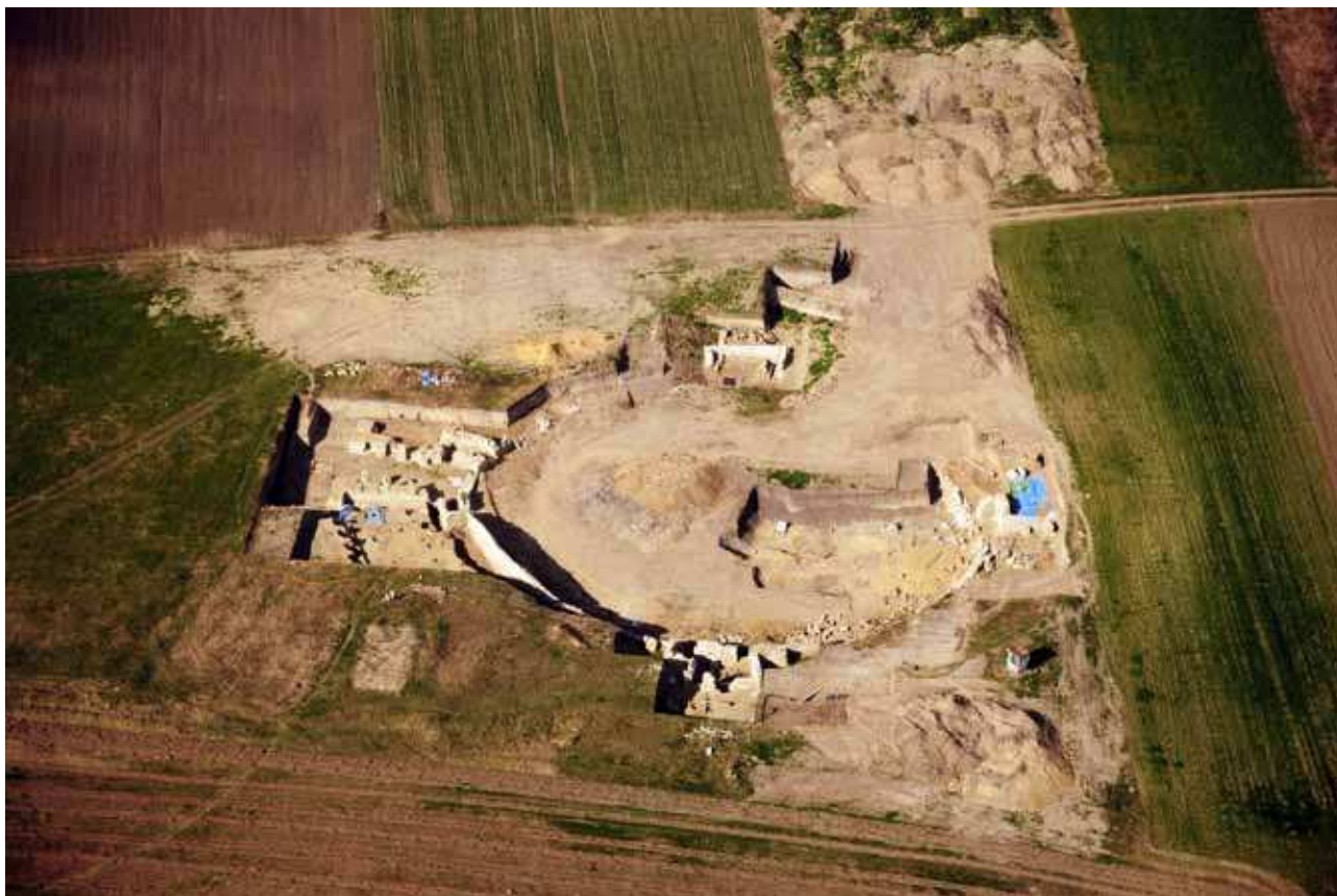
Sl. 1. Aviosnimak viminacijumskog amfiteatra.