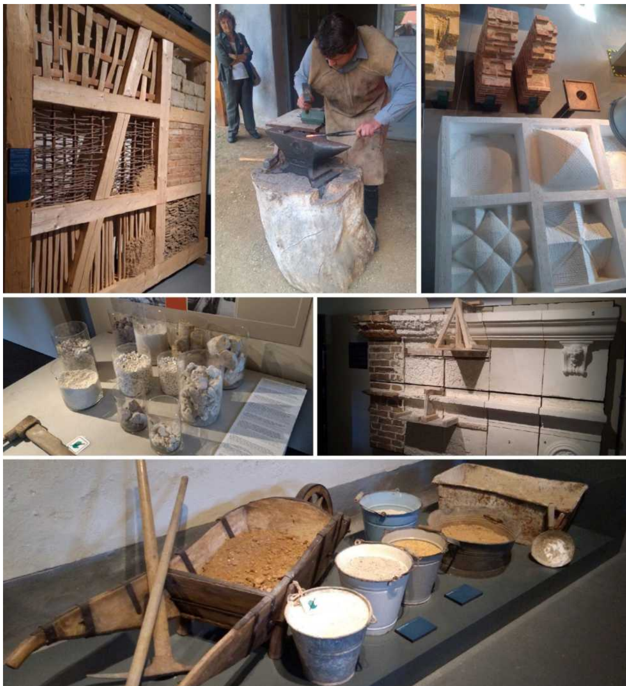
Slika 3. Izložbeni prostori „Centra za graditeljsko nasleđe“ u Plasiju.