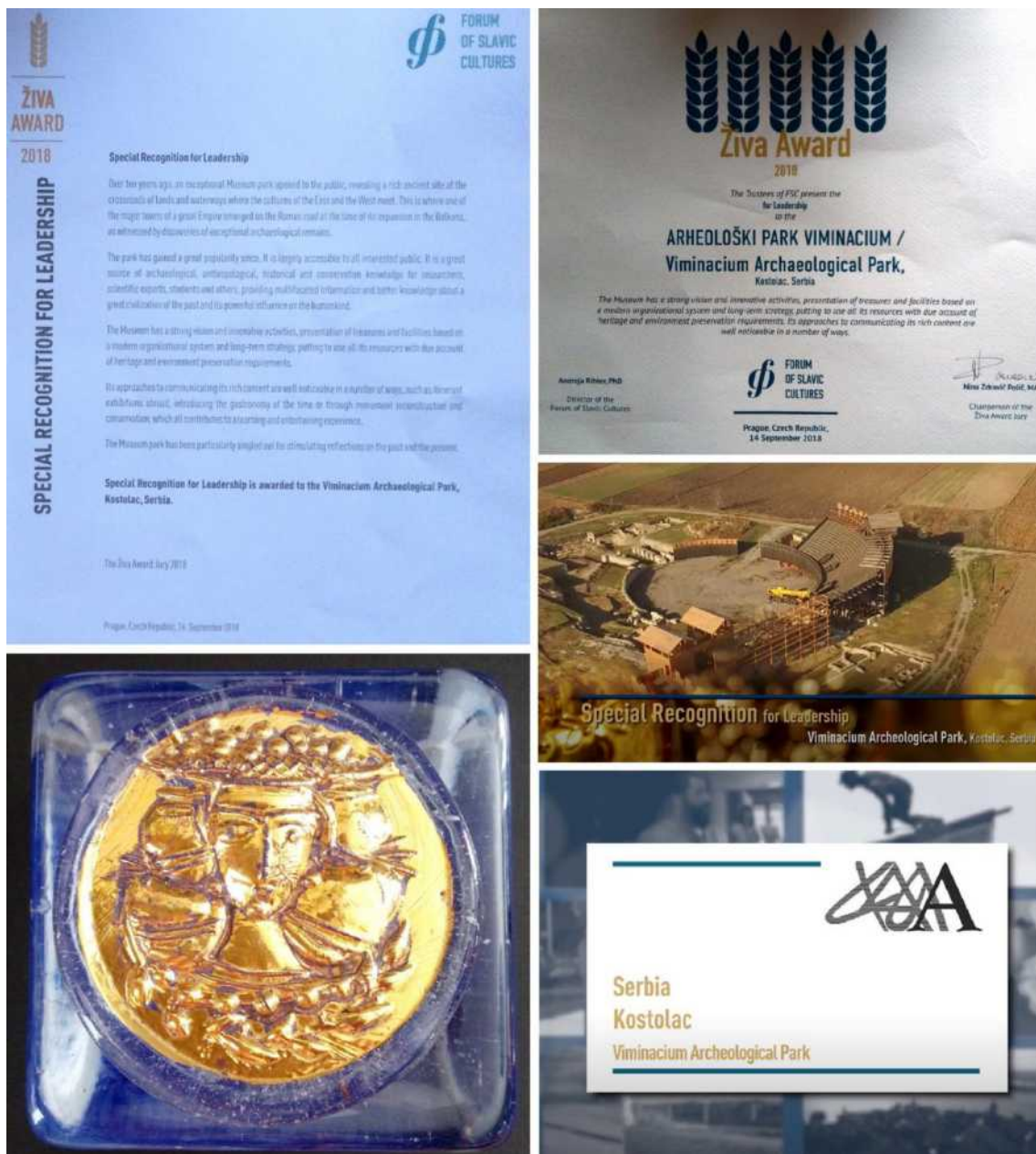
Slika 2. Nagrada dodeljena Arheološkom parku Viminacijum ; i inserti iz video materijala vezanih za ovo priznanje (Forum Slovanskih Kultura/ Forum of Slavic Cultures). „Živa 2018 Award for the Best Slavic Museum and Heritage Site, Jan 14, 2019.” https://www.youtube.com/watch?v=uP2ZBefMlU&t=99s, pristupljeno 21. 04. 2020).