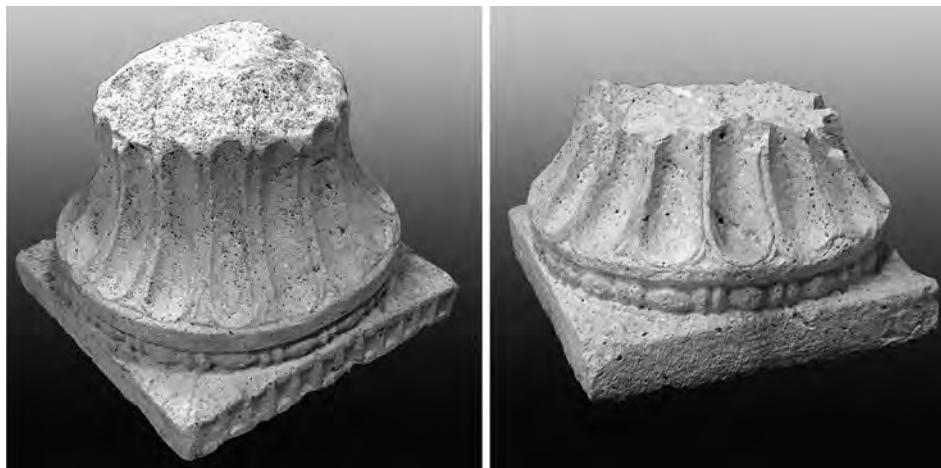
Сл. 1 Изгледи два канелирана палмина капитета пергамонског типа у Архео-етно парку у селу Равни, депандансу Завичајног музеја у Књажевцу

почетак проучавања стила коме би капители могли да припадају, као и провере времена њиховог настанка и места на коме су пронађени.