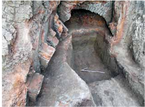
Slika 4 – Lokalitet Oslarci – Polom, ciglarska peć

U ovoj mahali (sl.1/4) su dokumentovani ostaci recentne ciglarske peći (sl. 4), u čijoj je neposrednoj blizini registrovana i veća količina opeke i ćeramide. Na samom objektu vidljivo je šest ozidanih lukova od opeke – verovatno delovi “rešetke” kroz koju je strujao topao vazduh. Samo jedan luk je sačuvan u celosti, dok su ostali registrovani u donjim partijama. Širina jednog luka je 0,24 m, što odgovara širini jedne opeke ostalih dimenzija 12 cm x 5 cm, a postavljani su na razmaku od 0,22 m. Vidljivi deo opeka ima tanku i glatku zelenu gleđ, dok je unutrašnji zid peći premazan glinom. Objekat ustanovljenih dimenzija 2,6 m x 1,4 m je registrovan na dubini od oko 2,5 m. Po dužini se prostirao približno u pravcu istok-zapad, a s obzirom na to da nije istražen u celosti prostire se i dalje na istok, ispod pristupnog puta na kojem nisu planirani dalji zemljani radovi. Prilikom čišćenja i dokumentovanja objekta nije registrovan bilo kakav pokretni materijal koji bi ga približnije datovao. Trebalo bi istaći da je peć smeštena na nepunih 100 m od gliništa koje je do pre nekoliko godina koristila ciglarska fabrika. S druge strane, između gliništa i peći