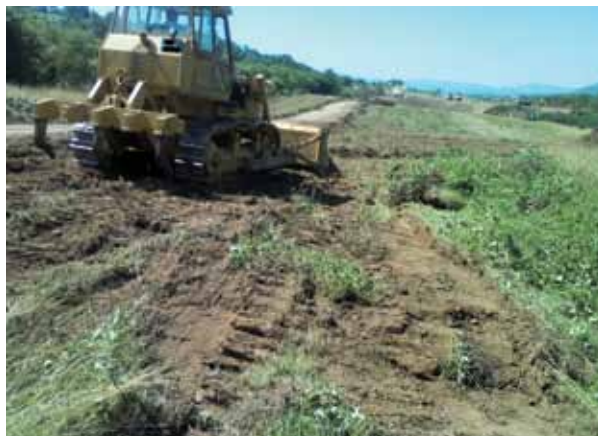
Slika 5 – Lokalitet Čivlak – Polom, uklanjanje površinskog humusa

Lokalitet Čivlak se nalazi u istoimenoj mahali u središnjem delu naselja Polom (sl. 1/5). Arheološki tragovi registrovani su južno od potoka Čivlak, koji se nakon nešto više od 500 m uliva u Južnu Moravu. Prilikom obilaska terena pre početka radova na izgradnji autoputa, na površini lokaliteta beleženi su arheološki i etnografski ostaci. Tragove naseļavanja u prošlosti u ovoj i okolnim mahalama zapisao je sredinom prošlog veka J. Trifunovski (Трифуноски 1963: 198). Već prilikom prvih radova na trasiranju Koridora pojavili su se praistorijska keramika i artefakti od okresanog kamena, ali pošto su radovi na ovom potesu zbog pada terena prvenstveno obuhvatali površinski humus (sl. 5), nisu registrovani tragovi arheoloških objekata, kao ni kulturnog sloja.