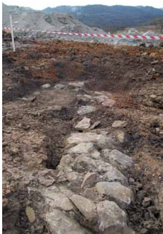
Slika 3 – Lokalitet Sveta Trojica – Kržince, ostaci suhozida

Nalazište zauzima prostranu padinu ispred južnog portala tunela Manajle u selu Kržince, koja se blago spušta ka zapadu (sl. 1/2). U središnjem delu padine nalazi se zapis Sv. Trojice po kome je lokalitet dobio naziv. Nalazište je registrovao Milan Jovanović još 1968. godine (Јовановић 1968: 508), dok je postojanje kasnoantičkih objekata potvrđeno zaštitnim arheološkim iskopavanjima 2003. godine (Ружић et al. 2005: 205). Sredinom 2015. godine izvršena su dalja istraživanja lokaliteta Sv. Trojica u organizaciji Arheološkog instituta, ali zbog deponije kamena iz tunela Manajle opet nije bilo moguće istražiti ceo lokalitet. Ipak, arheološkim nadzorom 2016. godine potvrđeno je postojanje objekta koji je verovatno bio u vezi sa kasnoantičkom vilom istraženom 2003. godine. Objekat tom prilikom nije bio istraživan, a na njega je tadašnjim rukovodiocima iskopavanja ukazala vlasnica njive gde su izoravani delovi zida (Ружић et al. 2005: 209). Registrovan je na oko 160 m južno od tunela Manajle, u vidu koncentracije lepa i gara na površini od približno