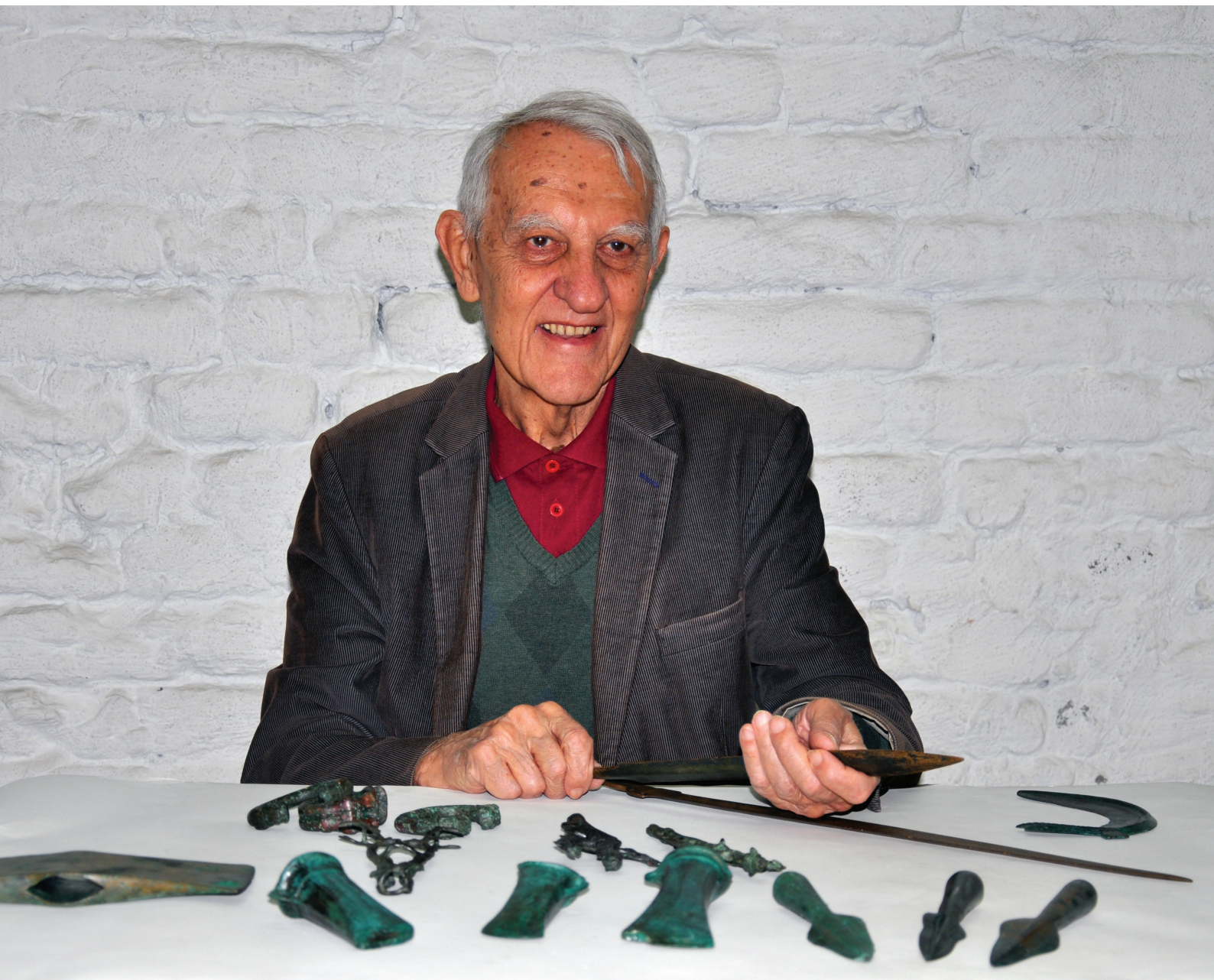
In the National Museum in Belgrade, 2018 У Народном музеју, 2018. године