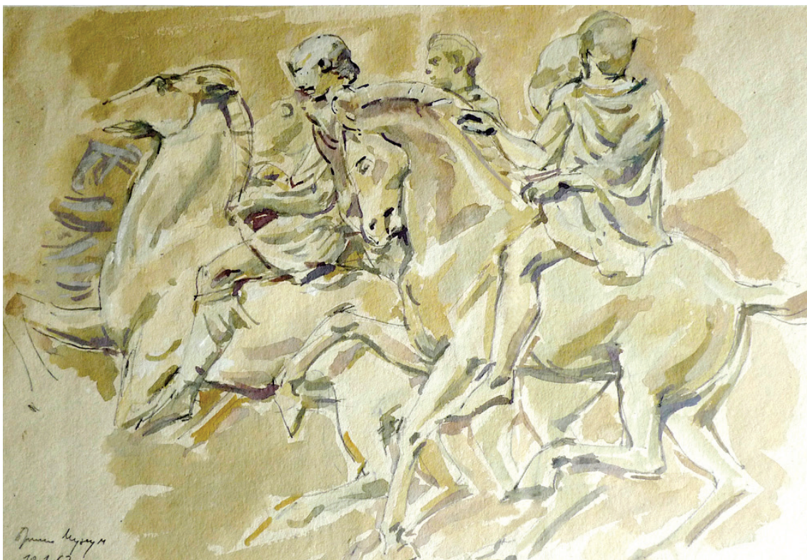
Abb. 1 – Die Reiter von Parthenon (British Museum, London), gezeichnet von Rastko Vasić am 10. Januar 1967

Als junger Archäologe hat er mit Liebe Teile der Reliefs von Parthenon in seinem Skizzenblock gemalt (Abb. 1). Seine Bewunderung der Antike hat ihn sein ganzes Forschungsleben begleitet, was man an seinen Beiträgen über die griechischen Importe im Zentralbalkan sehen