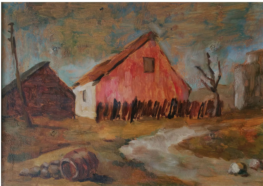
Karaburma, oil • Карабурма, уље (1964)