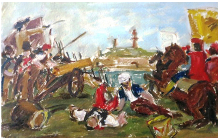
Sketch of the Siege of Belgrade 1717, oil • Скица за Опсаду Београда 1717, уље (1970)