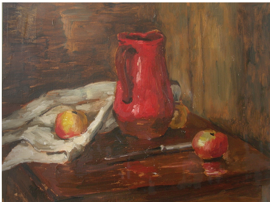
Still-life, oil • Мртва природа, уље (1964)

визорном атељеу који је настајао кад сам почео са сликањем и нестајао кад сам завршио. Најчешће сам сликао мртве природе које су биле најзахвалнији мотив у тим условима мада сам се огледао и у другим темама. У основи сам остао реалиста јер недостатак временског континуитета није дозволио да тај реализам начини корак даље мада је велико питање да ли бих уопште био у стању да га напустим. С друге стране моја љубав према сликању античких мотива, архитектуре и скулптуре, држала