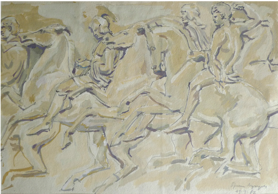
Parthenon Frieze, tempera • Партенонски фриз, темпера (1967)