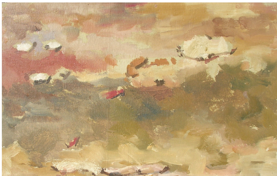
Profile, Kurzenbettli, oil • Профил, Курцентбетли, уље (1968)