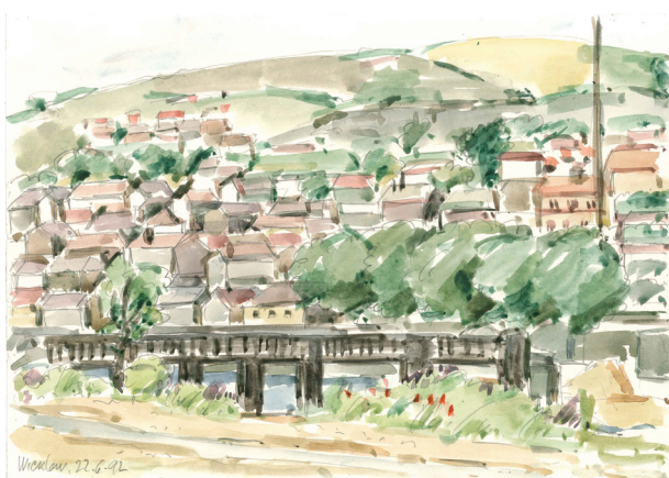
Wicklow, aquarelle • Виклоу, акварел (1992)

What is the future of Serbian archaeology?