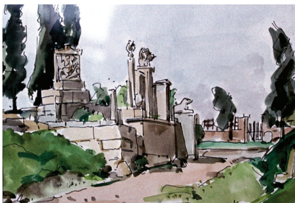
Kerameikos, aquarelle • Керамејкос, акварел (1974)