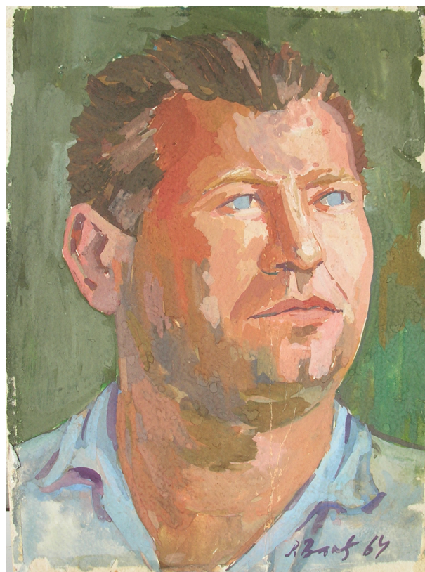
Milija from Mala Moštanica, tempera • Милија из Мале Моштанице, темпера (1964)

ти код Винка Грдана. У Академији сам научио све што је требало сем сликања уљем, па сам на четвртој години почео да сликам уљем код куће где ми је прве подуче дао отац. Следеће године ме је упутио у остале тајне те технике тако да сам је временом савладао, управо оне