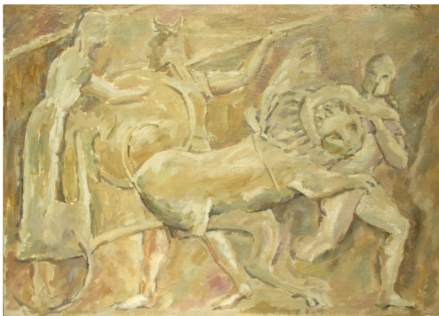
Cybele from Delphi, oil • Кибела из Делфа, уље (1968)

- Истина је да нисам провео на теренима онолико дуго као неки други, али кад се све сабере, не може се рећи да нисам био на ископавањима. У Сирмијуму сам учествовао у две дуге кампање 1962. (локалитет 28) и 1968. (локалитет 37), у Улцињу сам такође био у два маха 1969. и 1984. дуже времена, радове у Велесници сам водио