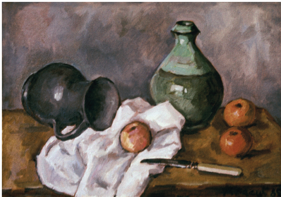
Still-life, oil • Мртва природа, уље (1985)

beginning of the fourth decade of my life, when I wrote several short stories - of which two were published in Braničevo Journal. That gave me zest to write stories with themes based on archaeology and art history, which were inspired by my longer stays in Greece and Switzerland. I was quite happy when one, and soon after other stories, were published in "Letopis Matice Srpske (Chronicle)", and even more happy in 1981 when I received a letter from Jovan Hristić who suggested that I collect all of the stories and offer them to "Nolit" publishing house. Unfortunately, the corpus of stories was rejected due to lack of finances, with the explanation that "Nolit" prints books for the writers who write for living, and not other professions with secure enough means to make a living. I was disappointed, but not discouraged. Several years