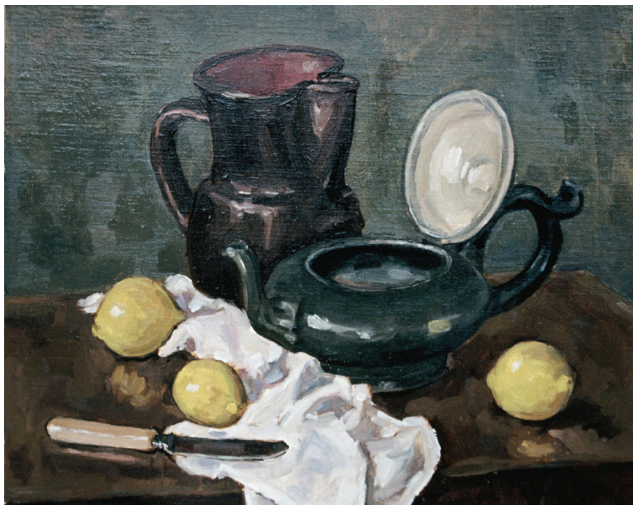
Still-life, oil • Мртва природа, уље (1984)

- Бавио бих се сликарством, и вероватно још нечим. А чиме, не бих умео да кажем.