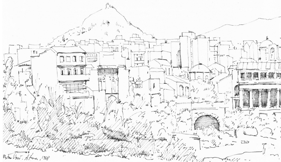
Athens • Атина (1968)