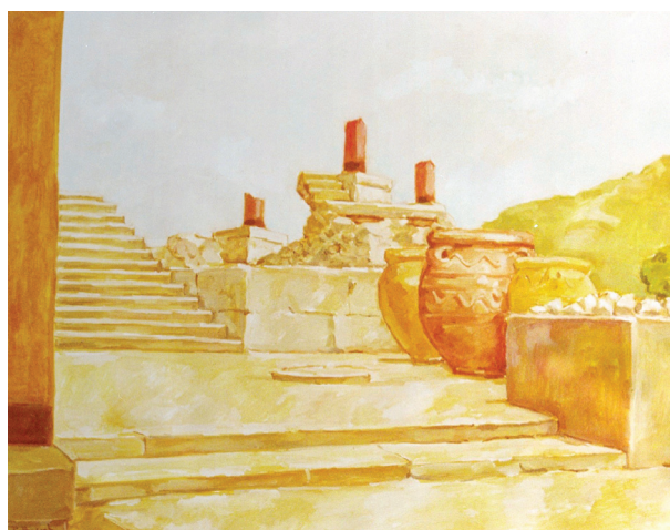
Knossos, oil • Кносос, уље (1978)