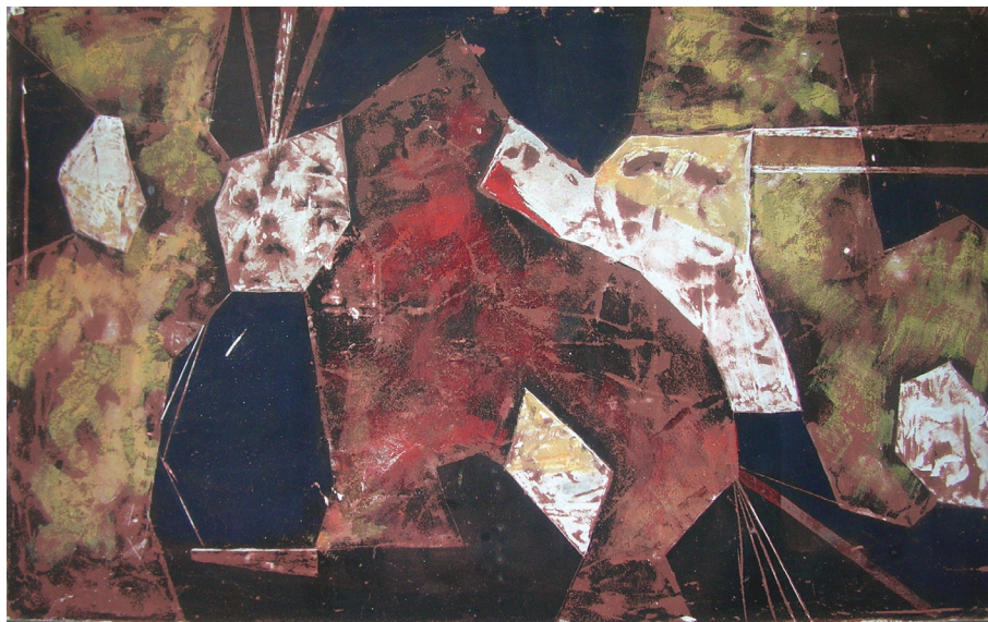
Argonauts, sgraffito • Аргонаути, зграфито (1960)