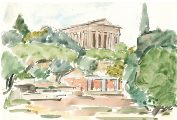
Theseion, aquarelle • Тезејон, акварел (1983)