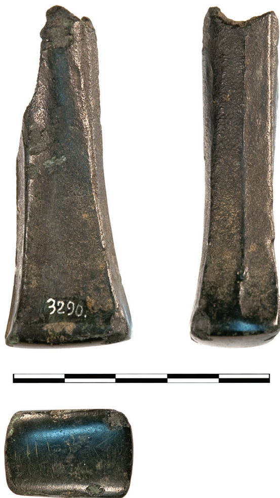
Сл. 4 – Чекић.

Анализа предмета пронађених у остави из Рудника и њихова компарација са предметима из других остава има за циљ утврђивање хронолошког односа са оставама из Србије и источне Славоније, као и са оставама које чине суседне регионалне групе Urnenfelder културног комплекса у Банату, Трансданубији, северо-