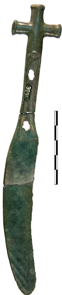
Сл. 2 – Нож.