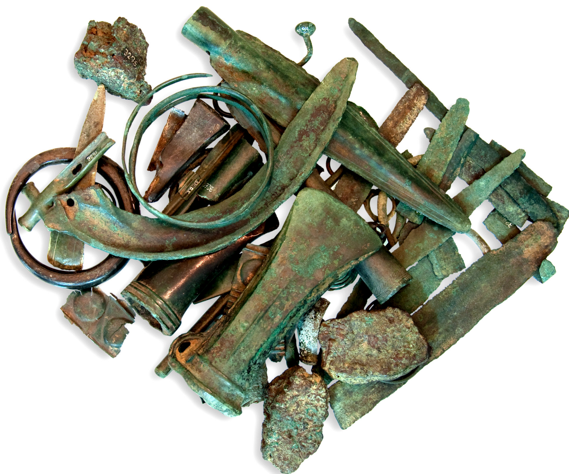
Сл. 1 – Остава из Рудника.