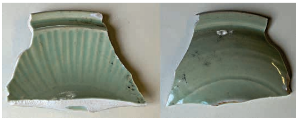
Сл. 2 Чинија од селадона из Доњег града Београдске тврђаве (цртеж: А. Суботић)