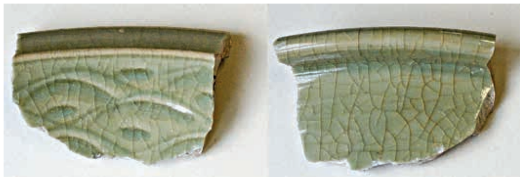
Сл. 1 Чинија од селадона са простора београдског замка (цртеж: А. Суботић)