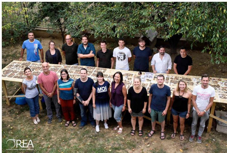
Slika 1 – Ekipa projekta Praistorijski pejzaži u regionu Puste reke (Leskovac)

Budući da je u južnoj Srbiji izražena nedovoljna istraženost lokaliteta sa ranoneolitskim horizontima naseljavanja, a da je u Leskovačkom basenu uočena povećana koncentracija lokaliteta koja ukazuje na intenzivnu upotrebu rečnih terasa sliva Južne Morave u različitim periodima praistorije, upravo je taj region odabran za ispitivanje naseljavanja prvih sedentarnih praistorijskih zajednica. Sistematski popis odranije poznatih nalazišta i lokacija sa slučajnim nalazima koji ukazuju na dugotrajno naseljavanje ove oblasti dat je u knjizi o