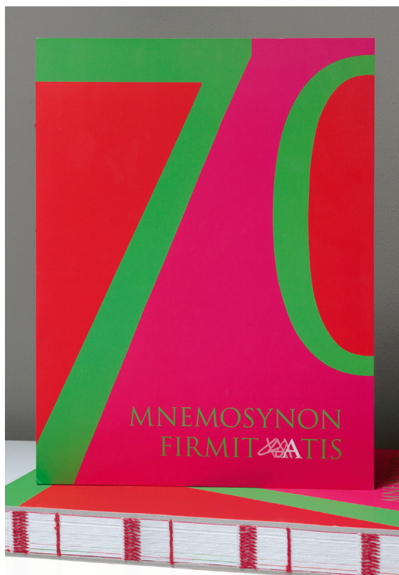
Slika 1 – Mnemosynon firmitatis: sedamdeset godina Arheološkog instituta (1947-2017)

Taj trud nas je osnažio u uverenju da je značajno da sabiramo i prezentujemo rezultate koje ostvarimo u toku svake godine. Stoga je ova, sedma po redu sveska zbornika Arheologija u Srbiji , koja se uz poslovično zakašnjenje odnosi upravo na 2017. godinu, uz uobičajene izveštaje sa iskopavanja i rekognosciranja i prikaz stručnog i naučnog rada na određenim problemima opremljena i opširnim uvodnim izveštajima o radu na četiri matična projekta Arheološkog instituta. Uz ostalo, ti izveštaji, sačinjeni po ugledu na godišnjake velikih evropskih instituta, sadrže i kompletnu bibliografiju učesnika na projektima i ažurne podatke o kongresima, konferencijama i radionicama na kojima su izlagali.