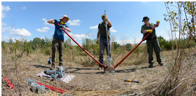
Slika 4 – Ispitivanje slojeva zemlje bušenjem

kako bi se dobili što precizniji podaci o debljini kulturnog sloja i prikupili uzorci za preliminarna radiokarbonska datovanja (Horejs et al. 2018: 34–36).