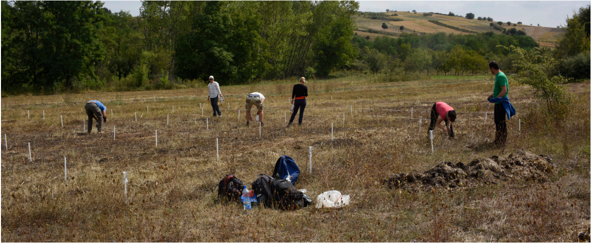
Slika 2 – Rekognosciranje: prikupljanje površinskog materijala u okviru kvadratne mreže

Svi lokaliteti su na terenu precizno zabeleženi GPS uređajem, dok su podaci o njima i detaljno dokumentovanim pokretnim nalazima sačuvani u specijalizovanoj GIS bazi. Dokumentovanje nalaza prilikom obilaska lokaliteta Čekmin, Svinjarička čuka i Sekicol započinjano je na samom terenu, jer se njihovo prikupljanje odvijalo u okviru mreže kvadrata dimenzija 3 m x 3 m ili 5 m x 5 m. 6 Poređenjem kvantitativnih podataka o prikupljenom arheološkom materijalu, kategoriji nalaza (npr. keramika, kamene alatke i dr.) i mestu nalaza u okviru kvadratne mreže dobijeni su dosta precizni podaci o njihovoj površinskoj distribuciji. Dalja obrada pokretnog materijala podrazumevala je najpre statističku, tipološku i relativno-hronološku obradu (svrstavanje u uže praistorijske periode, npr. neolit, pozno bronzano doba, starije gvozdeno doba), u slučajevima kada je ona bila moguća, nakon čega je sav prikupljen materijal detaljno opisan, tehnički snimljen i fotografisan. Nakon obrade, nalazi su deponovani u teritorijalno nadležni Narodni muzej u Leskovcu, gde se vršila dalja obrada (Horejs et al. 2018: 23–51). Napominjemo da je u Lalinovcu i Sekicolu otkiveno i nekoliko kamenih alatki koje se preliminarno mogu datovati u paleolitsko razdoblje.