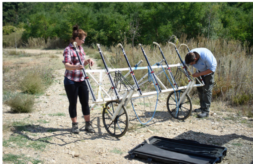
Slika 3 – Multisenzorski sistem za geomagnetna merenja Lea Max