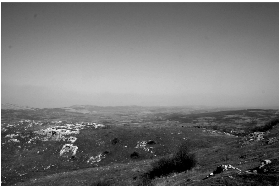
Сл. 2. Утврђење Градац, 2007. (према: Filipović and Petrović 2012, Fig. 3b) Fig. 2. Gradac fort, 2007 (after: Filipović and Petrović 2012, Fig. 3b)

and Petrović 2012, 50; Миливојевић 2013, 62–63). Такође, током радова на одржавању локалног водовода које је на локалитету изводила једна грађевинска фирма из Сврљига, према неким проценама, уништена је површина од преко 5.000 м 2 (Филиповић и Миливојевић 2008, 109, нап. 5). Због свега тога данас је ово узвишење готово сасвим огољено и тек се понегде уочавају остаци темељних зона фортификација и грађевина (сл. 2).