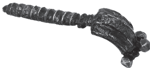
Сл. 3. Гвоздена фибула орнаментисана уметнутим нитима од легуре бакра