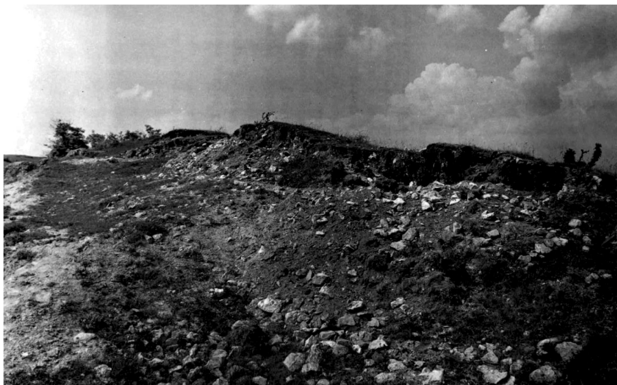
Сл. 1. Утврђење Градац, 1984. (према: Filipović and Petrović 2012, Fig. 3a) Fig. 1. Gradac fort, 1984 (after: Filipović and Petrović 2012, Fig. 3a)

дући да се помиње у турским дефтерима из XV века (Голубовић 2002, 10). Сам локалитет Градац представља стеновито узвишење (609 м) на рубу села, приступачно једино са западне стране, поред кога води стари пут који повезује Нишку са Сврљишком котлином. Чине га два блиска, једном председлином одвојена дела, на којима се налазе материјални трагови постојања објеката.