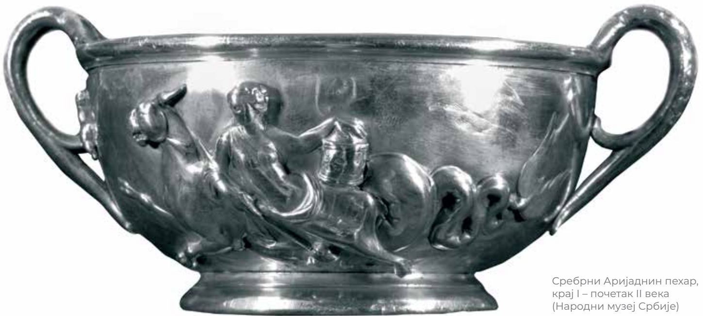
Сребрни Аријаднин пехар, крај I – почетак II века (Народни музеј Србије)