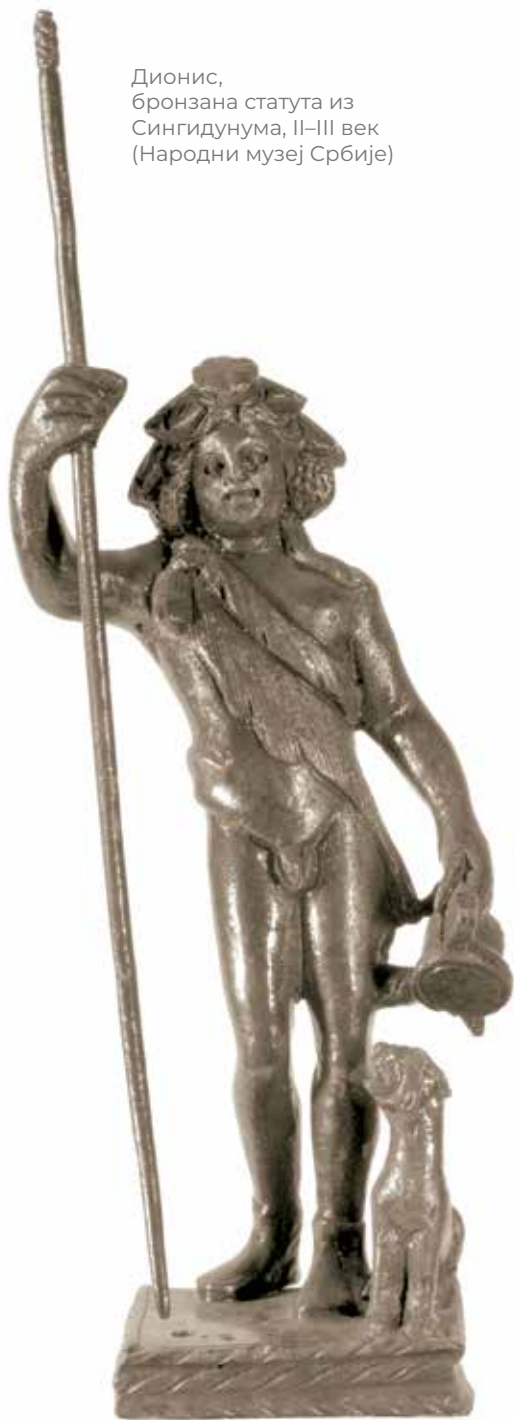
Дионис, бронзана статуа из Сингидунума, II–III век (Народни музеј Србије)

Писани извори из IV века о Пробу и виноградарству у Панонији и Мезији