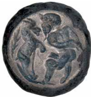
Гвоздени прстен с представом Пана, середина II века (Народни музеј Лесковца)