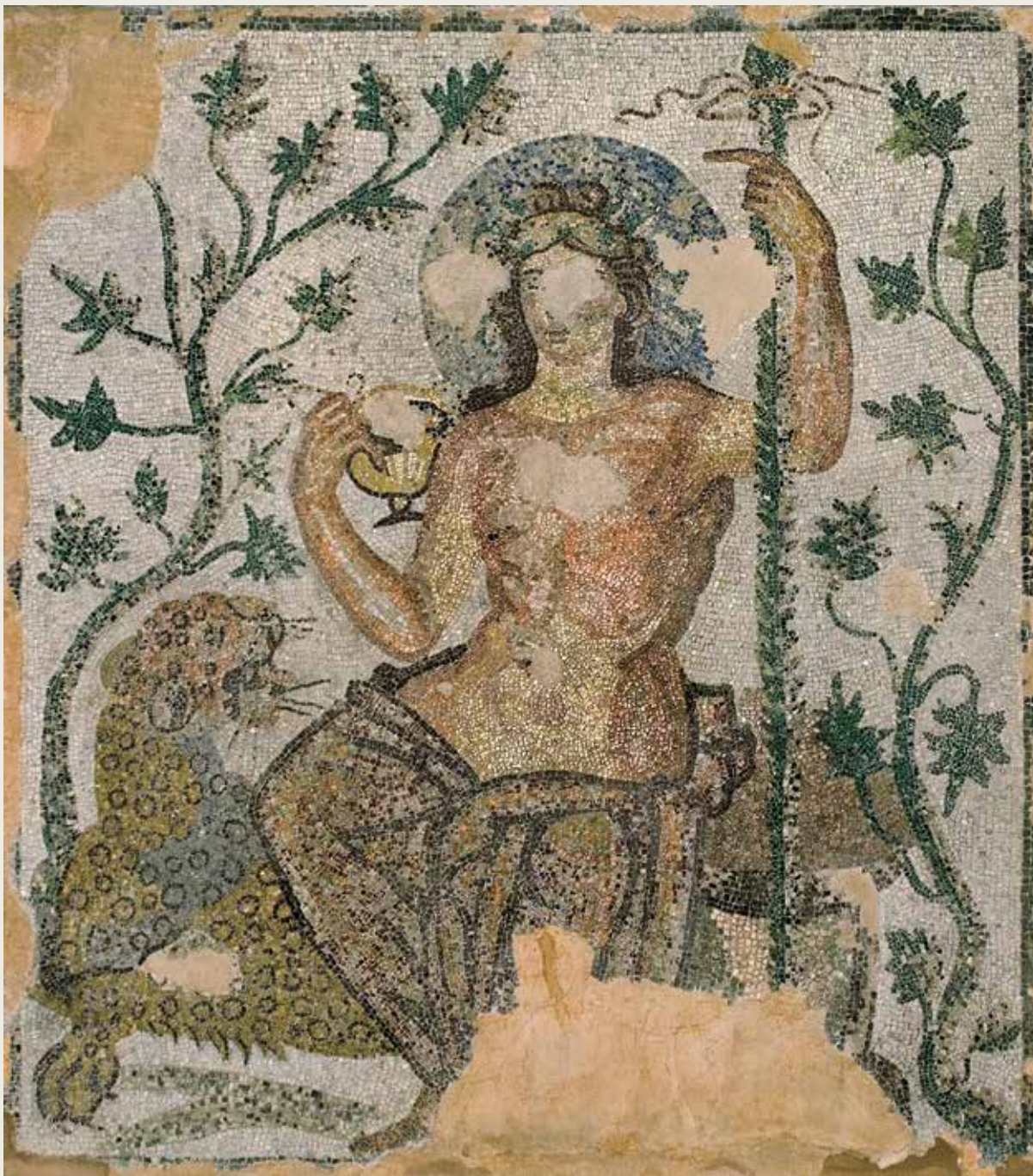
Дионис, мозаик из Галеријеве палате у Гамзиграду, крај III – почетак IV века (Народни музеј Зајечар)