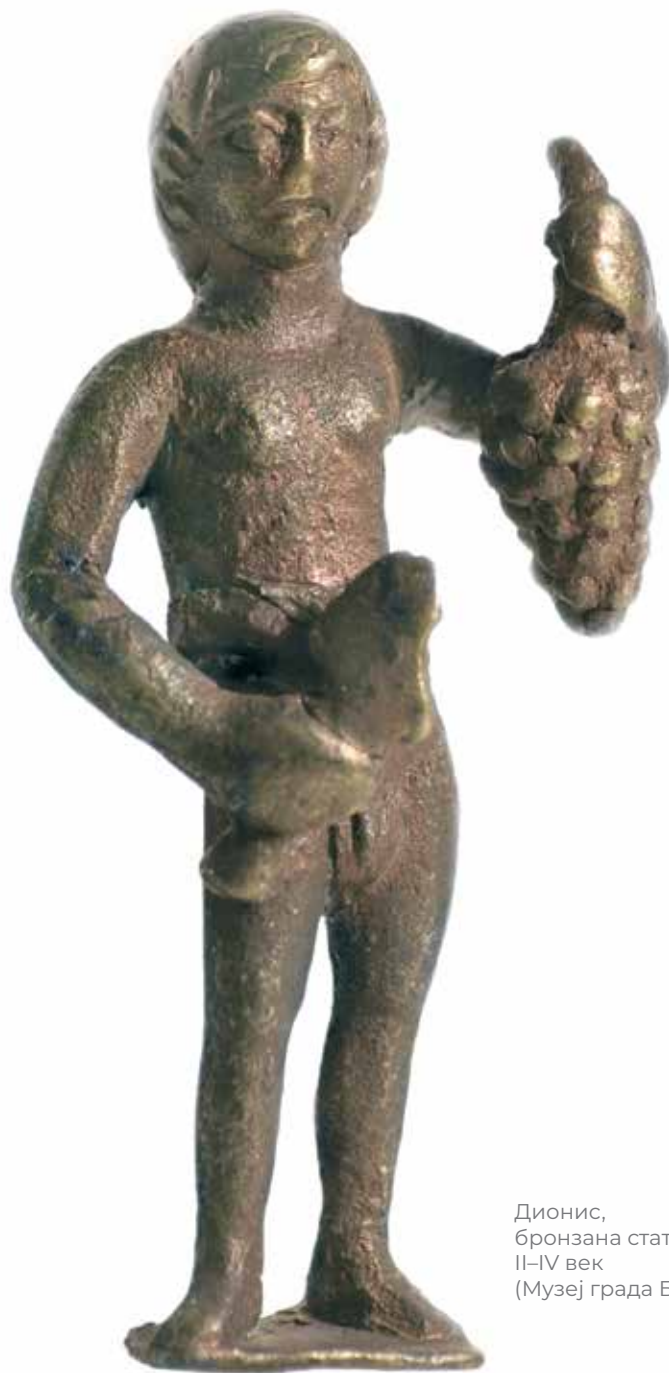
Дионис, бронзана статуета, II–IV век (Музеј града Београда)