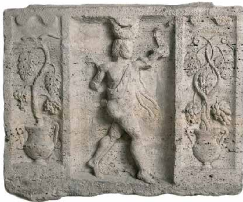
Либер и Либера, вотивна икона из Кладова, II–III век (Музеј Крајине, Неготин)