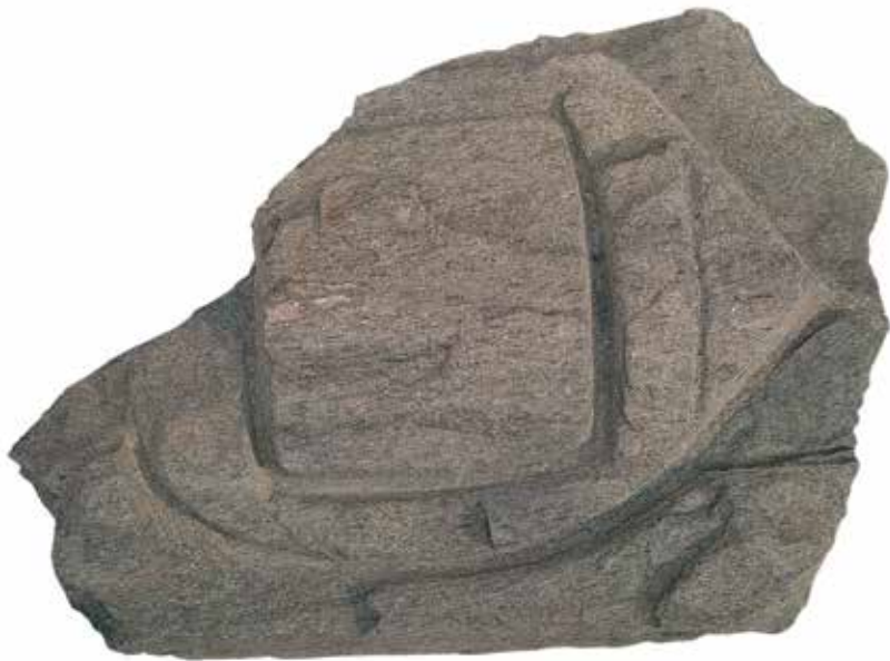
Камена постоља за пресе за цеђење грожђа из околине Лесковца, II-IV век (Народни музеј Лесковац)