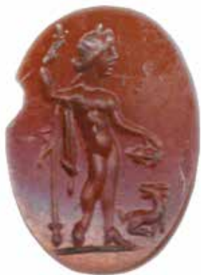
Гема од јасписа с представом Бахуса, II–III век (Народни музеј Србије)

Сачувани археолошки материјал указује на то да је вино и пре римских освајања било познато и у хеленистичким насеобинама на југу данашње Србије и у областима на истоку које су биле под трачким утицајима. По доласку првих Римљана у Подунавље током I века, становништво остварује значајнији контакт са културом вина. Током римске доминације на простору данашње Србије, посебно у II и III веку, вино се не само конзумирало већ се, како сачувани материјал показује, и производило.