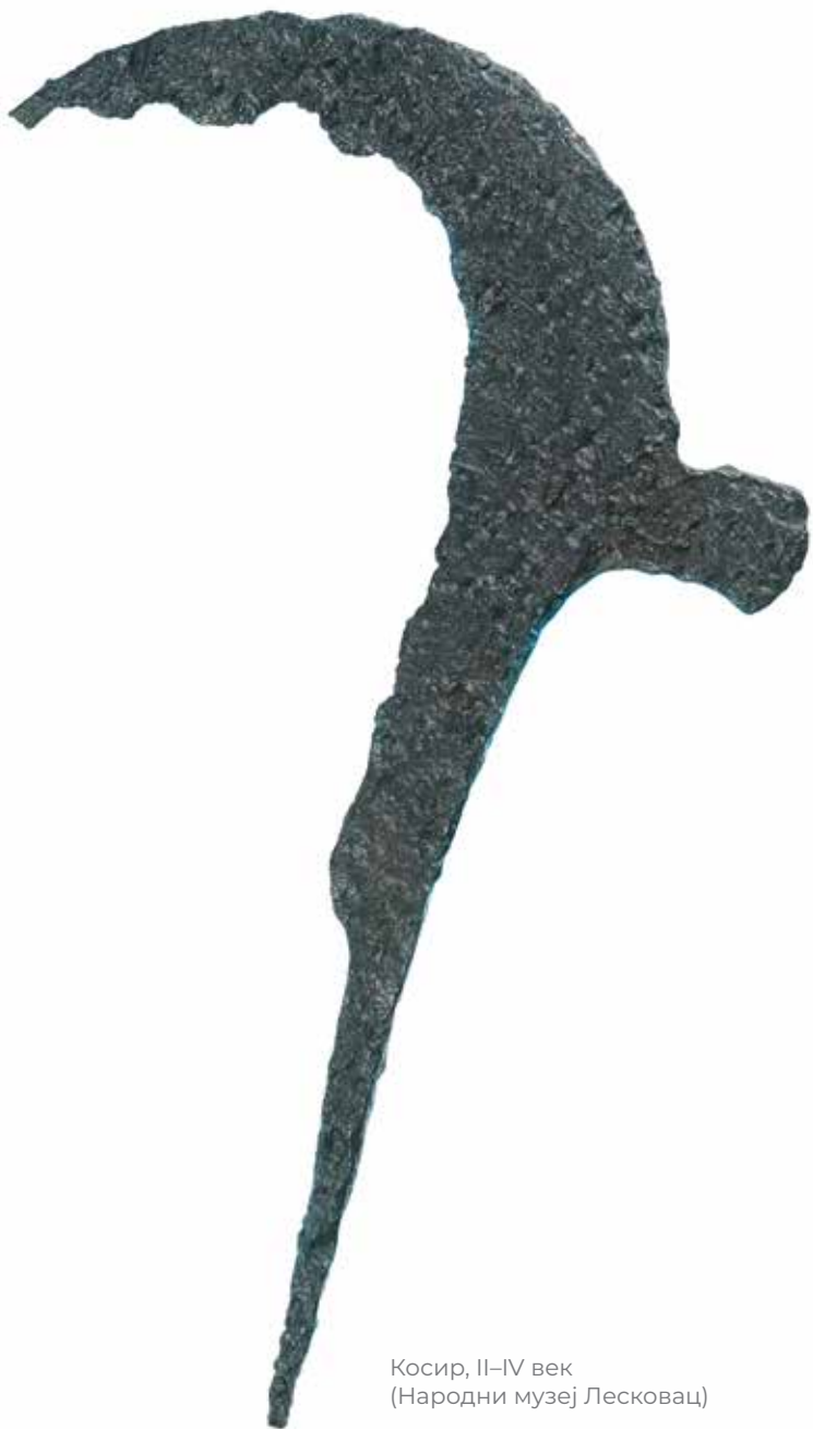
Косир, II–IV век (Народни музеј Лесковац)