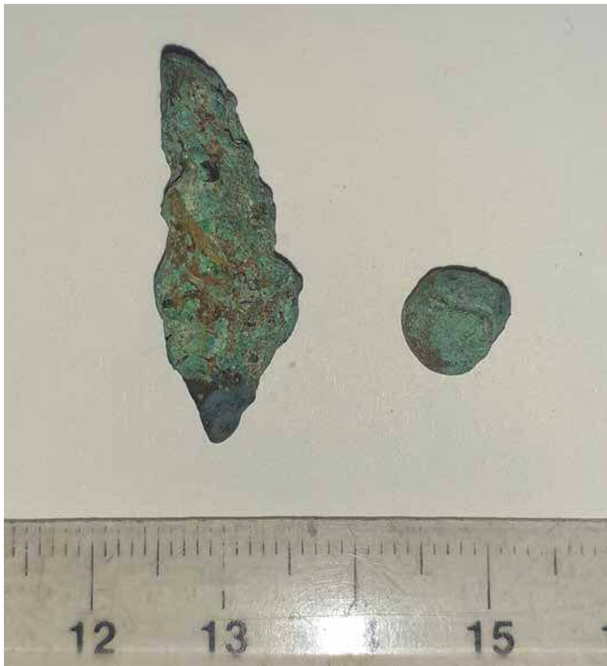
Slika 3 – Samorodni bakar iz Malog Peka.