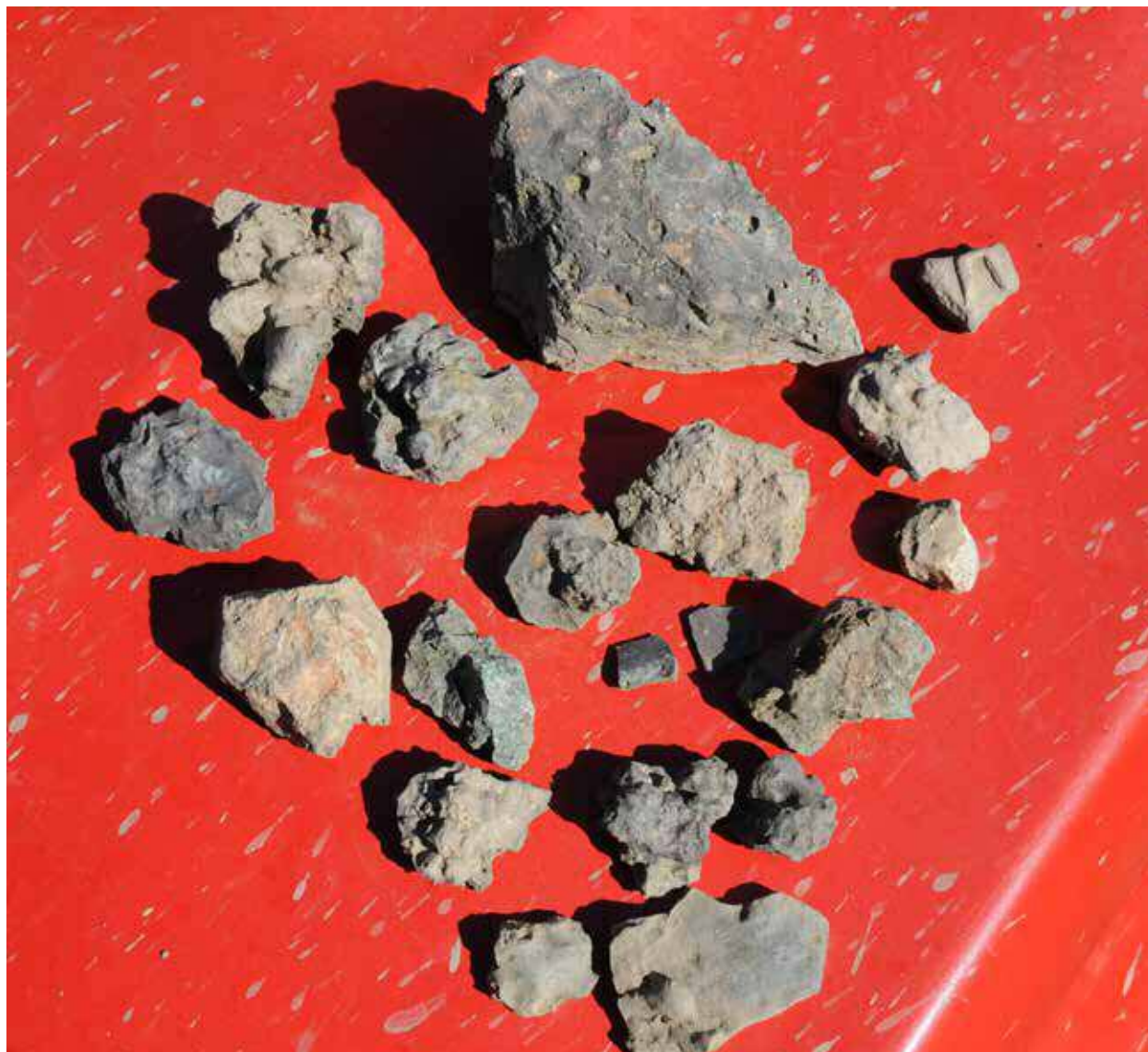
Slika 1 – Metalne šljake.

Budući da je najstariji rudnik u Boru predstavljalo brdo Tilva Roš, koje je tokom ubrzane industrijalizacije zemlje u 20. veku u potpunosti uklonjeno, prinuđeni smo da se fokusiramo na manja, i za današnje uslove nerentabilna okna u okolini Brestovačke reke (ukupno tri napuštena rudna okna) (sl. 2). Zbog mogućnosti da je ruda mogla biti dopremljena i sa lokacije Dnevni kop u Rudnoj Glavi, prikupili smo uzorke rude iz jednog okna sa ovog lokaliteta.