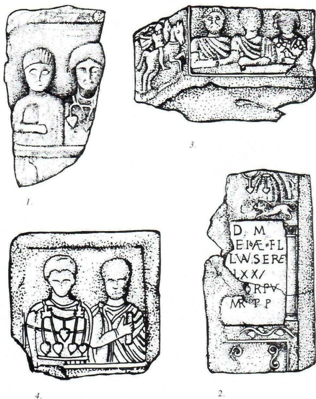
Sl. 1: Nadgrobna kocka, Voljevica; Sl. 2: nadgrobna stela, Skelani; Sl. 3: nadgrobna kocka, Crvica; Sl. 4: nadgrobna kocka, Bajina Bašta

U retke primerke nakita koji se mogu razaznati spada jedan primerak krstolike fibule iz okoline Pljevalja (Зотовић 1995, 127–128, бр. 144), i jedna zoomorfna fibula u obliku delfina na poprsju žene na frontalnoj strani kocke iz Seče Reke (Зотовић 1995, 126–127, бр. 137). Krstolika fibula je očuvana takodje na nadgrobnoj kocki, ali na poprsju muškarca. Kako je ovaj spomenik očuvan u crtežu, a takođe kako je na ovom prostoru u umetničkom izrazu karakteristično predstavljanje formi ili njihovo svodjenje na geometrijske oblike, to se ovde na crtežu ne nalaze predstave lukovica. Krstolika fibula je predstavljena jednostavno, sa dva, pod pravim uglom ukrštena pravougaonika. Uzimajući u obzir svodjenje forme na geometrijske predstave, to smo mišljenja da se radi o krstolikoj fibuli sa „zakrčljalim“ lukovicama (Petković 2010, tip 34/A). Prema tipologiji ovih