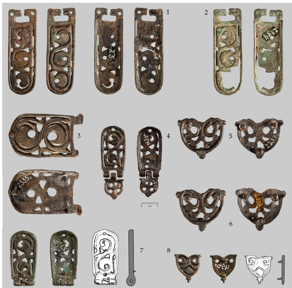
Сл. 9 Касноаварски делови појаса из Брестовика: 1–2) споредни језици; 3) оков копче; 4, 7) дводелни окови; 5–6) штитасти окови; 8) ситан појасни оков (фото: В. Илић; цртежи: И. Кајтез)