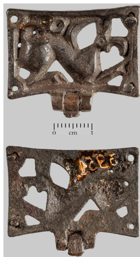
Fig. 5 Upper part of a belt mount, Zemun