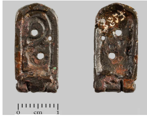
Сл. 4 Горњи елемент дводелног појасног окова, Нови Бановци