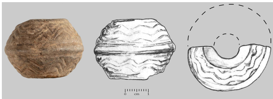
Сл. 10 Пршљенак, Сеоне (фото: В. Илић; цртежи: И. Кајтез) Fig. 10 Spindle whorl, Seone (photo: V. Plić; drawings: I. Kajtez)

изворне димензије ипак могу да се измере: висине је 2,3 cm и пречника 3,2 cm, док је пречник кружног отвора у средини 0,8 cm. Налаз је најпрепознатљивији по урезаном цикцак мотиву који краси оба конуса. На некрополи Алатијан, такви пршљенци (тип 30) приписују се најпознијој групи гробова, при чему је процењено да се гробље угасило почетком IX века (Böhme 1965: 8, 31, 35/30). На Тисафиреду се датују нешто другачије, отприлике у средишње две четвртине VIII века, а реч је о типичним налазима из позноаварских гробова особа женског пола (Garam 1995: 337, Abb. 200/2, 201, 254).