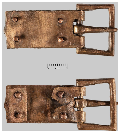
Сл. 3 Копча, Инђија