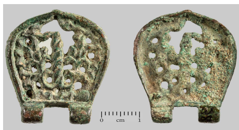
Сл. 6 Горњи елемент дводелног појасног окова, Земун