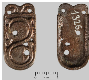
Сл. 8 Плочица споредног језичка, Ритопек Fig. 8 Small strap-end plate, Ritopek

Године 1930, Музеј је откупио из Ритопека и један неилустровани лимени језичак из VII века (Dimitrijević, Kovačević i Vinski 1962: 121). Претпостављено је да два језичка представљају гробне налазе и да потичу са две или пак с једне некрополе (Kovačević 1973: 51). Пошто нема ближих података, а временски распон између налаза је знатан, ту претпоставку треба узети с великим опрезом. Уколико су налази и били гробни, нису морали да потичу са аварских некропола. На том подручју се извесније могу очекивати усамљене сахране (Бугарски 2014: 337–338).