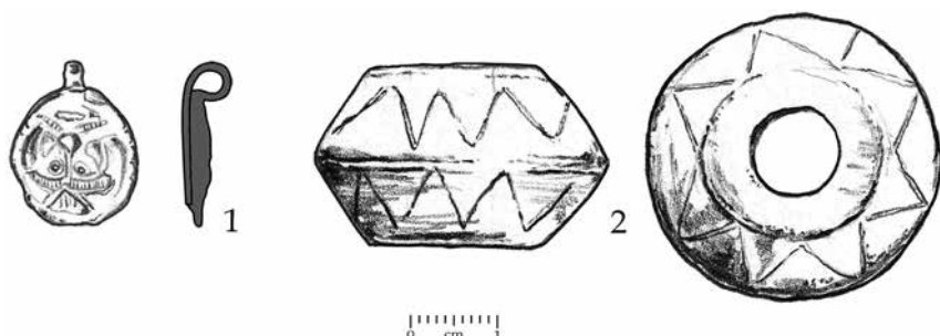
Сл. 11 Налази са непознатих локалитета: 1) привезак с представом људског лица; 2) пршљенак (цртежи: И. Кајтез)