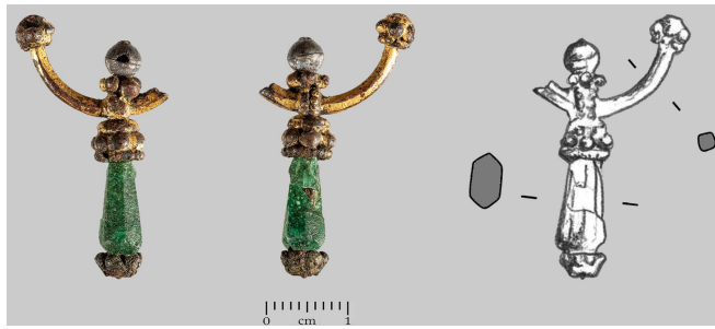
Сл. 7 Наушница, Земун (фото: В. Илић; цртеж: И. Кајтез) Fig. 7 Earring, Zemun (photo: V. Ilić; drawing I. Kajtez)