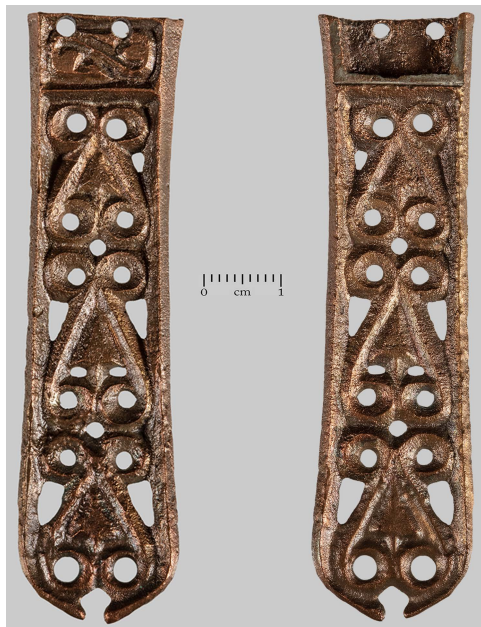
Сл. 2 Главни језичак, Инђија