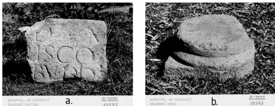
Сл. 4. Фотографије осталих елемената декоративне пластике са форума: а. део натписа на основу кога су реконструисане димензије осталих елемената пластике; б. редуцирана база пронађена на форуму.