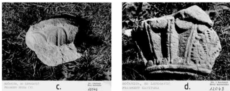
Сл. 3. Фотографије осталих капитела са простора форума: (лево) део капитела са стуба пречника 15 cm; (десно) део капитела цивилне базилике (документација РЗСК у Београду).

У фотодокументацији су забележени и други фрагменти капитела. Један од њих очигледно припада цивилној базилици јер носи све одлике капитела који су стајали на стубовима кружног пресека (Сл.3. десно). Додатно, овај капител карактерише и појава акантусовог листа на једном правоугаоном пољу (бр. картотеке: 12048), па је реч о примерку чија фотографија до сада није била објављена (на овај проблем смо указали раније: Čerškov 1970: 38; Бјелић, Савић 2020: 396). Током истраживања у квадранту Vc откривен је и један фрагмент капитела са стилизованим листићима (ДАИ: 27.6.1961), пречника око 15 cm, кога смо такође успели да идентификујемо у доступној фотодокументацији (бр. картотеке: 12046) (Сл.3. лево).