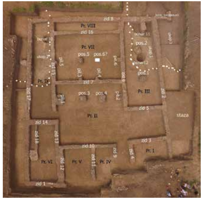
Сл. 6 Основа виле рустике (локалитет Рит, објекат 10, документација Археолошког института Београда).

На истој некрополи истражена је и једна гробна парцела ограда зидом са све четири стране (Сл. 5; Објекат 11, дим. 12,4x11,3м), док је у југозападном углу сачувана масивна платформа објекта фунерарног карактера који је вероватно представљао неку врсту маузолеја. Унутар ограђеног простора, између зидова и платформе, са три стране пружају се гробови инхумираних покојника конструисани од опеке (осам комада), два слободно укопана и старији гроб кремираног покојника који је делом оштећен гробом с конструкцијом од опеке. Гробови су правилно распоређени у низу, паралелно са зидовима и платформом, чинећи једну целину. У северном делу објекта није вршено сахрањивање; стога би се у том делу очекивао улаз у комплекс. Платформа је приближно квадратне основе (6x6,1м). Унутар платформе, приликом