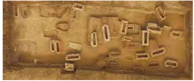
Сл. 4 Део североисточне некрополе у Риту (документација Археолошког института Београд).

Дуж оба пута која су се пружала од источне и северне капије римског логора спорадично се налазило на гробове инхумираних (150) и кремираних покојника (75). Због веће угрожености терена радовима на ПК Дрмно, у већој мери истражена је некропола уз пут који је полазио од северне капије логора и настављао према истоку, вероватно према Ледерати (Сл. 4). Издвојене су две фазе сахрањивања. Старијој припадају гробови кремираних покојника типа Мала Копашница – Сасе I и II, слободно укопани скелетно сахрањени покојници и инхумације у дрвеним ковчезима чији су сачувани гвоздени клинови правилно распоређени око скелета. Гробови овог периода временски припадају 2. и самом почетку 3. века, изузев појединих етажних кремација које залазе и до средине 3. века. Другу, млађу фазу некрополе карактеришу гробови инхумираних покојника похрањених у конструкцијама од опеке и тегула, каменим и оловним саркофазима. Услед велике густине сахрањивања на појединим деловима некрополе гробо-