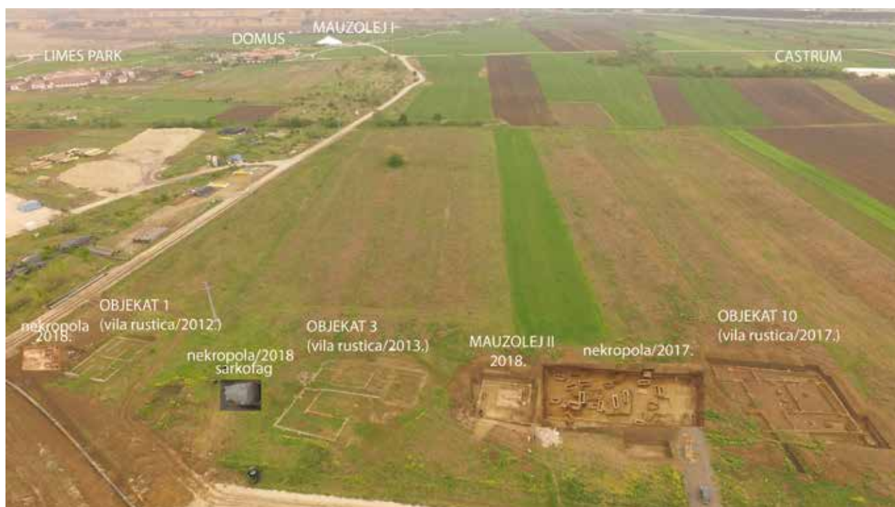
Сл. 3 Приказ виле са некрополом у Риту.

Прва заштитна археолошка истраживања северно и делом североисточно од градског језгра Виминацијума започета су 2004/2005. године на локацији Рит. Том приликом откривени су делови просторија који су приписани вили рустичи. Ископавањима су претходила геофизичка снимања у зонама где је то било могуће. 8 Након мањег прекида, пошто је овај потез предвиђен за изградњу водонепропусног екрана за потребе Повр-