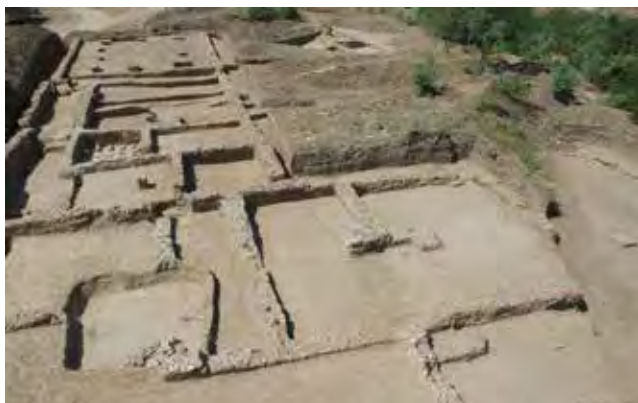
Сл. 2 Основа виле рустике (локалитет Над Клепечком, објекат 42, документација Археолошког института Београд).

источни и јужни део виле, који су били резиденцијалног карактера, и западни део виле, који су чиниле просторије економске намене. Просторије су окруживале централно двориште већих димензија – атријум. У просторијама источно и јужно од дворишта нађени су остаци малтерних подница и подног грејања (хипокауст). У једном делу обрушеног зида откривени су остаци тубулуса везаних малтером, који сведоче и о зидном загревању делова виле. Југозападно од централног дворишта нађени су остаци девет база стубова који су чинили двори-