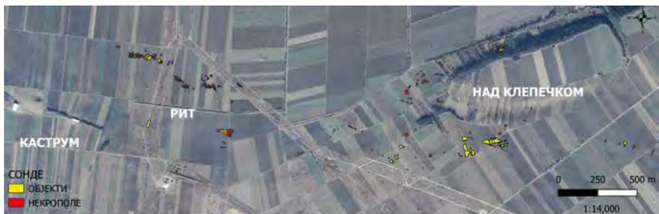
ЛОКАЛИТЕТ ВИМИНАЦИЈУМ - ЗАШТИТНА АРХЕОЛОШКА ИСТРАЖИВАЊА (РИТ, НАД КЛЕПЕЧКОМ)

да истражени су остаци две некрополе с инхумираним и кремираним покојницима, приградско насеље, као и две издвојене виле рустике. 2 Уочено је да су некрополе и објекти груписани око античке комуникације која је од Виминацијума водила ка истоку. Једна од некропола простира се западно а друга источно од насеља. Налазиле су се на удаљености 150–200м северно и северозападно од Објекта 39 (виле рустике). Гробови су били груписани с обе стране античког пута. Укупно су истражена 94 гроба инхумираних покојника, сахрањених у гробне конструкције од опеке ређане хоризонтално или насатице; у два случаја покојници су били положени на под од опеке, док су два примерка слободно укопана. Остаци кремираних покојника (111 примерака) били су положени у етажне гробове са црвено запеченим зидовима, који припадају типу Мала Копашница – Сасе II. Поједини гробови имали су доњи етаж конструисан од опеке. 3 Занимљивост наведених некропола представљају посебне фунерарне целине, односно ограђене парцеле, констатоване у осам случајева. 4 Овом типу фунерарне архитектуре, одраније познатом у Виминацијуму, у једноставнијој форми припадају примерци