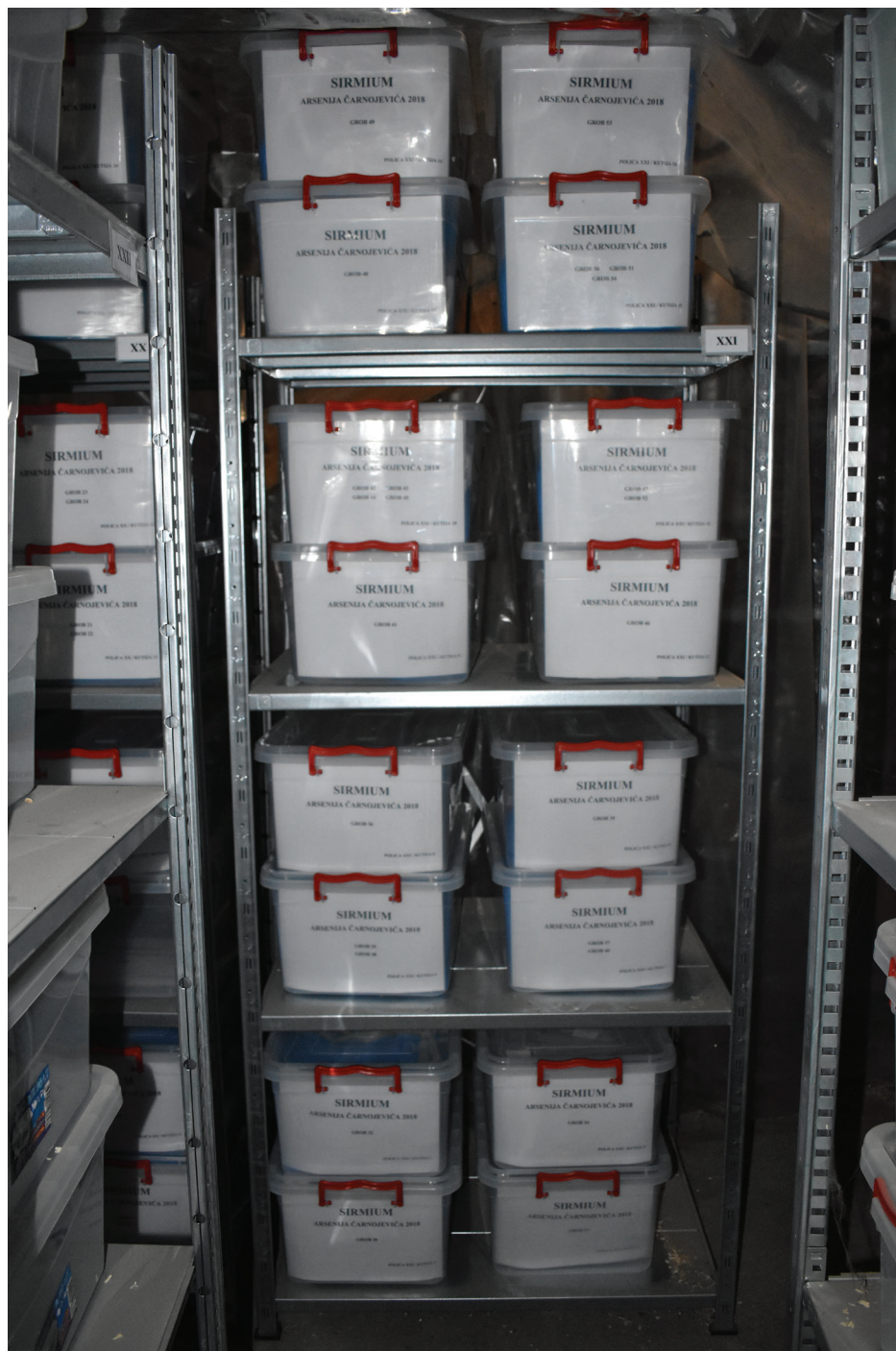
Slika 4 – Osteološki materijal smešten u kutije i postavljen u natkrivene police.