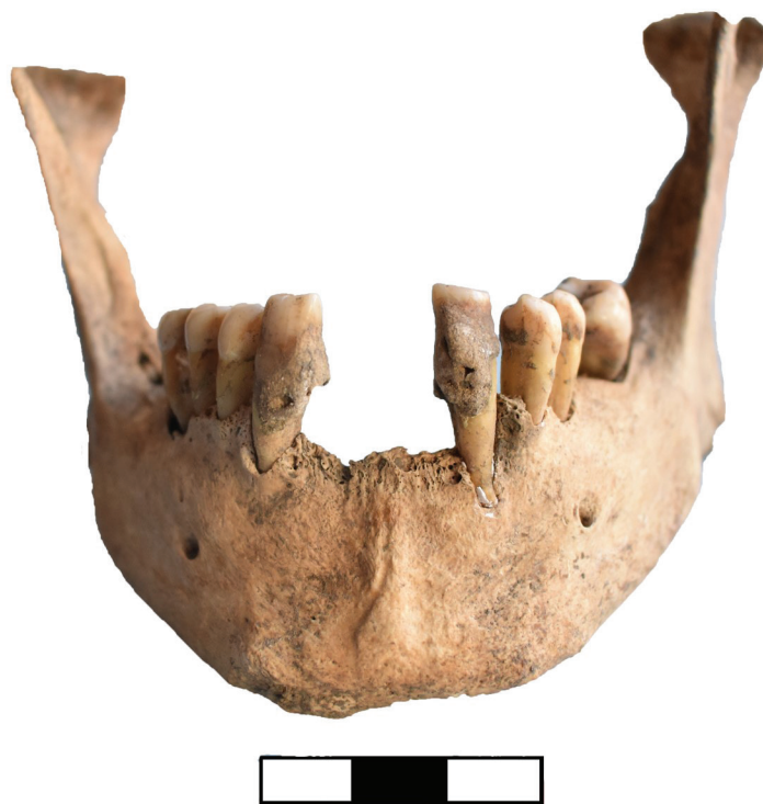
Slika 2 – Kamenac i zaživotni gubitak zuba, lokalitet Arsenija Čarnojevića 5–7, KR1985/1, Grob 21.

kost, kosti šaka, kosti stopala, i kosti gornjih i donjih udova). Na svakoj kesi je stajala oznaka sa sledećim podacima: Sirmijum, Oznaka lokaliteta, Broj ili oznaka groba, naziv grupe kostiju. Takođe, od onih individua kod kojih je to bilo moguće, izdvojili smo pojedine kosti, kao uzorke za buduće hemijske i molekularnobiološke analize. Nakon toga, sve pojedinačno spremljene grupe kostiju jedne individue stavljane su u jednu veću kesu koja je, takođe, propisno obeležena: Sirmijum, Oznaka lokaliteta, Broj ili oznaka groba, a koja je dalje odložena u odgovarajuću plastičnu kutiju propisno obeleženu: Sirmijum, Oznaka lokaliteta, Broj ili oznaka groba, Broj police i Broj kutije. Podaci na kutijama u kojima je smešten humani osteološki materijal za period 16–17. veka odštampani su na belim papirima, koje smo plastificirali i ubacili u kutije (sl. 3–5). Kutije u koje je smešten osteološki materijal, kao i police na koje su stavljene kutije su obezbeđene prethodnim projektima koja je finansiralo Ministarstvo kulture i informisanja. Tamo gde je bilo potrebno, osteološki materijal je i fotografisan.