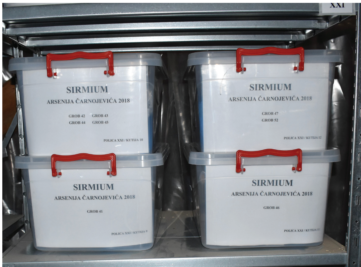
Slika 5 – Osteološki materijal smešten u kutije i postavljen u natkrivene police.

ukupno 906 inhumiranih i dve spaljene individue u Muzeju Srema. Ovaj projekat je, pored zaštite, omogućio i bolju dostupnost humanog osteološkog materijala za potrebe budućih istraživanja i prezentacije, kao i formiranje antropološke zbirke važne ne samo za proučavanje stanovništva Srema u istorijskim periodima već i cele teritorije Srbije.