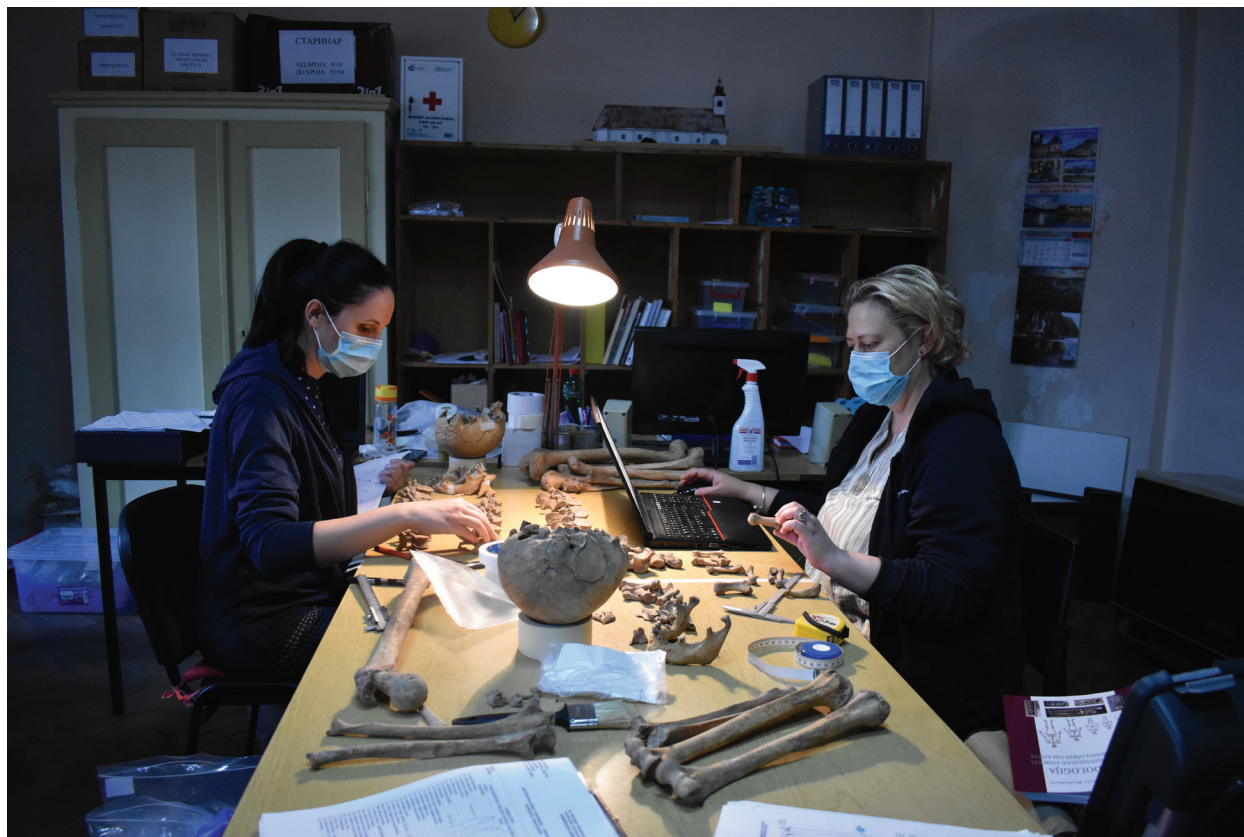
Slika 3 – Članovi stručne ekipe vrše antropološku analizu humanog osteološkog materijala i izrađuju finalnu dokumentaciju u prostorijama Muzeja Srema, u Sremskoj Mitrovici.

Treća faza obuhvatila je Izradu dokumentacije , koja je podrazumevala izradu muzejske dokumentacije. U već postojeće formulare, koji su napravljeni tokom prve godine projekta, za svaki pojedinačni skelet, odnosno za svakog pokojnika, uneseni su sledeći podaci: lokalitet na kome je materijal pronađen, broj ili oznaka groba, broj police i kutije u kojoj je sada smešten (u Muzeju Srema u Sremskoj Mitrovici), uslovi nalaza na terenu u kojima je pronađen, njegova polna pripadnost i individualna starost (odnosno, starost u trenutku smrti), telesna visina, kao i dodatne napomene ukoliko je za njih bilo potrebe.