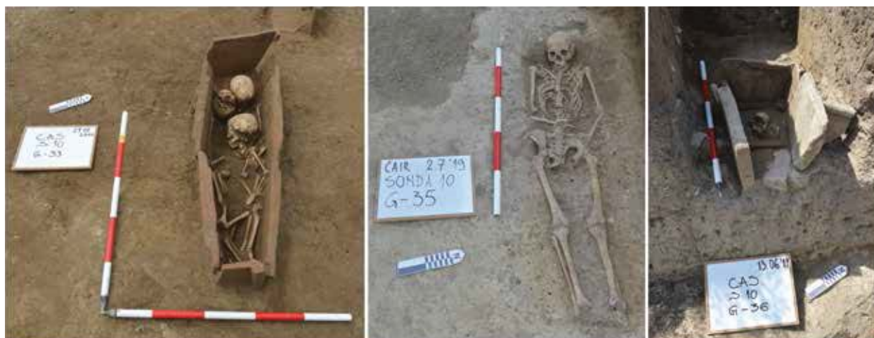
Slika 7. Grobovi.

Pored grobova koji su u rovu istraženi u ranijim kampanjama, otkriveno je još pet grobnih celina, u kojima je bilo skeletno sahranjeno sedam individua (sl.7). U četiri groba sa konstrukcijama od opeka, sahranjena su deca, među kojima su dva novorođenčeta. Izdvaja se grob sa konstrukcijom od opeka u kome su bila sahranjena tri deteta. Jedini grob koji pripada odrasloj osobi bio je slobodno ukopan i imao je pokrivač od tegula. Među novootkrivenim grobovima dva groba novorođenčeta su nađena uz sam bedem, jedan dečji grob je iznad zapadne strane rova, dok su se tri nalazila u samom rovu – na njegovoj istočnoj strani.