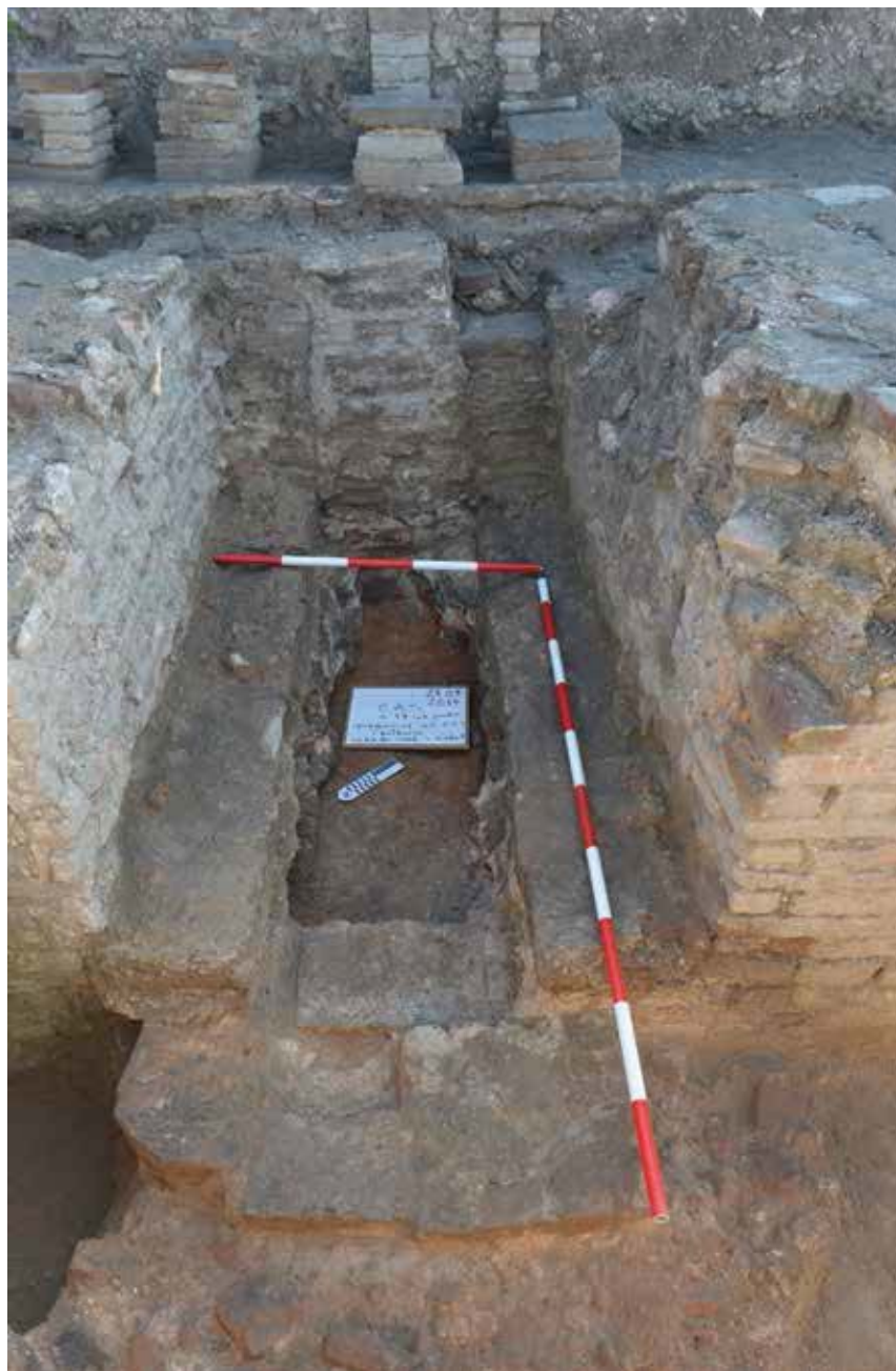
Slika 5. Terme – prefurnijum.