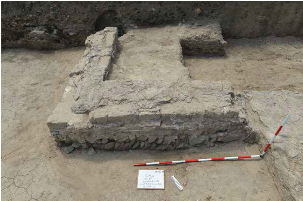
Slika 3. Objekat uz jugoistočni ugao zapadne kapije.

LEGVIICL. Kanal je dosadašnjim istraživanjima ispraćen u dužini od preko 50 m; njegova spoljna širina iznosi do 1,40 m, a unutrašnja 0,50/0,70 m. Pokrivač kanala nije otkriven, osim kamenog bloka koji je predstavljao slivnik na središnjem delu segmenta uz ulicu. Slivnik je dimenzija 0,80 m x 0,60 m x 0,20 m, sa otvorima koji formiraju rozetu – oko