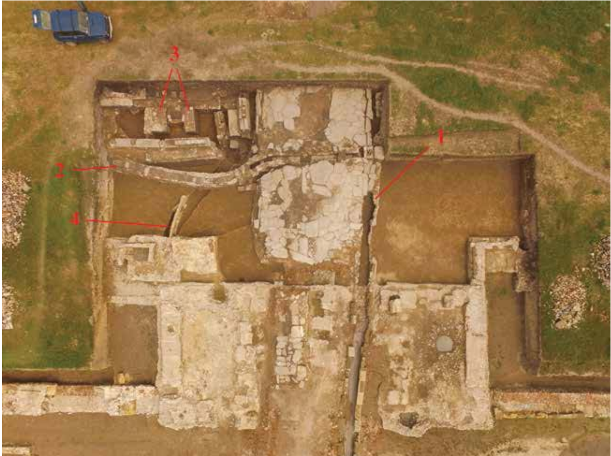
Slika 1. Situacija u zoni zapadne kapije logora: 1) kanal E-E, 2) kanal I-I, 3) zidovi zapadno od termi, 4) kanal G-G.

jenog šuta od opeka – kasnoantičke komunikacije, otkriven je nastavak ulice koja se od zapadne kapije pružala ka istoku, kroz logor, kao i kanala uz njenu južnu stranu (Nikolić et al. 2021).