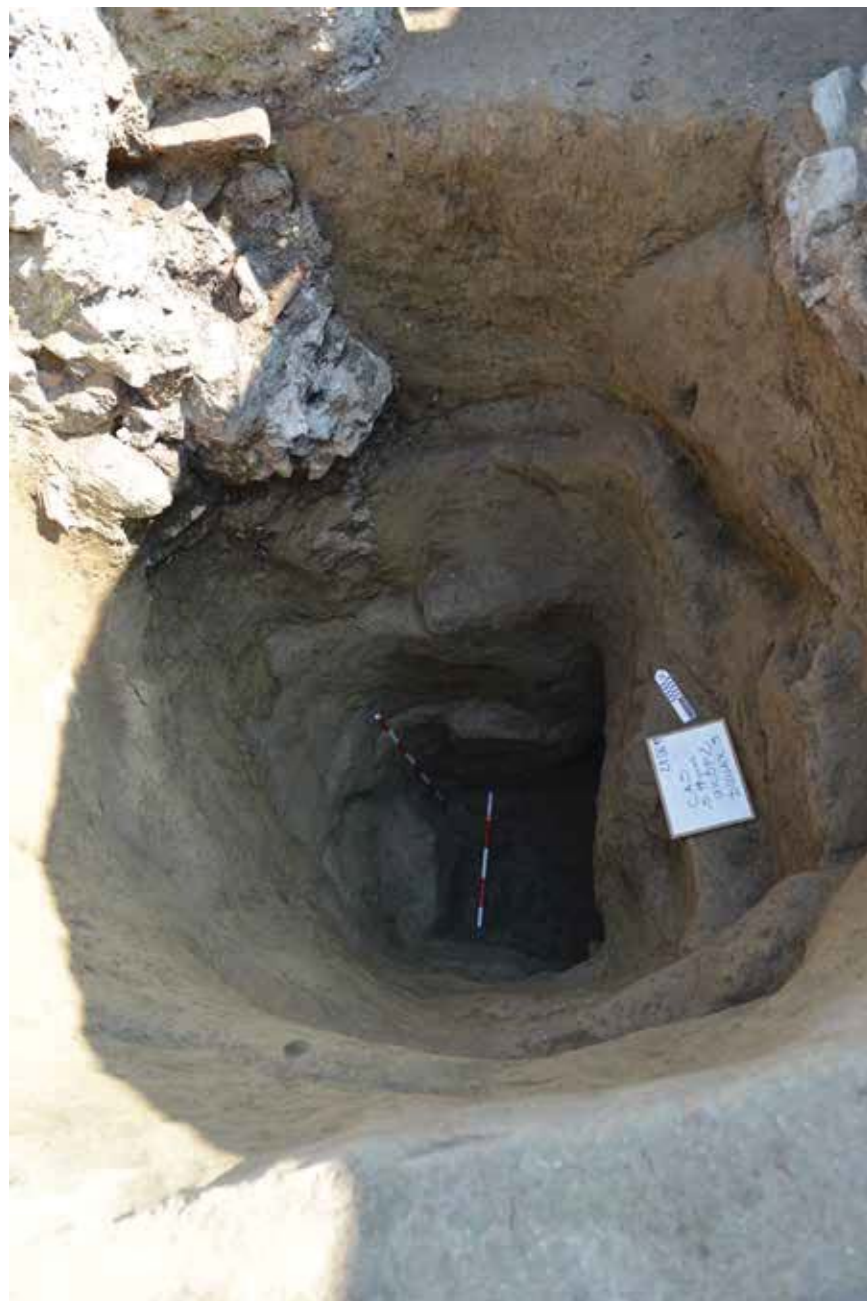
Slika 6. Bunar.