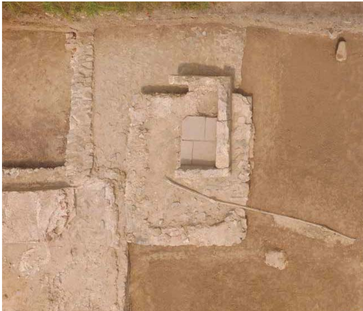
Slika 2. Površina od lomljenog škrljca vezanog malterom, platforma i česma.

temeljne zone južnog zida, te nije poznato kako je građen u ovom delu (sl.1–1). Ranije istraženi delovi kanala, uz komunikaciju koja je vodila ka gradu, građeni su od blokova krečnjaka i škrljca vezanog malterom. Uz ulicu nije sačuvano dno kanala, te nije poznato da li je i u ovom delu, poput dna u zapadnom segmentu, bio popločan tegulama sa pečatom