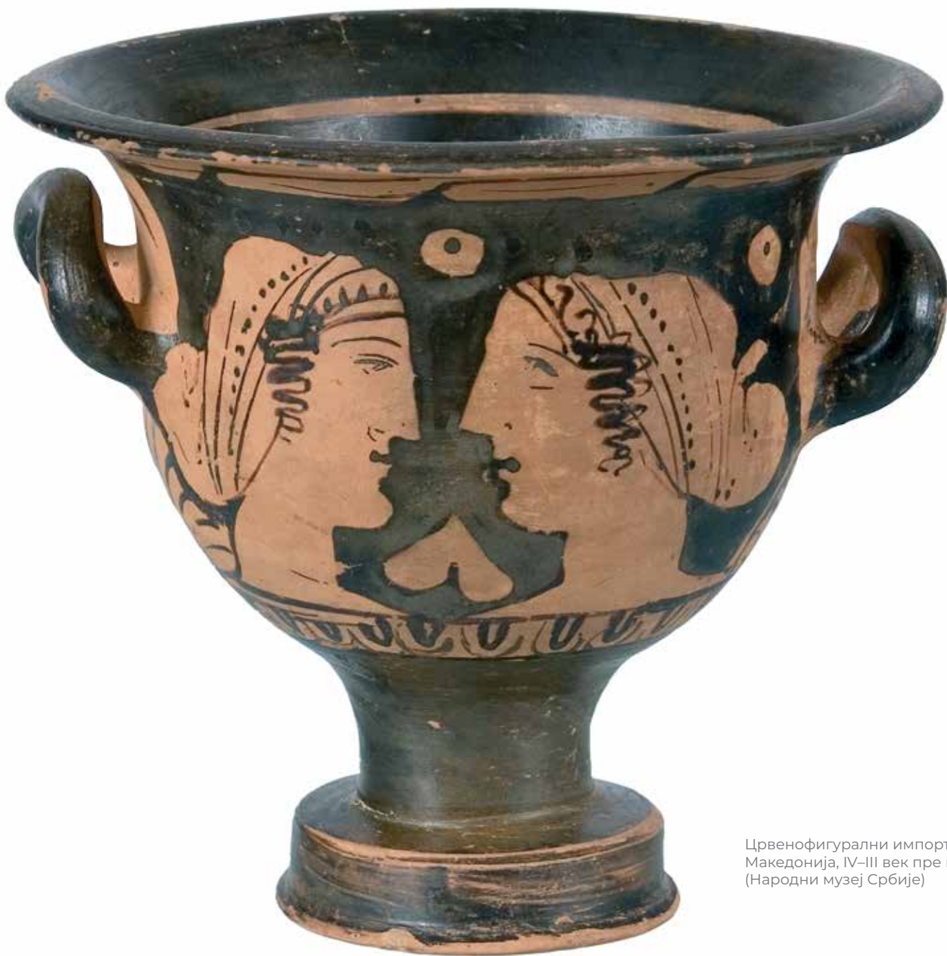
Црвенофигурални импортовани кратер, Македонија, IV–III век пре н. е. (Народни музеј Србије)