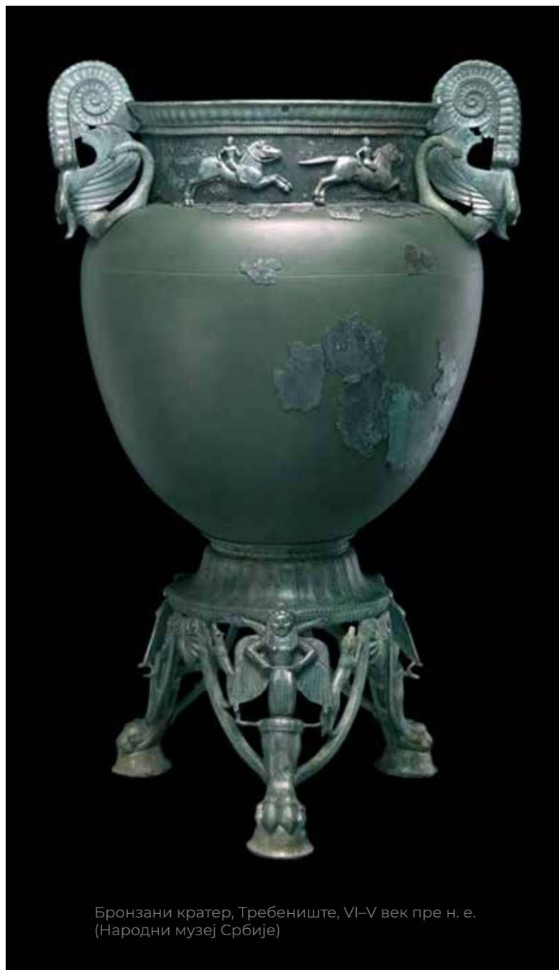
Бронзани кратер, Требениште, VI–V век пре н. е. (Народни музеј Србије)

Многи други импортовани предмети из овог „пакета“ такође се повезују с конзумирањем вина. Свакако најупечатљивије јесу бронзане посуде, често великих димензија и запремине од више десетина или чак стотина литара, које прате други метални предмети (цедиљке, фијале итд.), а служиле су за сервирање вина већем броју учесника забава. Такве посуде, најчешће кратери, често се срећу у богатим, тзв. принчевским или кнежевским, гробовима широм континенталне Европе током старијег гвозденог доба. Најпознатији примерци пронађени у континенталним пределима Балкана јесу два кратера из Требеништа, места у непосредној околини Охрида у Северној Македонији. Уз њих су нађени многи други предмети који сви заједно чине тзв. сетове за