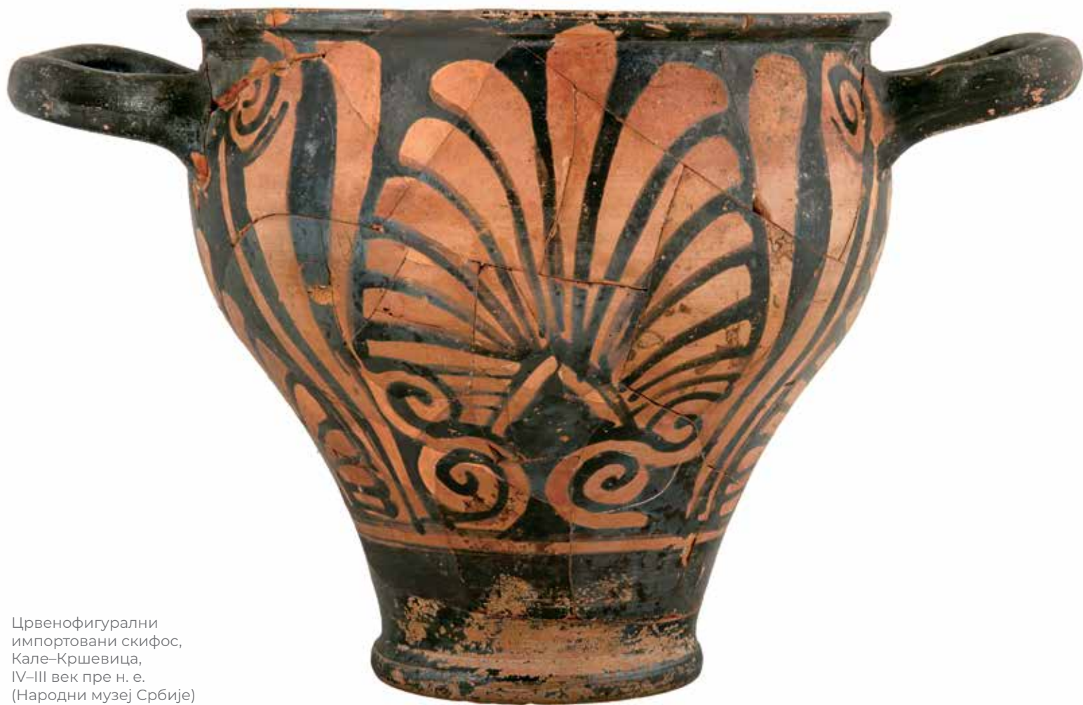
Црвенофигурални импортовани скифос, Кале-Кршевица, IV-III век пре н. е. (Народни музеј Србије)