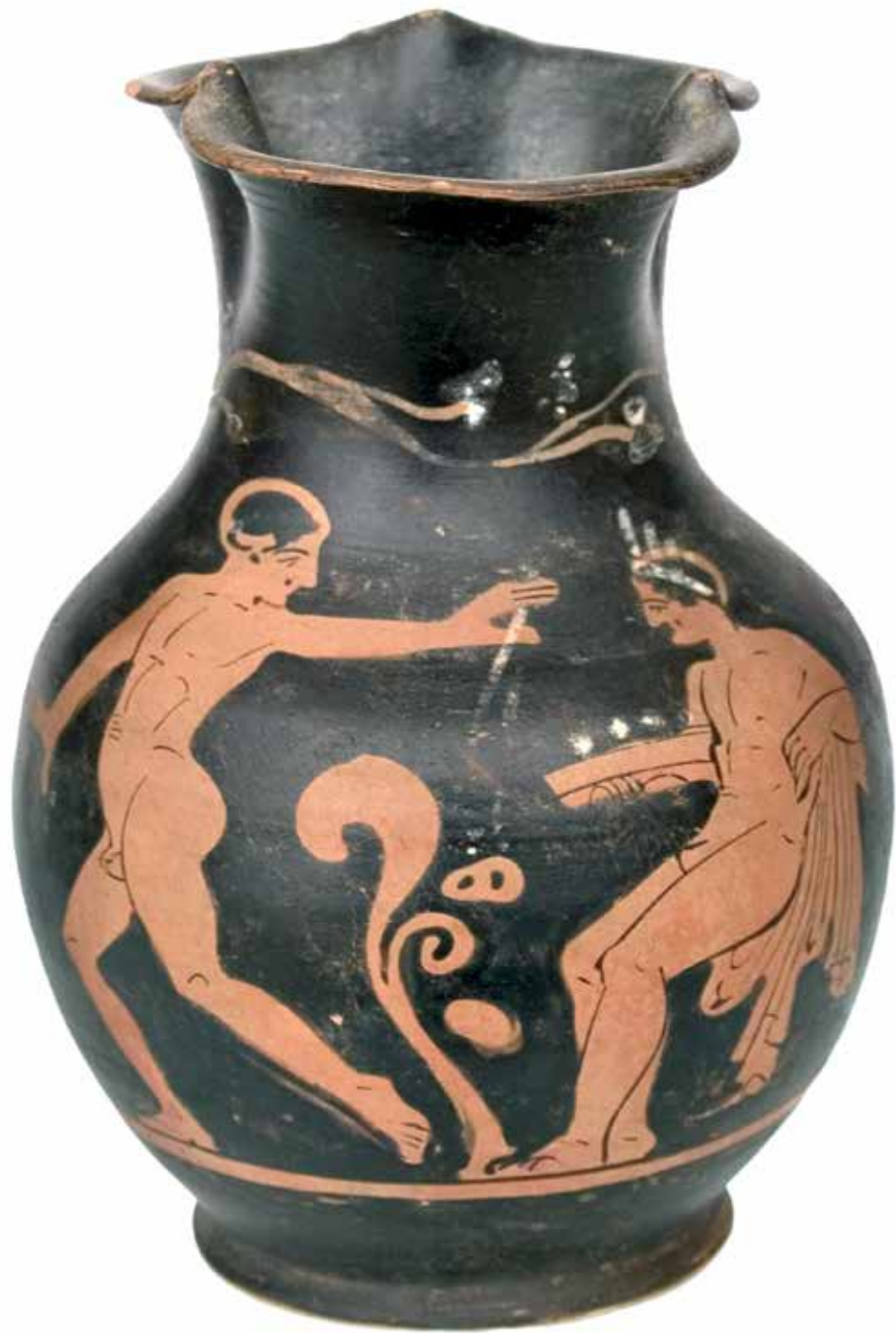
Црвенофигурална импортована ојноха, Македонија, IV–III век пре н. е. (Народни музеј Србије)