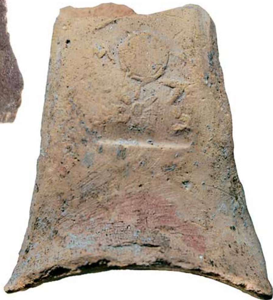
Печати са тасоских транспортних амфора, Кале-Кршевица, IV век пре н. е. (Народни музеј Србије)