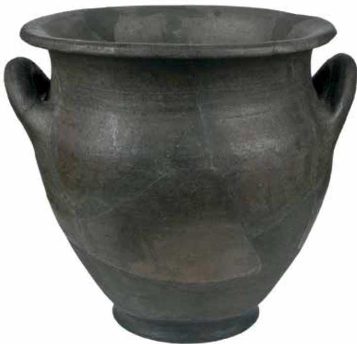
Локална сива хеленизована керамика: скифос, кантароси и кратер, Кале-Кршевица, IV–III век пре н. е. (Народни музеј Србије).