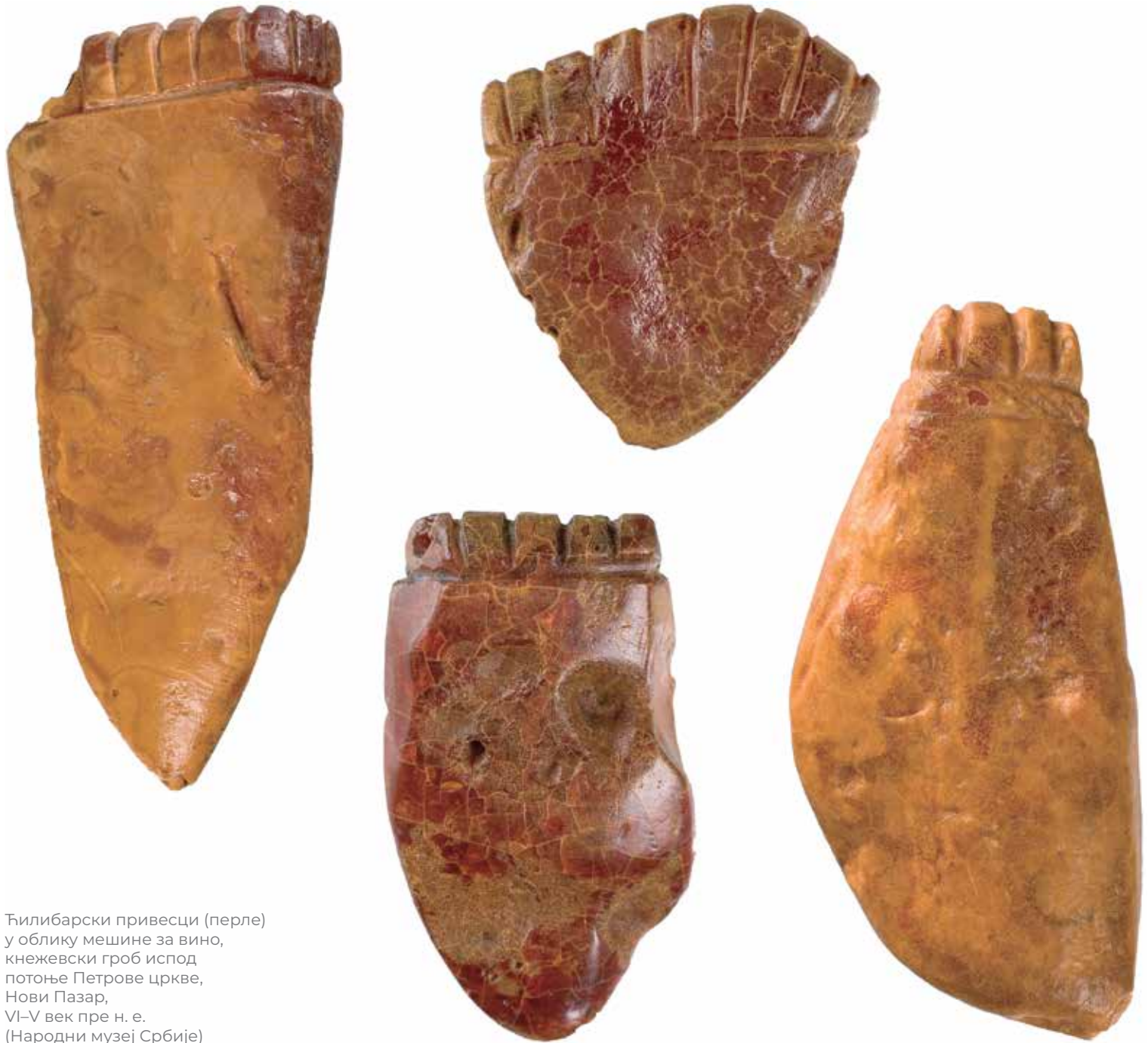
Ћилибарски привесци (перле) у облику мешине за вино, кнежевски гроб испод потоње Петрове цркве, Нови Пазар, VI-V век пре н. е. (Народни музеј Србије)