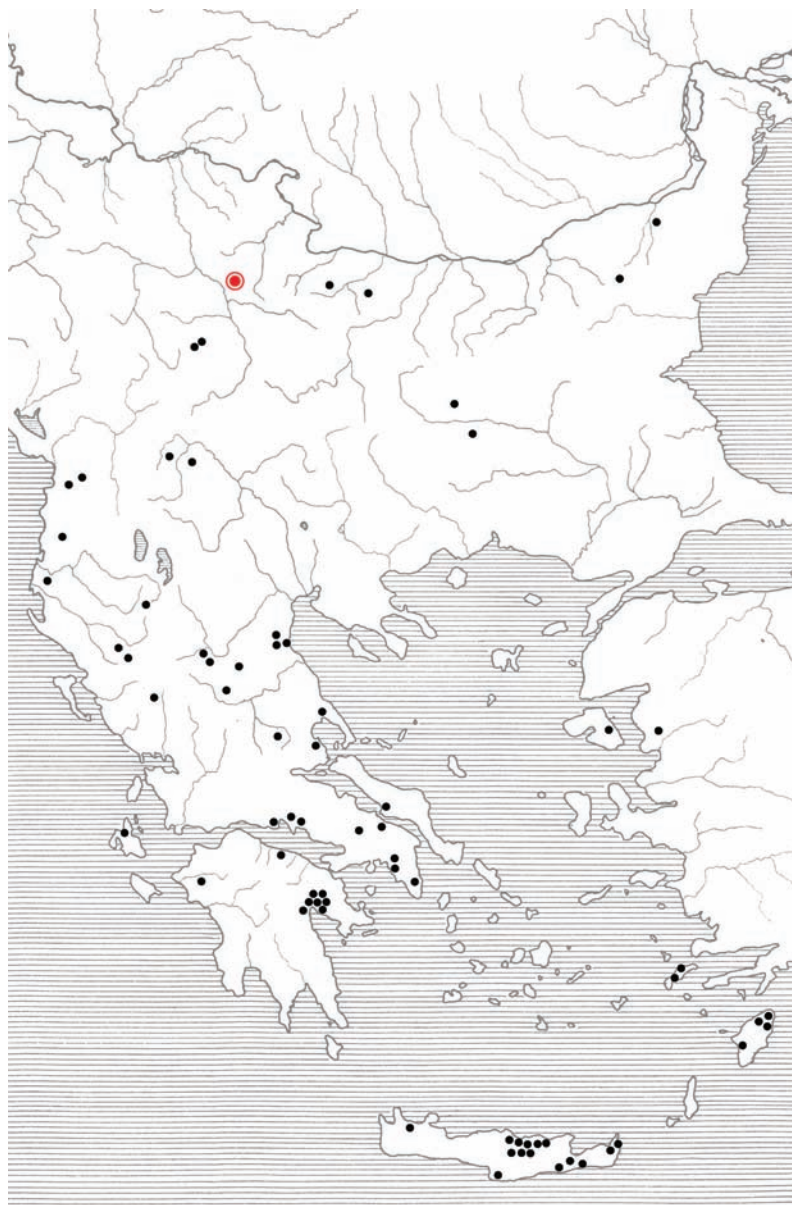
Сл. 5. Карта шире дистрибуције рапира микенског типа, без приказа варијанти (према: Kilian-Dirlmeier 1993 и Harding 1995)