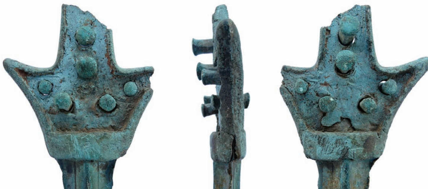
Сл. 4. Дршка, детаљ