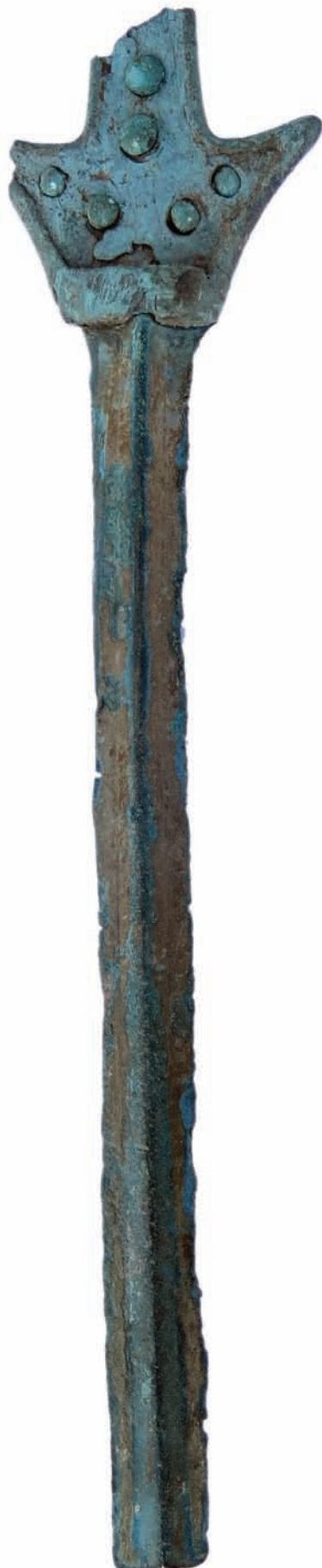
Сл. 3. Мач из Гувништа