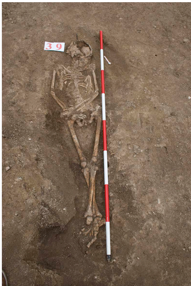
Slika 3. Slobodno ukopani pokojnik, grob G-39, pogled sa severa

Figure 3. A freely buried deceased, grave G-39, view from the north