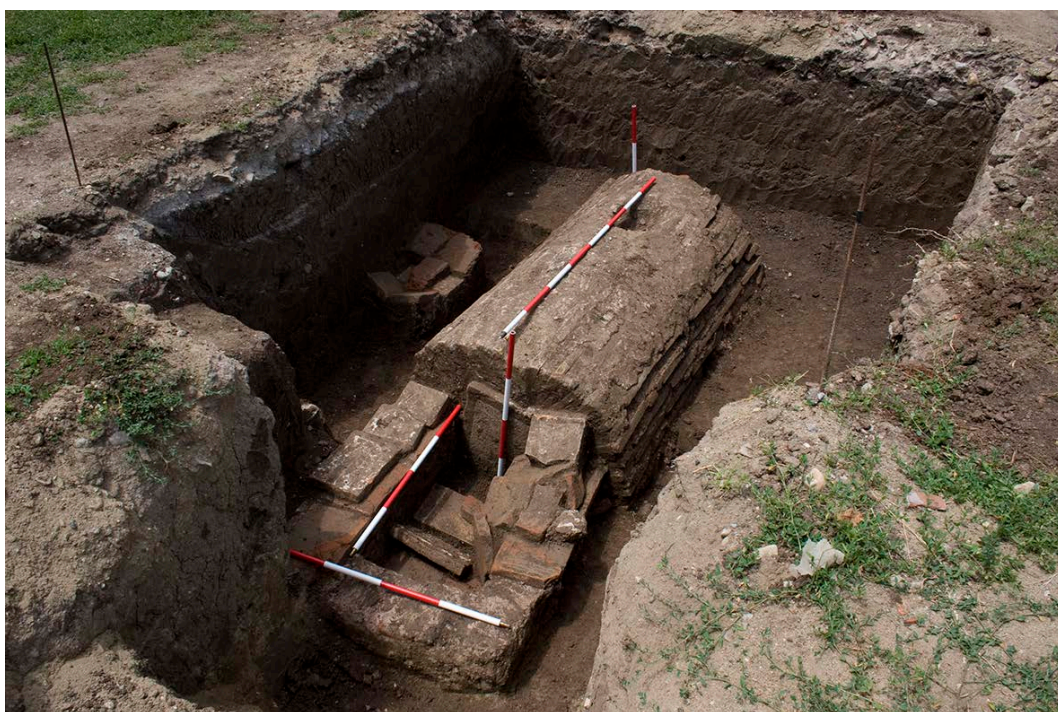
Slika 10. Grobnica II/38, pre otvaranja, pogled sa istoka

Figure 9. Tomb I/5-10, skeletons in the base, view from the east