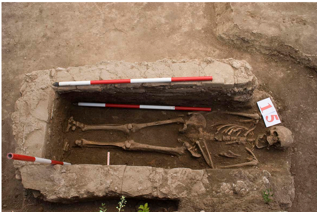
Slika 7. Zidani grob G-15, pogled sa juga