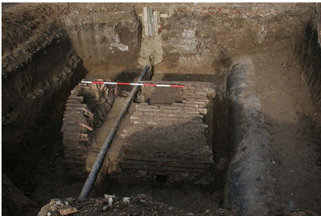
Slika 8. Grobnica I/5-10, pre otvaranja, pogled sa juga