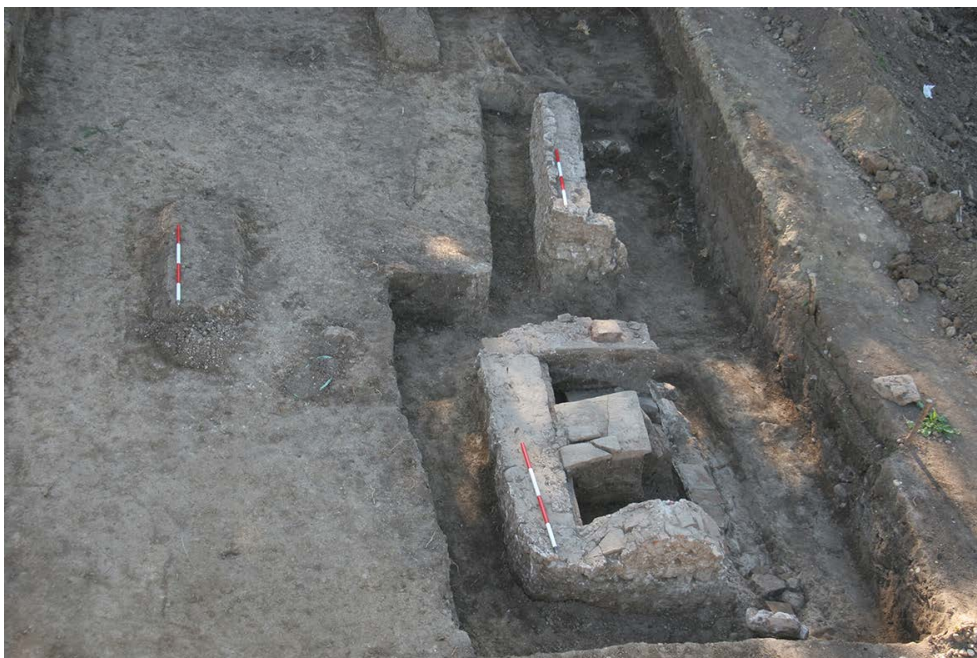
Slika 5. Zidani grobovi G-18 i G-19, pogled sa zapada

Figure 5. Built graves G-18 and G-19, view from the west