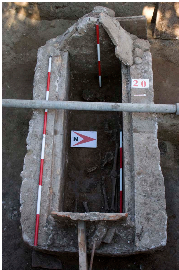
Slika 4. Zidani grob G-20, skeleti u osnovi, pogled sa istoka

Figure 3. A freely buried deceased, grave G-39, view from the north