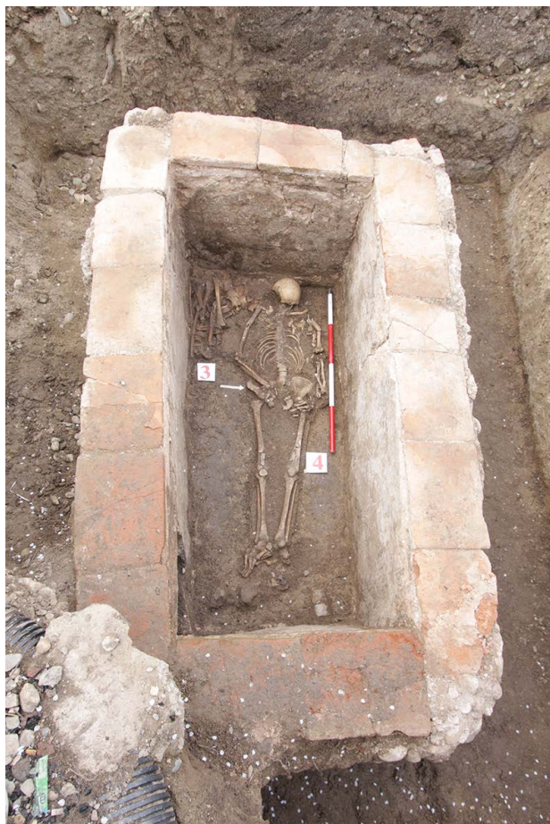
Slika 6. Zidani grob G I/3-4, pogled sa istoka

Figure 6. Built grave G I/3-4, view from the east