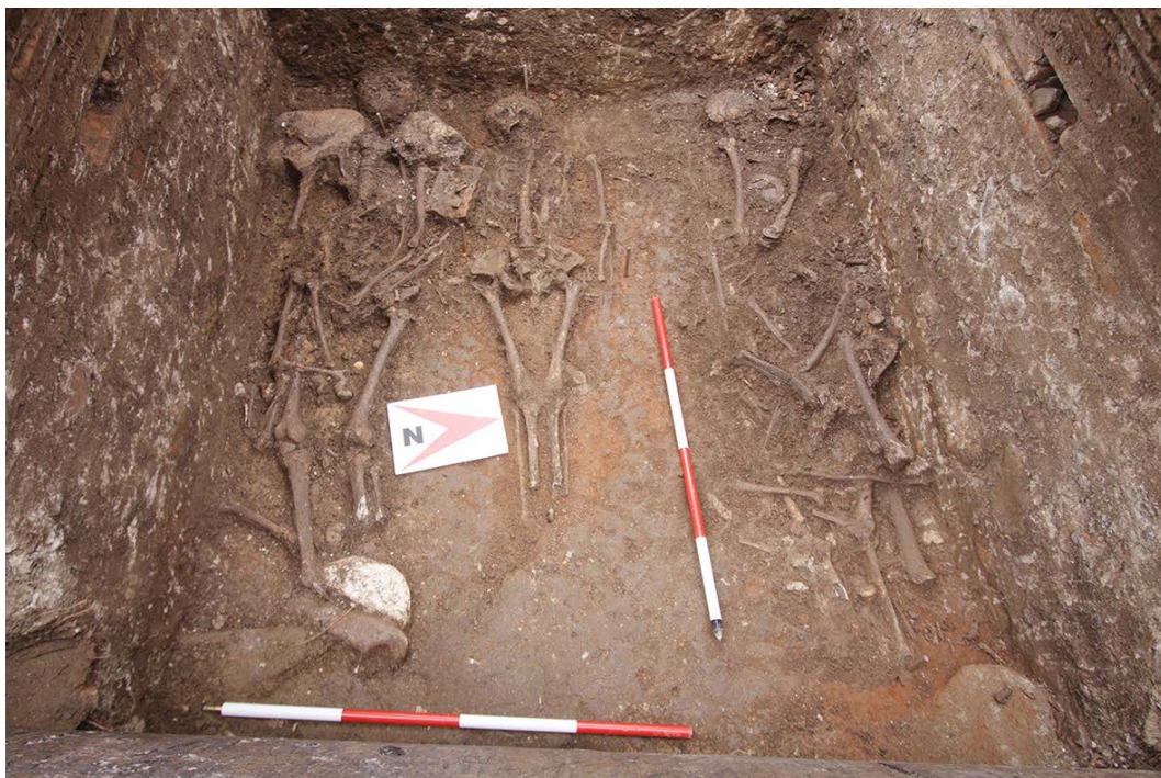
Slika 9. Grobnica I/5-10, skeleti u osnovi, pogled sa istoka

Figure 9. Tomb I/5-10, skeletons in the base, view from the east