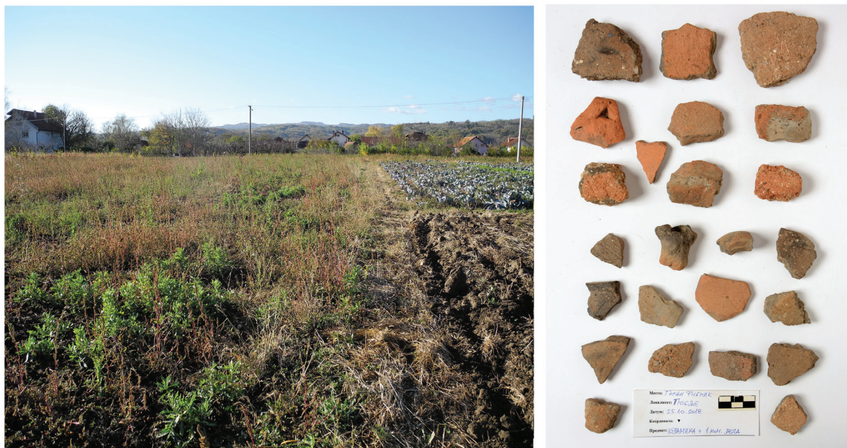
Slika 6. Gornji Ribnik – Groblje, izgled terena i keramčki nalazi.

formira rukavac ispunjen vodom. Među nalazima sa severoistočne periferije lokaliteta prevladuje poznja praistorijska keramika, uz prisustvo antičkog materijala.