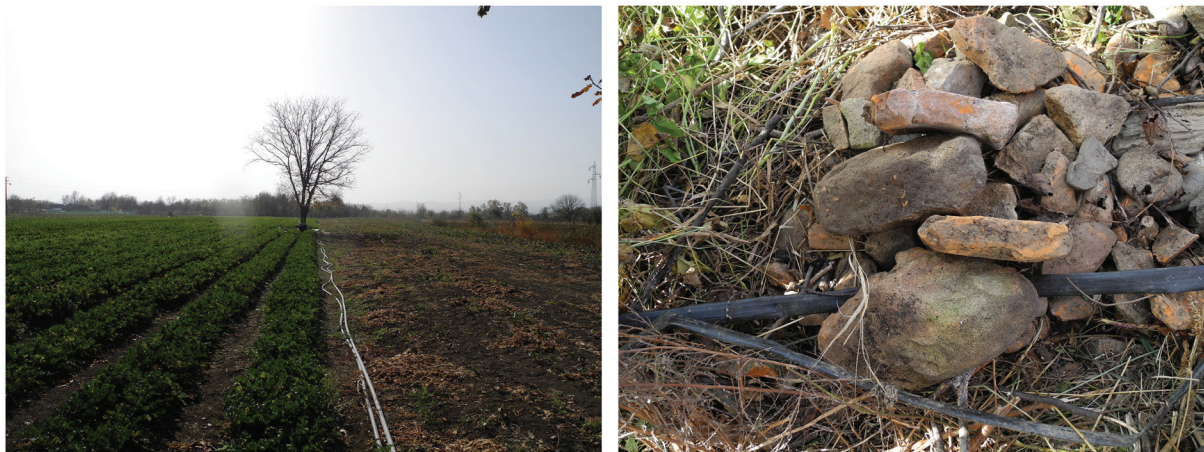
Slika 9. Panjak – Ključić – Velika Drenova, izgled terena i gomila antičkog građevinskog materijala nakon čišćenja njive.

U ataru sela Bogdanje, na potezu Divlje polje u meandru Zapadne Morave, registrovano je višeslojno nalazište na spoju više i niže rečne terase. Prikupljeni su fragmenti praistorijske, antičke i srednjovekovne keramike. Deo ruba više rečne terase istočno od Crkve Sv. Jovana, na potezu Šavran mala, ranije nije bio rekognosciran. Na osnovu malobrojnih keramičkih nalaza iz teško preglednih strnjišta i oranice, ustanovljeno je da je reč o istočnoj periferiji lokaliteta Bogdanje – Divlje Polje.