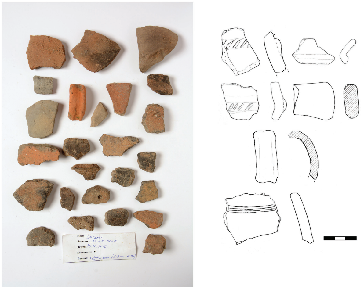
Slika 5. Keramički nalazi sa lokaliteta Bogdanje – Divlje polje.

Zona severno od groblja takođe je dala veću količinu keramike, uglavnom praistorijske.