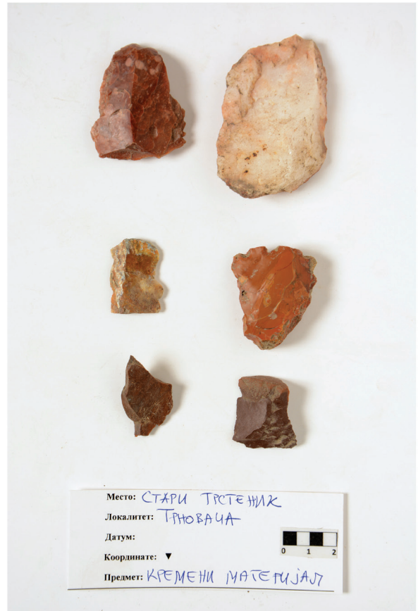
Slika 7. Stari Trstenik – Trnovača, izgled terena, keramčki nalazi i kremeni materijal.