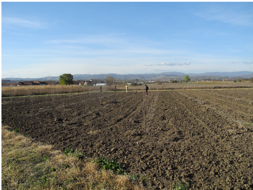
Slika 4. Obilazak lokaliteta Donja Počekovina – Riđevci – Drenovski ključ.

Svega 200 m istočno je nalazište Groblje u selu Donjem Ribniku, koje je takođe smešteno na višem, neplavljenom terenu. Parcele na samom zapadu i prema severozapadu se graniče sa desnom obalom Crnišavske reke, koja predstavlja i rub ove terase. Centralni deo lokaliteta je pod savremenim grobljem, uz koje su kuće sa istočne strane. Pored veće koncentracije keramičkih nalaza i lepa, konstatovani su i artefakti od okresanog kamena, brusevi, teg, antičke opeke i zgura. Najveći broj ulomaka grnčarije bi preliminarno mogao da se opredeli u starije gvozdeno doba, a raspoznaju se i fragmenti antičkih posuda. Uočen je i ulomak ranosrednjovekovne posude ukrašen valovnicom.