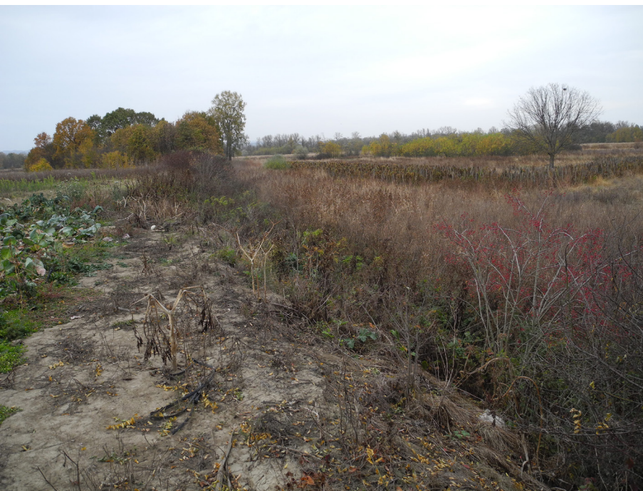
Slika 2. Spoj više terase sa plavljenim tlom na lokalitetu Stopanja – Deonice – SI rub meandra.