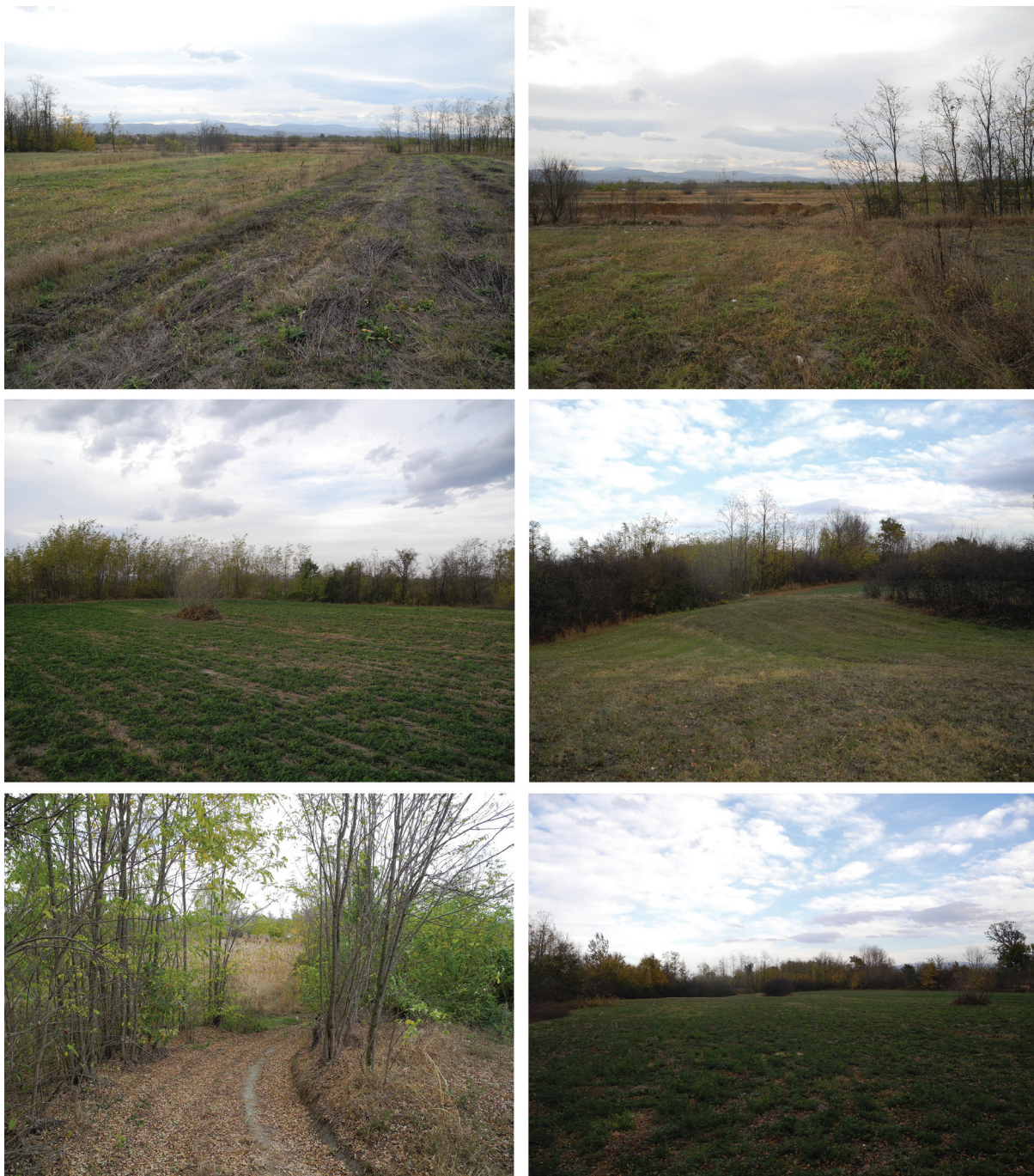
Slika 8. Stopanja – Žuti Brestovi – Sv. Roman, izgled terena.