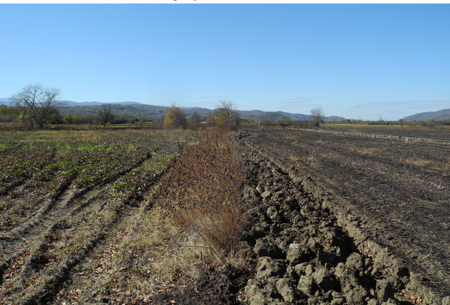
Slika 3. Pedološki pokrivač na lokalitetu Gornja Počekovina – Grabak.

Po okončanju terenskih poslova, nalazi su obrađeni i dokumentovani. Rezultati obilazaka pojedinačnih lokaliteta prikazani su u detaljnim kartonima za rekognosciranje koje propisuje Ministarstvo kulture i informisanja. Jednako su dokumentovane i lokacije koje su zadovoljile opšte kriterijume za obilazak, tj. ispunjavale osnovne geomorfološke uslovljenosti, a za koje bi se nakon obilaska ispostavilo da ne predstavljaju arheološke lokalitete. To je činjeno iz dva razloga. Najpre, njihov položaj će biti razmatran prilikom detaljne analize pogodnosti koje su uslovile podizanje naselja na drugim lokacijama. Uz to, za potrebe budućih istraživanja i projektovanje infrastrukturnih objekata ostaće precizno kartirane i detaljno opisane površine gde su izvedena rekognosciranja dala negativan rezultat. Dalje analize će se vršiti u namenski napravljenoj GIS platformi sa različitim relevantnim podlogama (fizičko-geografske, geomorfološke, geološke, pedološke i hidrološke karte). 2