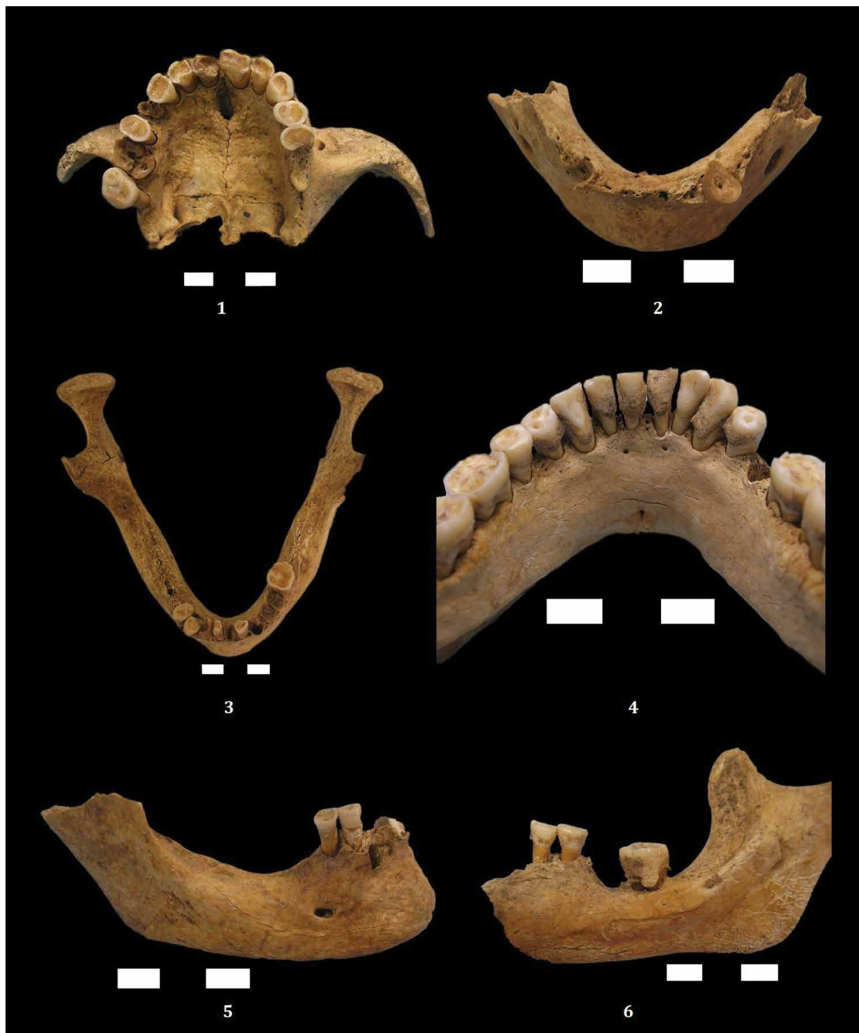
Tabla I – 1) karijes, grob 35; 2) zaživotni gubitak zuba, grob 36; 3) karijes i zaživotni gubitak zuba, grob 18; 4) kamenac, grob 28; 5) zaživotni gubitak zuba, grob 15; 6) kamenac i zaživotni gubitak zuba, grob 26 Plate 1 – 1) caries, grave 35; 2) ante mortem tooth loss, grave 36; 3) caries and ante mortem tooth loss, grave 18; 4) calculus, grave 28; 5) ante mortem tooth loss, grave 15; 6) calculus and ante mortem tooth loss, grave 26