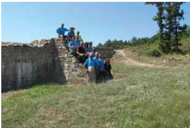
Slika 12. Arheološka ekipa i radnici, arheološka iskopavanja Vrelo – Šarkamen 2019. godine.

2,70 m, sa očuvanim spoljnim i unutrašnjim licem, između kojih je ispunjena od trpanca (lomljeni kamen zaliven krečnim betonom) (sl. 9–10).