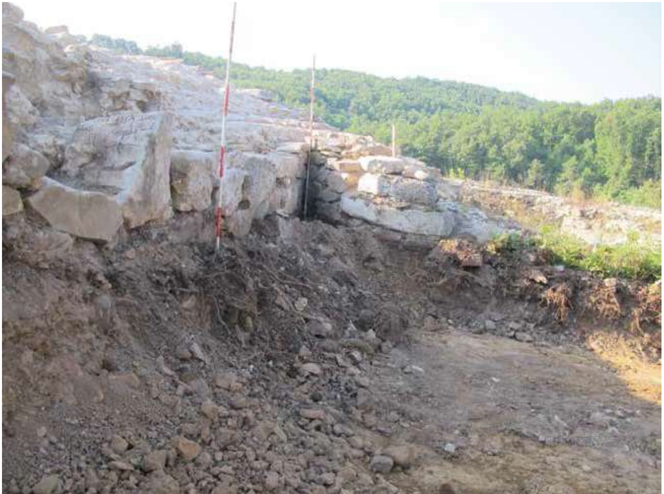
Slika 3. Spoljašnje lice zapanog bedema između zapadne kapije i kule 1, sa severozapada.

S obzirom na to da u prostorijama nisu konstatovani drugi pokretni nalazi osim fragmentovanih i celih opeka, od kojih su neke krovne tegule, teško je govoriti o njihovoj funkciji. Moguće je da izgradnja ovih prostorija nije bila završena ili da nisu nikada korištene. S druge strane, postojanje krovnih tegula ukazuje da su možda imale krovni pokrivač, odnosno da su bile u funkciji. Treba napomenuti, da se iz prostorije 2 ulazilo u koridor ulaza u kulu 2, tako da je ona služila kao predvorje severne kule zapadne kapije, koja je imala sofisticiran sistem grejanja i vodovoda (što je konstatovano iskopavanjima 2016–2018. godine) (sl. 4 b, sl. 6).