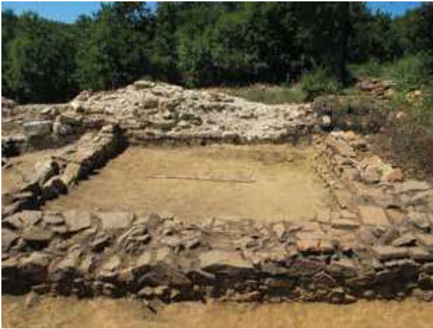
Slika 4a. Prostorija 1 uz unutrašnje lice zapadnog bedema, sa istoka.