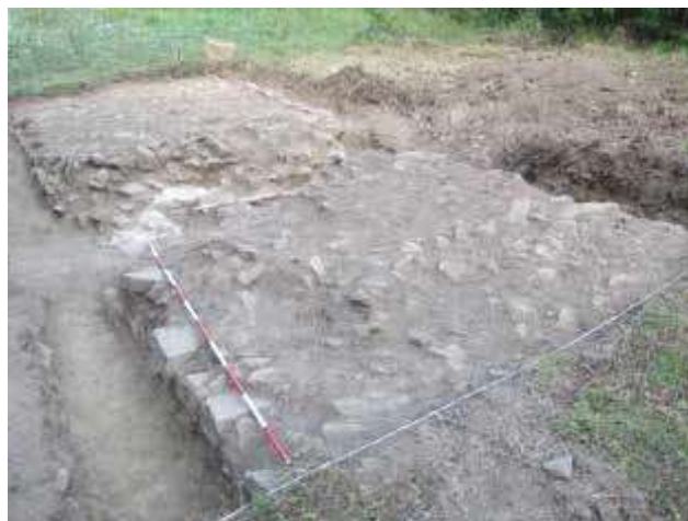
Slika 10. Deo severnog bedema u sondi 12, sa jugoistoka.