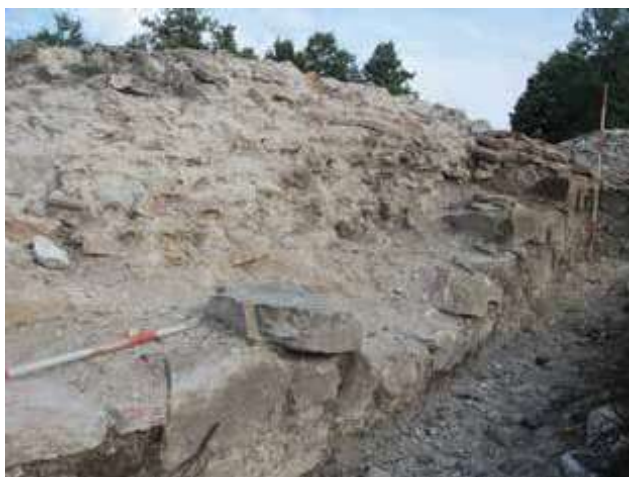
Slika 1. Unutrašnje lice zapadnog bedema između zapadne kapije i kule 1, sa jugoistoka.