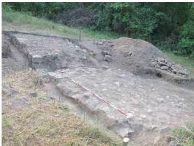
Slika 9. Deo severnog bedema u sondi 12, sa severozapada.