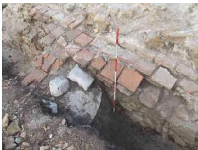
Slika 7. Zid upravan na unutrašnje lice zapadnog bedema južno od zapadne kapije (severni zid prostorije 4), sa severoistoka.