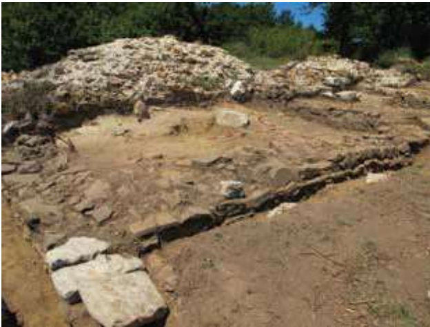
Slika 4c. Prostorija 3 uz unutrašnje lice zapadnog bedema, sa jugoistoka.