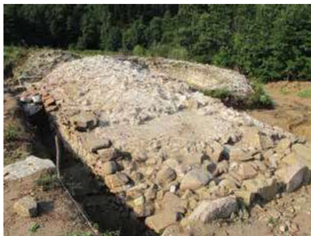
Slika 2. Kruna zapadnog bedema između zapadne kapije i kule 1, sa severoistoka

Spoj zapadnog bedema sa oktogonolnom kulom 1 je pod oštrim uglom, koji je ojačan velikim ugaonim blokovima krečnjaka, specijalno isklesanim za ojačanje ugla, na isti način kao što su izrađivani ugaoni blokovi na oktogonu kule. Takođe, spoljno lice zapadnog bedema izgrađeno je od velikih kamenih blokova, za razliku od unutrašnjeg lica (sl. 3).