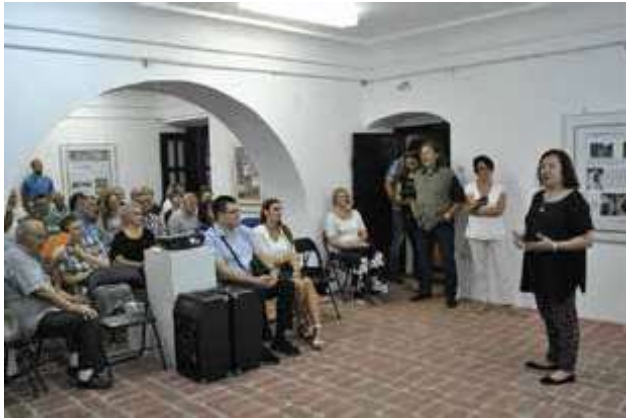
Slika 11. „Arheološko veče“, Muzej Hajduk Veljka (Todorčetov konak).

strane sa kasnoantičkim vila rustikama u Dalmaciji (Mogorjelo, Višići) (Busuladžić 2011, 149, T. 1 c–d) i Priobalnoj Dakiji (Kostol, Krivelj) (Jovanović 2004), a sa druge sa Dioklecijanovom palatom u Splitu (Marasović 1982, 17, 50), dok je koncepcija arhitektonskog