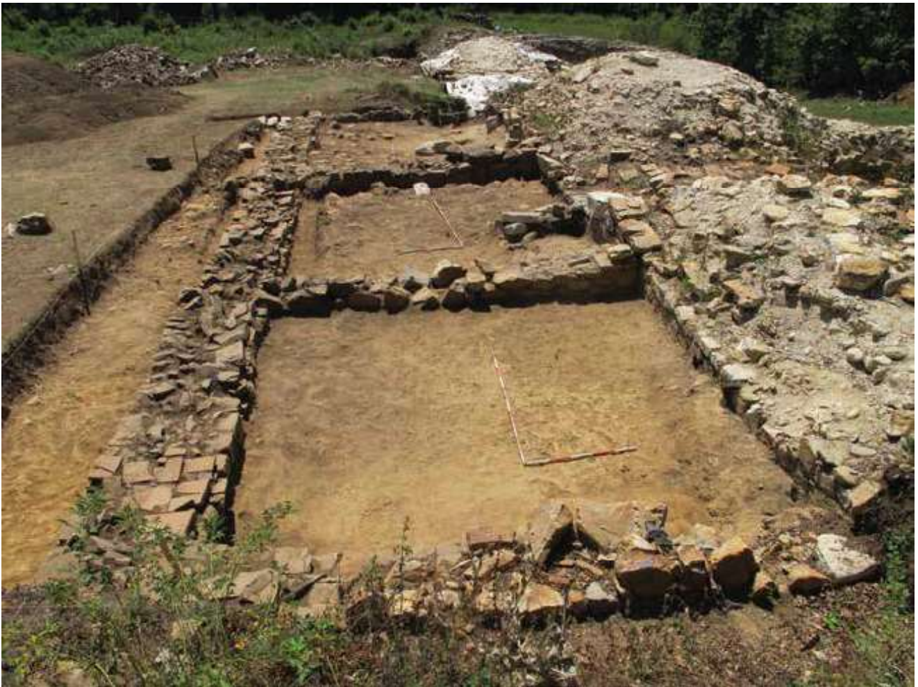
Slika 6. Prostorije 1, 2 i 3 duž unutrašnjeg lica zapadnog bedema severno od zapadne kapije, sa severa.

Na prostoru same zapadne kapije nije bilo prostorija u unutrašnjosti utvrđenja, što je i logično, ali je južno od kapije otkriven zid zidan u tehnici opus mixtum (sl. 7). Od ovog zida do zida predvorja ulaza u kulu 1 (prostorije 5) razdaljina je 5,40 m, tako da smo ovaj prostor označili kao prostorija 4, čije istraživanje tek predstoji (sl. 8).