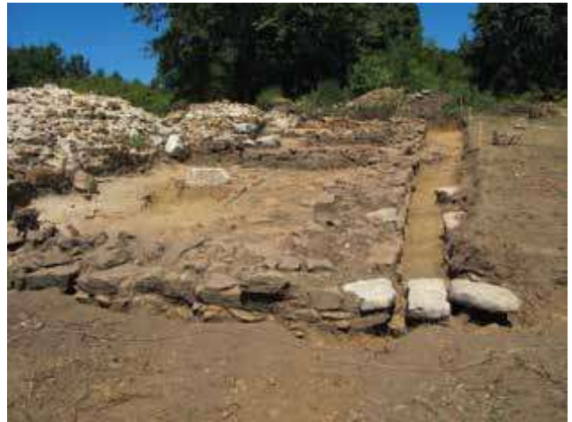
Slika 5. Prostorije 3, 2 i 1 duž unutrašnjeg lica zapadnog bedema severno od zapadne kapije, sa juga.

Zanimljivo je otkriće reda od tri ploče od krečnjaka, koji se od jugoistočnog spoljnog ugla prostorije 3 pružao u pravcu istoka, što moža ukazuje i na postojanje drugih objekata u unutrašnjosti utvrđenja. (sl. 4 a, sl. 5)