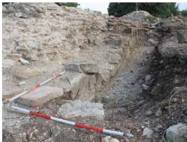
Slika 8. Deo unutrašnjosti prostorije 4 uz unutrašnje lice zapadnog bedema, sa jugoistoka.