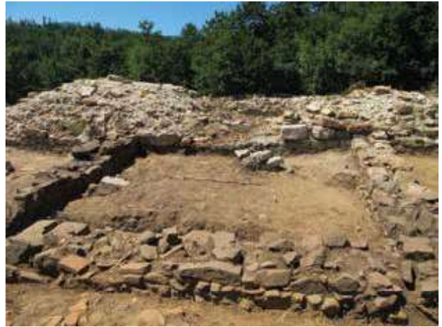
Slika 4b. Prostorija 2 ispred ulaza u kulu 2, sa istoka.