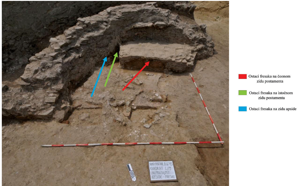
Slika 5a – Položaj fresaka u apside

– „obluci“. Taj sloj je konzervatorskim postupkom skinut i prenesen u atelje. Dekoracija petog sloja, slikana različitim oker i crvenim tonovima, oponaša mermernu oplatu. Poslednji, odnosno najstariji sloj je ostavljen na zidu in situ zbog znatnih oštećenja.