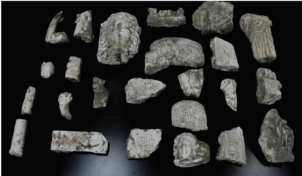
Slika 9 – Nalazi od mermera

Južno od objekata, ispitan je zapadni deo prostora koji je tokom druge polovine 2. veka najverovatnije služio kao đubrište. Kao i u ranije istraženom istočnom delu (Nikolić et al. u štampi) i u zapadnom se javljaju tragovi gorenja – garež, ugarci drveta, pepeo i zapečena zemlja, između kojih je sloj gline debljine od 0,05 do 0,50 m (sl. 8). Brojni su nalazi životinjskih kostiju, uglavnom nagorelih, kao i fragmenti keramike, među kojima su zastupljeni i delovi istih posuda nalazeni na različitim dubinama. Pomenuti prostor je površine oko 38 m 2 i dubine 3 do 5 m.