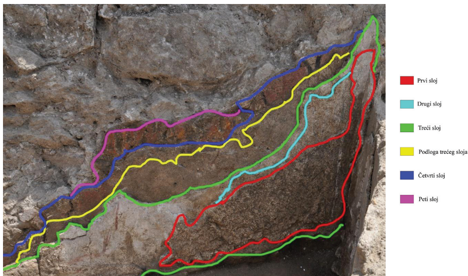
Slika 5b – Slojevi fresaka na zidu apside