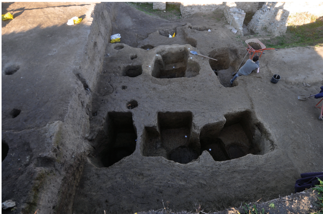
Slika 2 – Jugozapadni deo amfiteatra

Sistematska arheološka istraživanja amfiteatra vrše se u kontinuitetu od 2007. godine. Cilj iskopavanja vođenih u 2015. godini je bio da se istraže u potpunosti celine otkrivene tokom prethodne kampanje (Nikolić et al. u štampi), te su radovi u manjem obimu bili vršeni u jugozapadnom delu amfiteatra, dok je većim delom istraživani prostor jugoistočno od objekta (sl. 1). 2