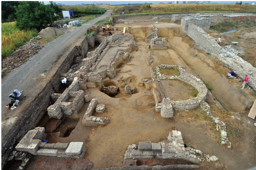
Slika 3 – Objekti, pogled sa severoistoka

U jugozapadnom delu objekta istražene su jame sa ukopima, koje predstavljaju ostatke drvenih stubova tribina amfiteatra. Na osnovu njihovih oblika i dimenzija može se zaključiti da su stubovi, kao i u ranije istraženim delovima tribina, bili kvadratnog ili pravougaonog preseka, dimenzija 0,20 m x 0,20 m ili 0,25 m x 0,25 m, odnosno 0,40 m x 0,30 m. Stubovi su raspoređeni u četiri lučna niza paralelna sa ogradnim zidom arene (sl. 2). Raspored i međusobni odnos ukopa i jama, kao i pregled pokretnog arheološkog materijala, ukazuju na postojanje dve osnovne faze izgradnje: stariju, kada je amfiteatar bio izgrađen od drveta, i mlađu fazu u kojoj je za izgradnju zidova objekta korišćen kamen, a za trbine drvo.