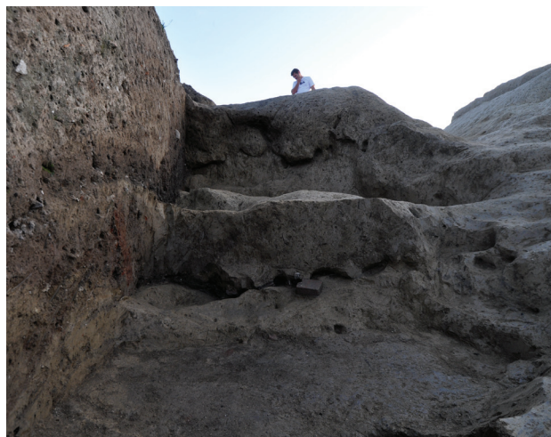
Slika 8 – Prostor južno od objekata

Mlađi objekat je podignut na istom prostoru, uokvirujući stariji, na udaljenosti od 0,3 m, odnosno na 0,5 m u apsidalnom delu. Dužina objekta je 20 m, a širina u centralnom delu iznosi 10 m. Jugozapadni deo objekta predstavlja pravougaoni prostor – prostorija dužine 15,50 m i širine 9 m, sa apsidom na jugozapadnom zidu širine 6 m i dubine 5 m. Može se samo pretpostaviti da je pravougaoni prostor, kao i kod starijeg objekta, bio podeljen na tri „broda“. Za razliku od starijeg, u severoistočnom delu mlađeg objekta se uočava prostor kvadratnog oblika, unutrašnjih dimenzija 9 m x 9 m. Na severozapadnom zidu objekta se nalazi još jedna apsida, sa dve bočne prostorije severno i južno, istražene 2012. godine