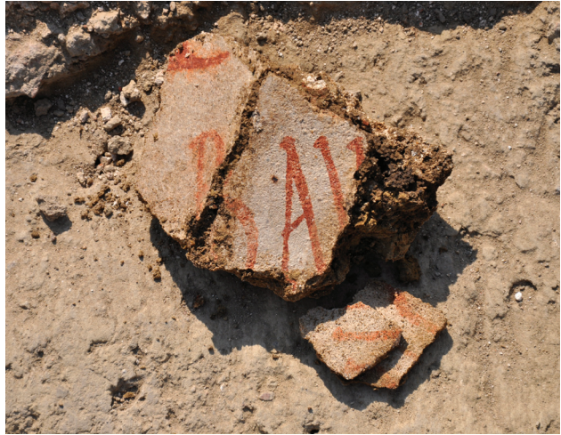
Slika 6 – Delovi fresaka sa natpisom

U centralnom delu apside, uz sam zid se nalazi ispust, tj. postament četvoro-ugaone osnove sa konkavnim kraćim stranama, zidan od redova opeka vezanih krečnim malterom. Dužina postamenta iznosi 2 m, širina 1/1,10 m, a sačuvan je u visini od 0,40 m. Na osnovu tragova maltera na zidu apside, konstatovano je da je njegova puna visina verovatno iznosila 0,95 m. Na postamentu su otkrivena i dva sloja freskoslikarstva, koja su delimično očuvana na čeonjoj i na istočnoj strani (sl. 5a). Zbog nemoćnosti konzervacije na terenu, oba sloja su skinuta sa zida i preneti u atelje na dalji tretman. Motive obe faze freskoslikarstva čeonog dela predstavljaju „obluci“ različitih dimenzija, s tim što se razlikuju podloge na kojima su slikani. Na prvom sloju maltera pozadina je oker, dok je na drugom sloju zelene boje. Na istočnoj strani postamenta prvi sloj je u velikoj meri bio uništen i na njemu nije uočen slikani sadržaj, dok je na beloj malternoj podlozi drugog sloja freskoslikarstva dekoracija izvedena u vidu kapljica, prskanjem različitih boja. Ispred apside nađeni su slojevi fresaka sa linearnom dekoracijom, kao i delovi sa natpisom u crvenoj boji na beloj podlozi maltera (sl. 6).