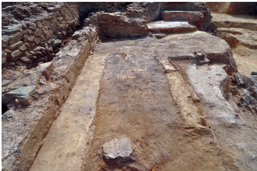
Slika 4 – Pregradni zidovi starijeg objekta

Stariji objekat je pravougaone osnove sa apsidom na jugozapadu, spoljašnjih dimenzija 18 m x 8,50 m. Građen je od lomljenog ramskog škriljca vezanog malterom, a mestimično je korišćena i opeka. Unutrašnji zidovi su bili omalterisani, o čemu svedoče slojevi maltera očuvani uglavnom na zapadnoj strani istočnog zida. Širina zidova iznosi 0,55 m, a njihova maksimalna visina, sačuvana u manjim segmentima, je 0,50 m. Objekat je fundiran u zdravici, a s obzirom da je teren u prirodnom padu od jugoistoka ka severozapadu, visina temljene zone je od 0,60 do 0,80 m.