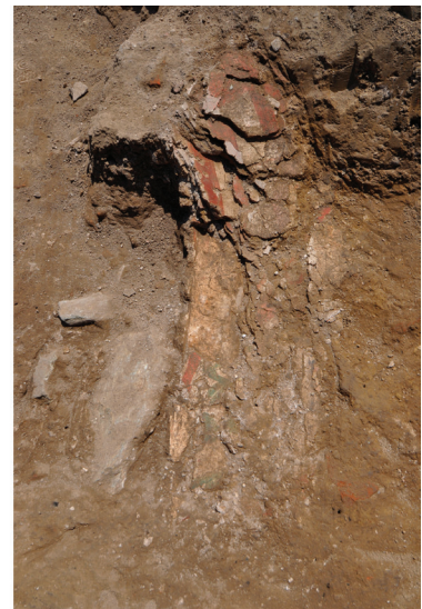
Sl. 7a, b – Ostaci stuba i slojevi fresaka