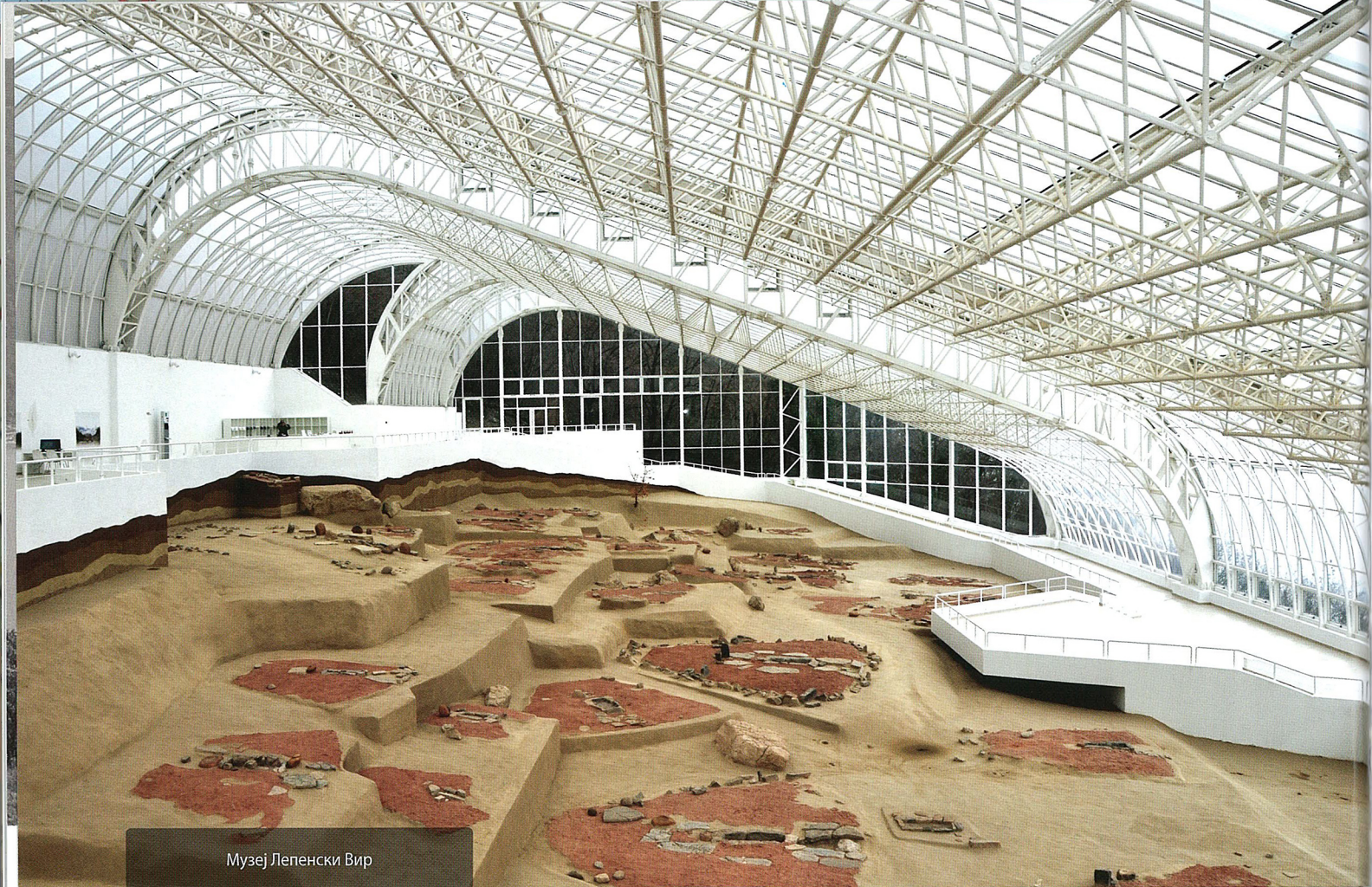
Музеј Лепенски Вир

најубедљивије сведочанство о уметности и систему веровања у мезолитском периоду. Међу бројним налазиштима из позније праисторије посебно место заузима АРХЕОЛОШКИ ЛОКАЛИТЕТ *РУДНА ГЛАВА.