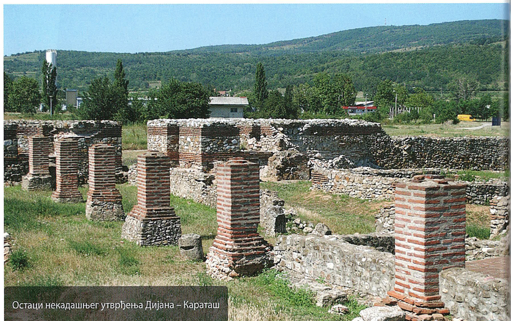
Остаци некадашњег утврђења Дијана – Караташ

У римском периоду Ћердап је чинио део система границе Римског царства, лимеса, који је на истоку европског дела Империје пратио токове великих река Рајне и Дунава. Део Римског лимеса у Ћердапу припадао је провинцији Горњој Мезији ( Moesia Superior ), а у касноантичком периоду провинцијама Првој Мезији ( Moesia Prima ) и Приобалној Дакији ( Dacia Ripensis ). Настао је у првој половини I в. н. е., а коначно је пао крајем VI в., под ударом Авара Првог каганата. Римски каструми на излазу из Ћердапа, Diana на Караташу и Transdrobeta/Pontes – ТРАЈАНОВ МОСТ код