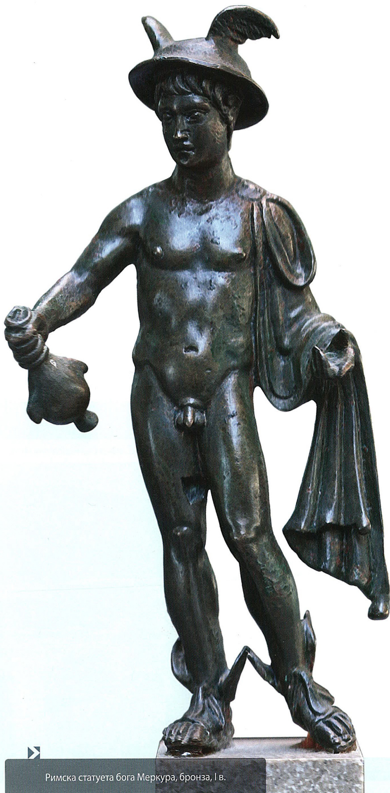
Римска статуета бога Меркура, бронза, I в.

портрети, представе богова. Поставка је допуњена документарном грађом која приказује потопљене локалитете, ископавања налазишта и њихове истраживаче.