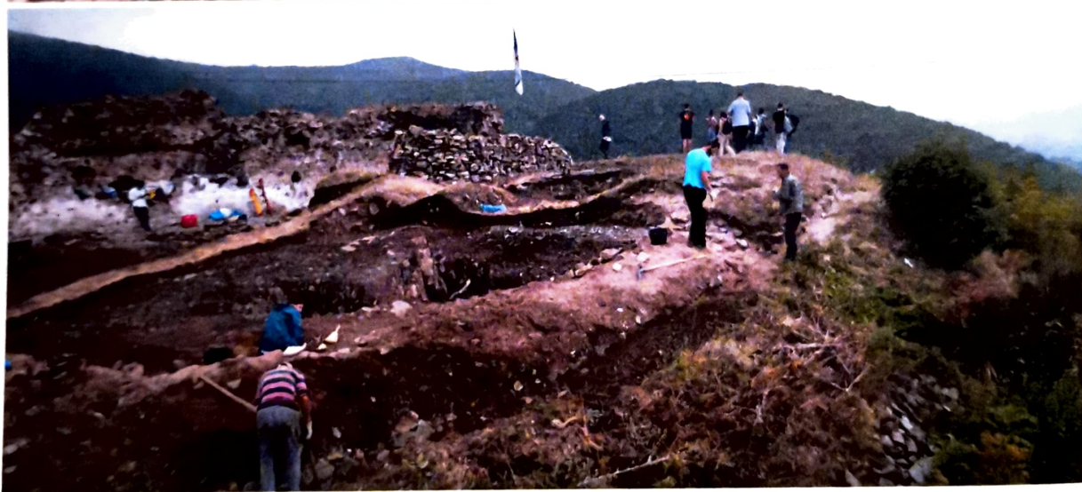
Сл. 1-2. Тврђава Копријан у току ископавања, поглед са северозапада

клинова, потковица, алки, врхова стрела за лук, као и оних за самострел. Уз то, било је и неколико камених ђулади.