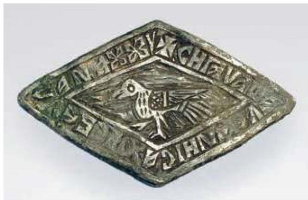
Сл. 95. Апликација са чаше челника Хребељана

занатском вештином. Свакако предмет посебне наруцбине, оне су могле бити и владарев поклон властелину у знак захвалности за верну службу. Драгоцене чаше су остављане у поклад и биле залог за преживљавање у тешким временима. 50 Апликација са једне такве чаше је откривена у припрати цркве у Великој Крушевици, у гробу који је највероватније припадао челнику Хребељану. Власништво откривене чаше је истакнуто српскословенским натписом: сн| чаша челника хребелана, који је, уз стилизоване цветне мотиве, уоквиравао централно поље украшено мотивом птице (сл. 95). 51