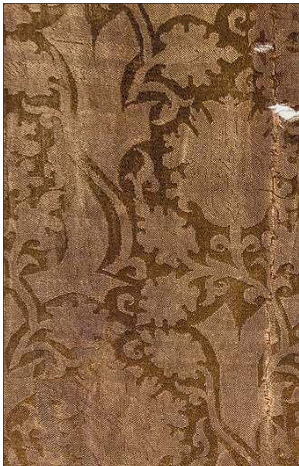
Сл. 93. Хаљина, детаљ, прва половина XV века, Петрова црква код Н. Пазара