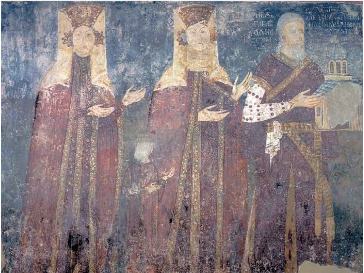
Сл. 92. Ктиторска композиција из Беле цркве каранске, XIV век

93). 31 На посебну вредност те тканине указује чињеница да је била поново употребљена како би се од ње искројила нова хаљина, вероватно након коначног пада Деспотовине. 32 На приближан начин су компоновани и мотиви на тканинама пореклом из Венеције, које се данас чувају у Берлину, односно у Богородичиној цркви у Данцигу. 33 Ваља подсетити на то да је сличан дезен таласасте стабљике предста-