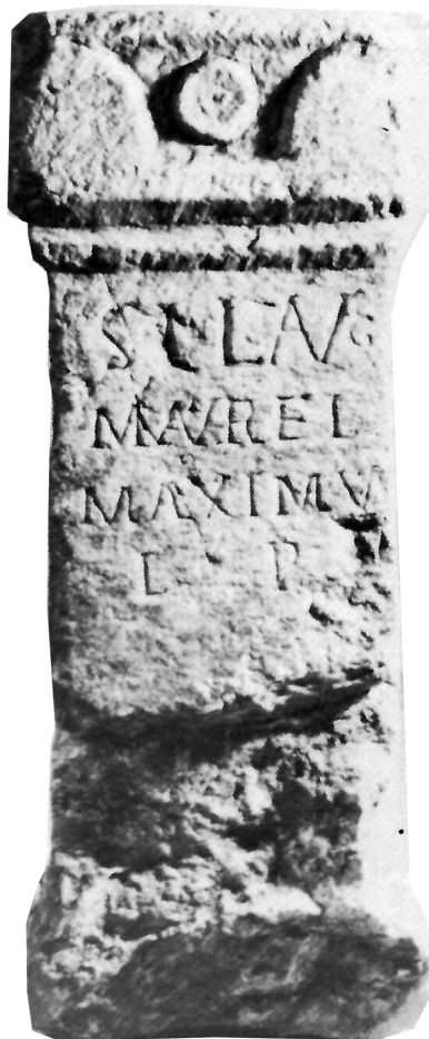
Slika 2. Ara, krečnjak (Imamović 1977, sl. 24)

2. Ara, krečnjak, dimenzija: 0,64 x 0,21 x 018 m. Dole oštećena celom širinom. Na kapitelu akroteriji, a u sredini najverovatnije rozeta.