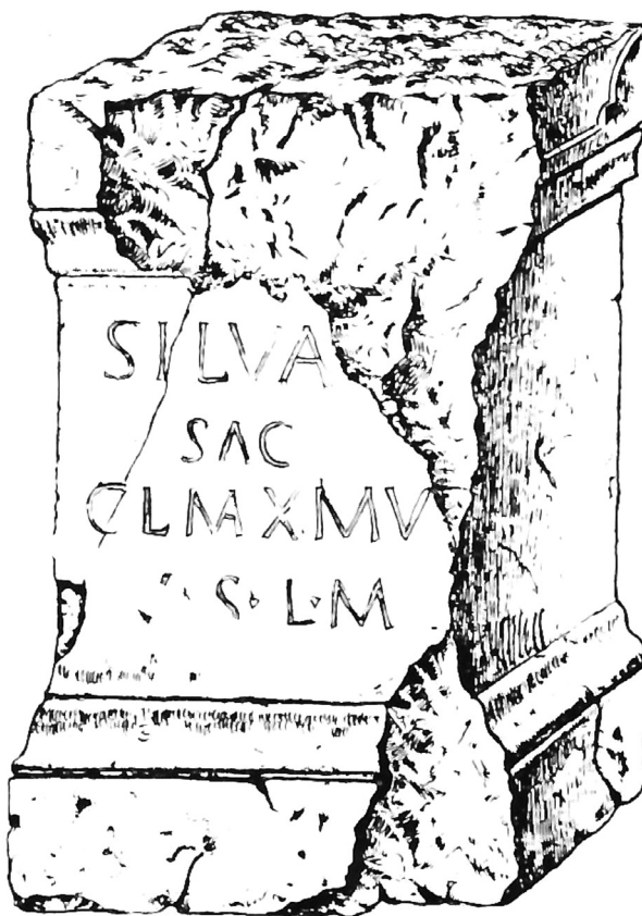
Slika 1. Ara, krečnjak (Imamović 1977, sl. 23)

Silva[no]/ sac(rum)/ Cl(audius) M[a]ximus/ v(otum) s(olvit) l(ibens) m(erito)