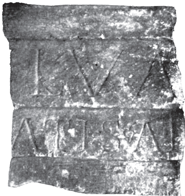
Slika 7. Epistilna greda, krečnjak (Вулић 1941–1948, сл. 2)