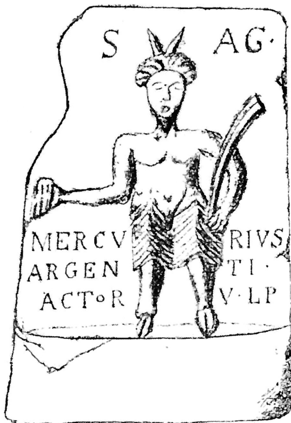
Slika 5. Votivni reljef, krečnjak (Зотовић 2001, сл. 5)

5. Votivni reljef, dimenzija 0,50 x 0,35 m. Silvan predstavljen kao Pan, u desnoj ruci drži sirinks, u levoj pastirski štap.