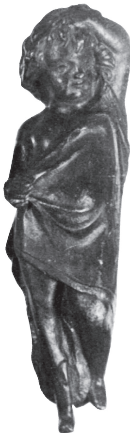
Slika 3. Statueta mladog Silvana, bronza