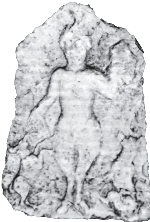
Slika 4. Votivni reljef, krečnjak (Zotović 1992–1993, sl. 1)

Lok.: nepoznato mesto nalaz, ali može biti sa šireg područja užičkog kraja (čuva se u depou Narodnog muzeja u Užicu)